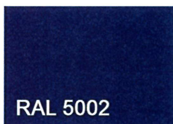
KOLOR SŁUPKÓW, RAMEK I TABLICZEK