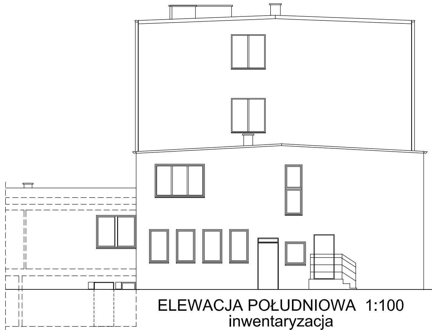
ELEWACJA POŁUDNIOWA 1:100 inwentaryzacja