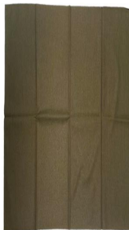
Szalik – chusta wielofunkcyjna – komin