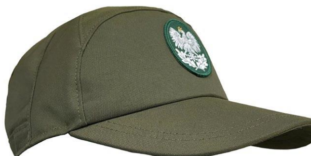
Czapka przeciwdeszczowa z daszkiem