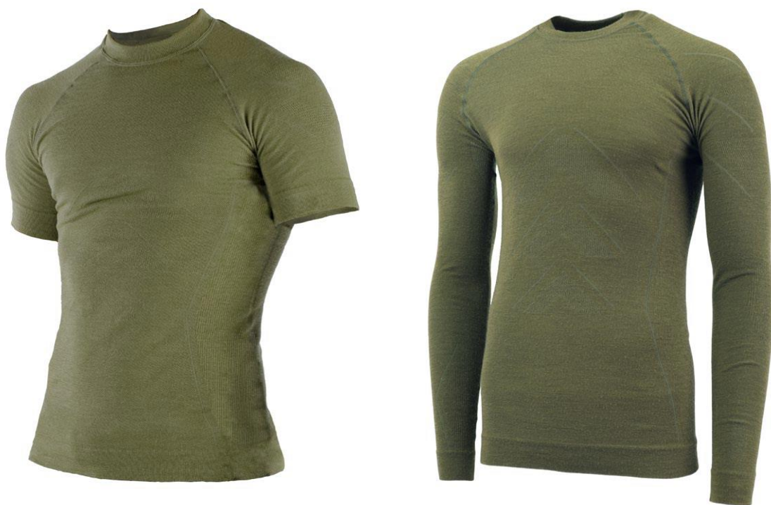
Koszulka termoaktywna krótki i długi rękaw