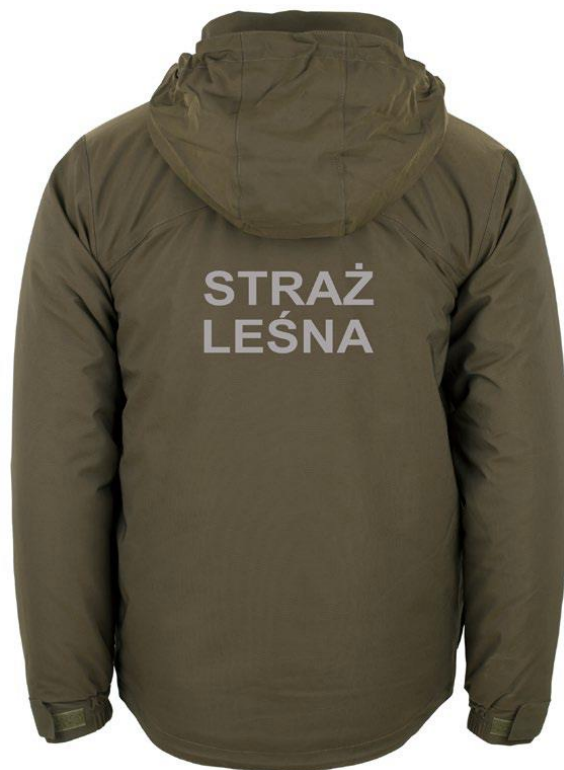
Kurtka ocieplana z podpinką