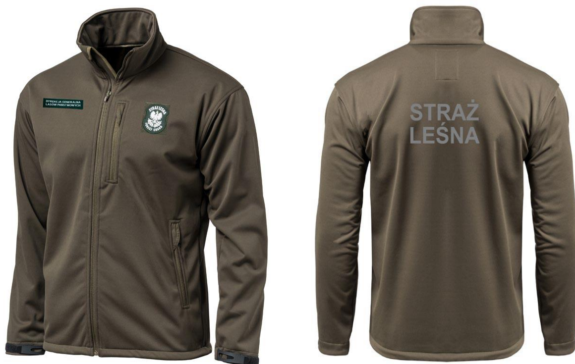
Bluza typu softshel