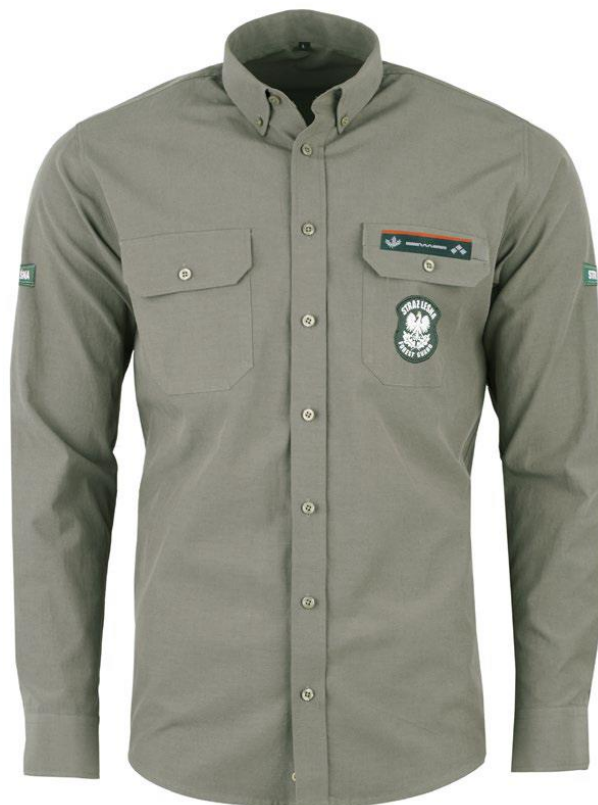
Koszule robocze krótki i długi rękaw