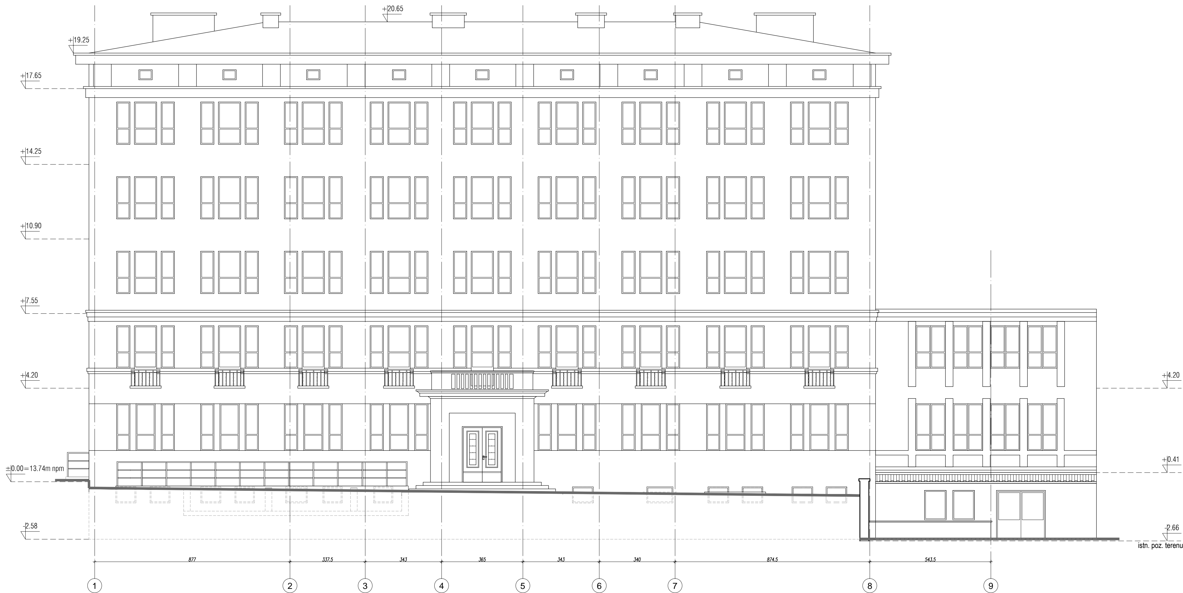
ELEWACJA PÓŁNOCNA SKALA 1:100