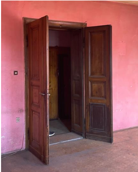
zdjęcie nr IMG_3693.jpeg