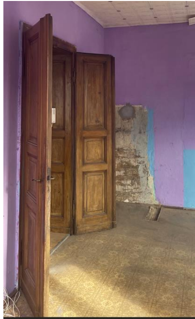
zdjęcie nr IMG_3667.jpeg