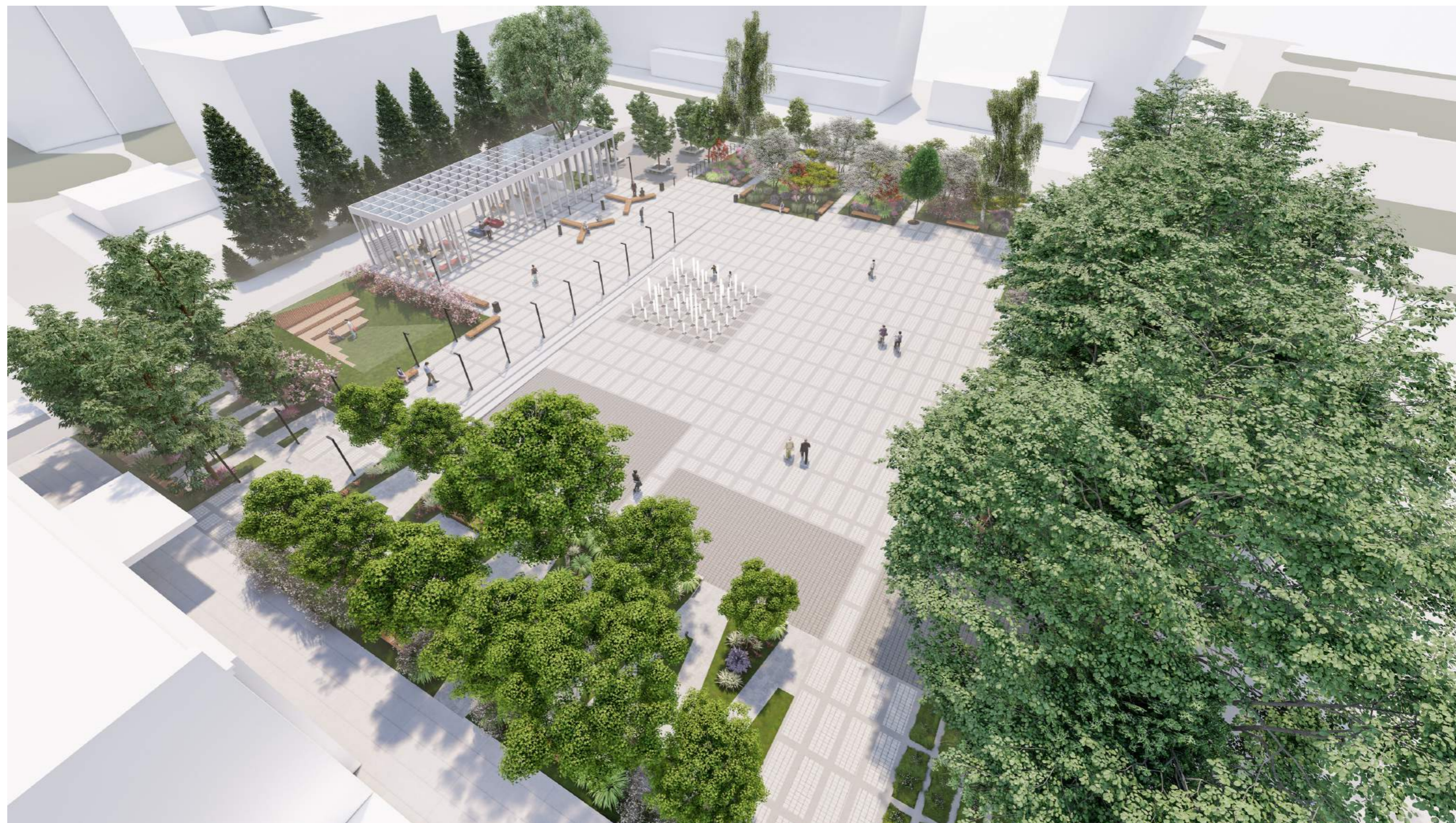
Projekt koncepcyjny placu przy fontannie w Choszcznie / 2021