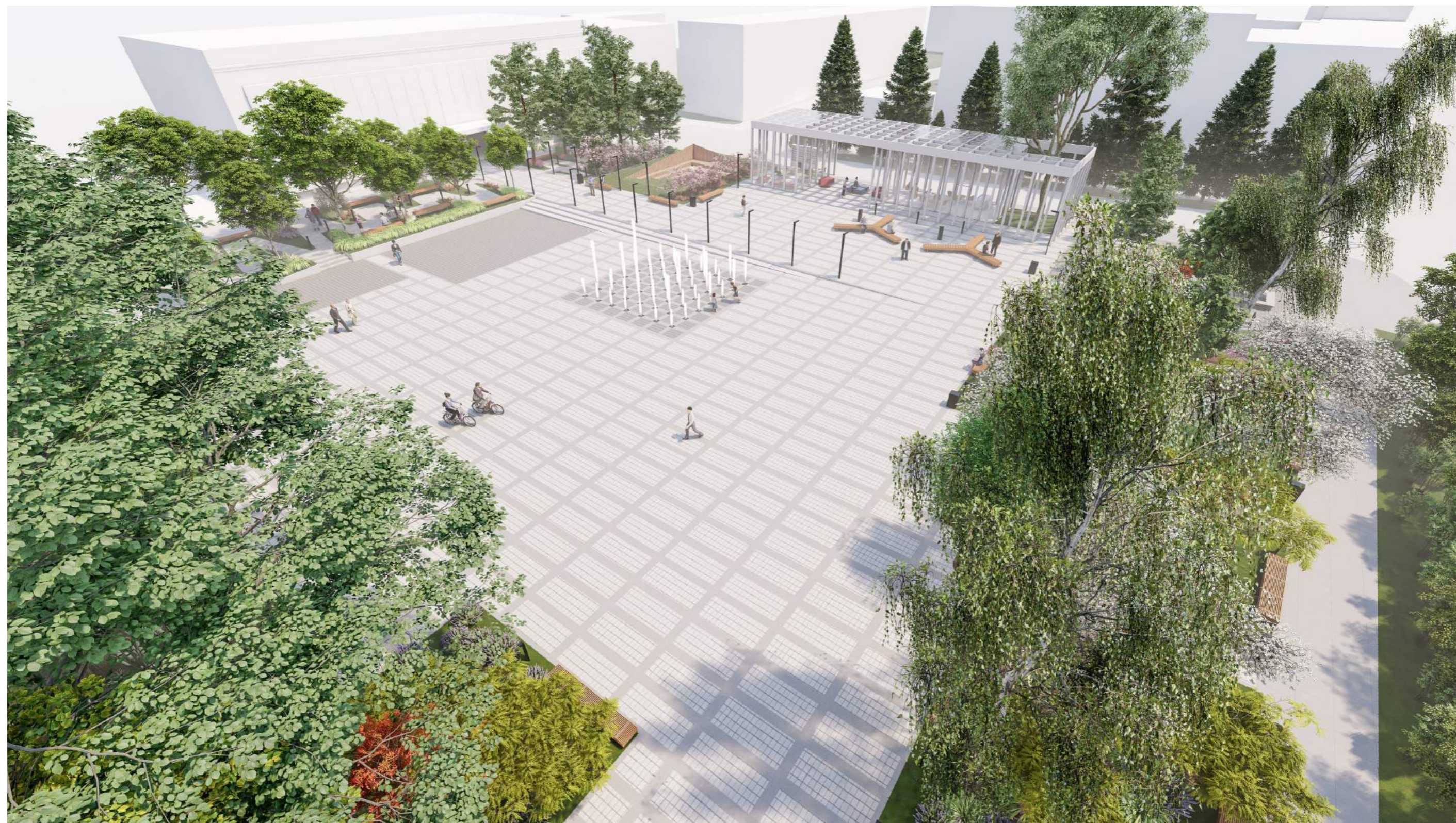
Projekt koncepcyjny placu przy fontannie w Choszcznie / 2021