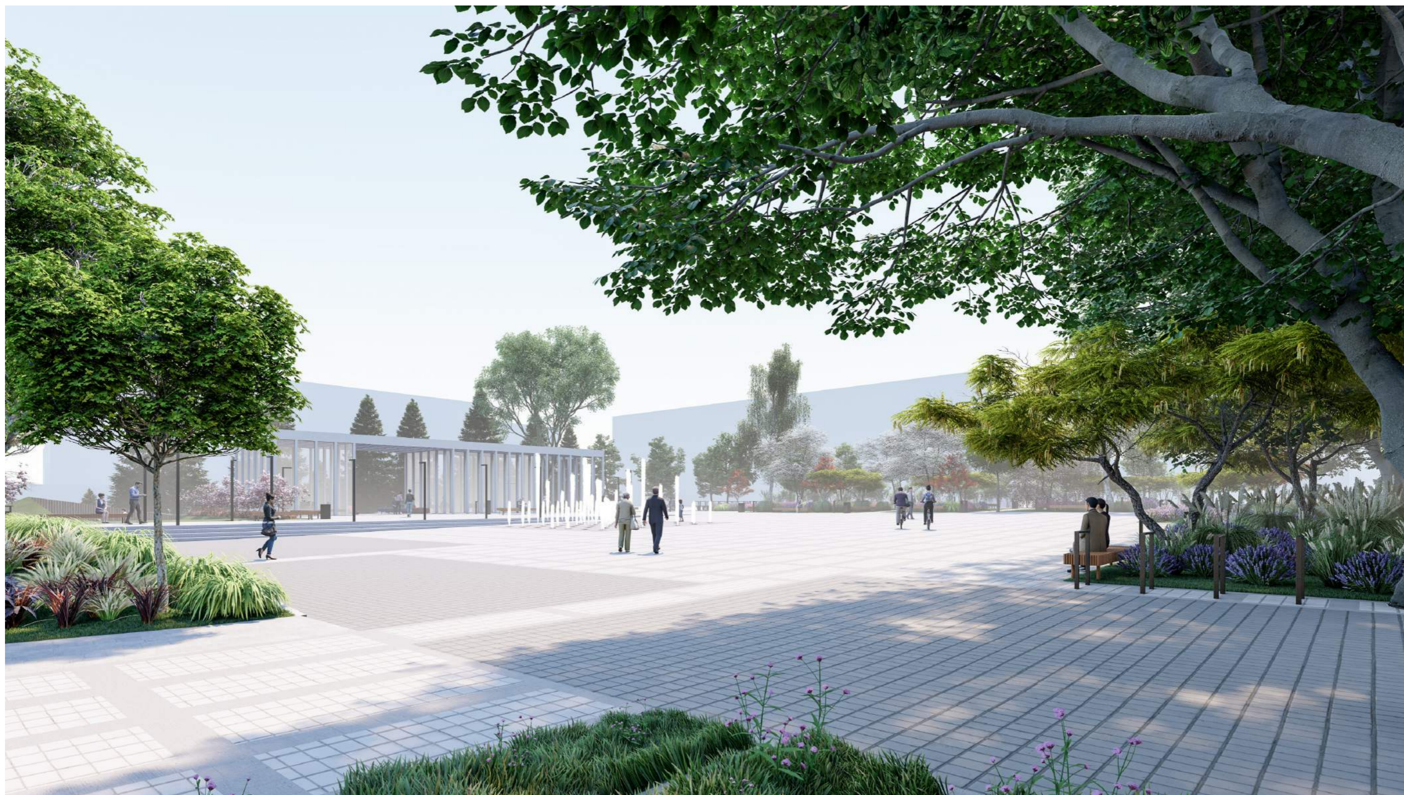
Projekt koncepcyjny placu przy fontannie w Choszcznie / 2021