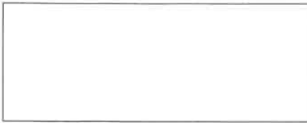
Pieczęć firmowa Wykonawcy