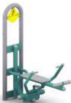
Przykładowa wizualizacja przedmiotu zamówienia - wioślarz