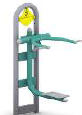
Przykładowa wizualizacja przedmiotu zamówienia – wyciskanie siedząc