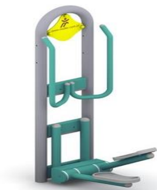
Przykładowa wizualizacja przedmiotu zamówienia - stepper