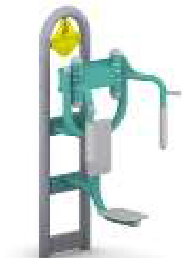
Przykładowa wizualizacja przedmiotu zamówienia – motyl