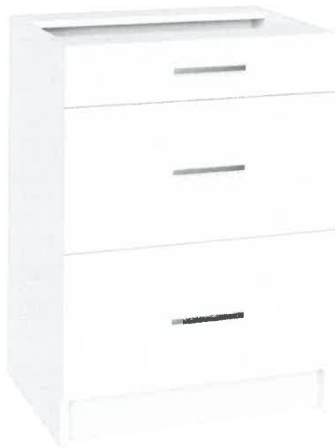
Poglądowe zdjęcie nr 6