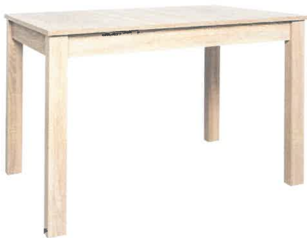
Poglądowe zdjęcie nr 3