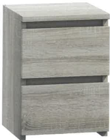
Poglądowe zdjęcie nr 5