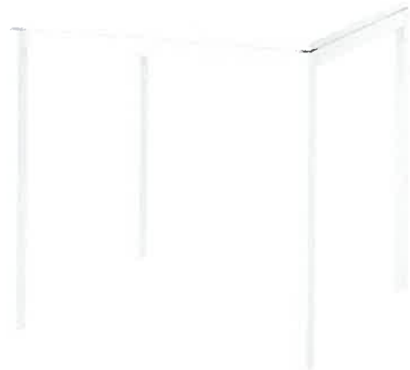
Poglądowe zdjęcie nr 4