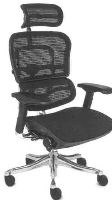
POGLADOWE ZDJĘCIE NR 2