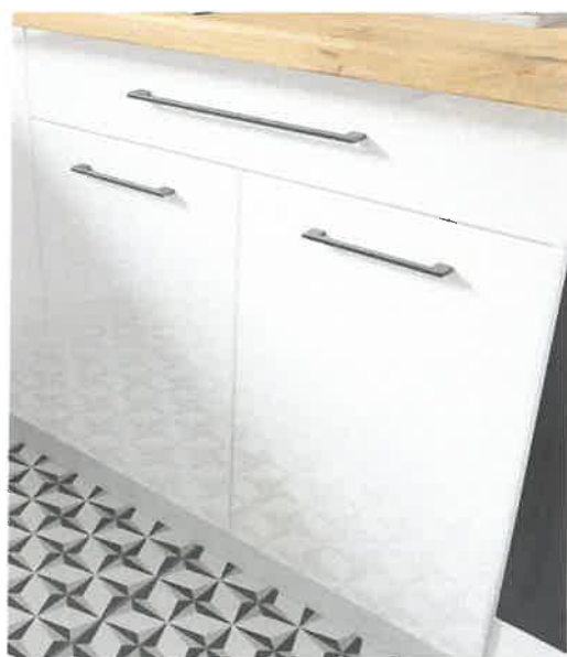
Poglądowe zdjęcie nr 7