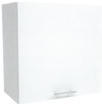
Poglądowe zdjęcie nr 8