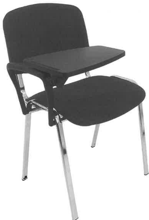
POGLADOWE ZDJĘCIE NR 3