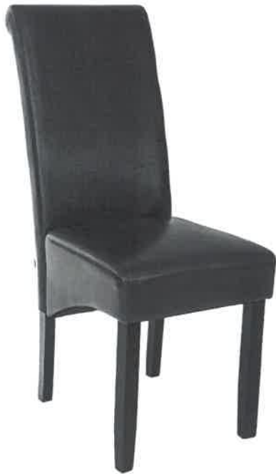
POGLADOWE ZDJĘCIE NR 5