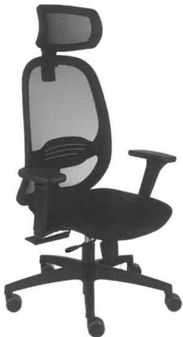
POGLADOWE ZDJĘCIE NR 1