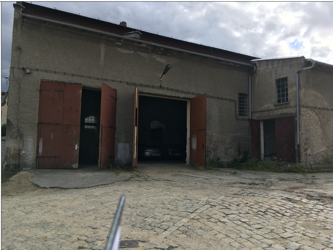
BRAMA nr 1, 2, 3