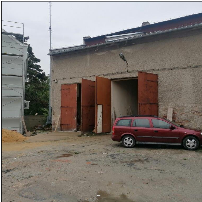
BRAMA nr 1, 2

UWAGA: Wszystkie rysunki należy rozpatrywać jednocześnie, w przypadku wystąpienia niejasności należy skontaktować się projektantem.