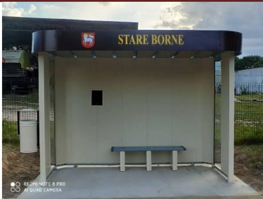
Wiata przystankowa w m. Stare Borne gm. Bobolice