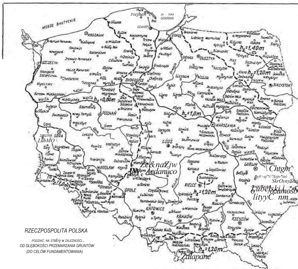
Rys. 1. Podział kraju na strefy w zależności od głębokości przemarzania gruntu (wg PN-81/B-03020)

5.3.6 Przewody sieci kanalizacyjnej na mostach, jeśli nie służą do odwodnienia jezdni i chodników, powinny być umieszczone w stalowych rurach ochronnych, zgodnie z wymogami rozporządzenia [4],