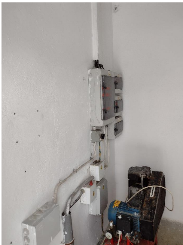
POMIESZCZENIE GOSPODARCZE – STAN ISTNIEJĄCY RYS. 10 - 12