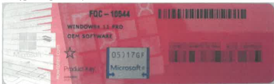
Rys. 1 przykładowy kod zabezpieczony przez producenta systemu Microsoft Windows 11 (takie same naklejki mają Windows 10) z wymazanym, znajdującym się przed i za szarą naklejką kodem licencyjnym

Poniższe zdjęcie obrazuje obecnie stosowane zabezpieczenia producenta firmy Microsoft (klucz systemu jest zabezpieczony naklejką hologramową przez producenta. Po jej zdrapaniu uzyskujemy dostęp do oryginalnego klucza):