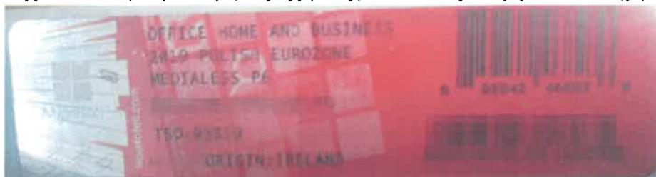
Rys. 2 przykładowy kod zabezpieczony przez producenta systemu Microsoft Windows Office Home&Business z wymazanym, znajdującym się w prawym dolnym rogu numerem seryjnym produktu. Kod licencyjny znajduje się w środku szczelnie zapakowanego i zafoliowanego pudełka (Rys. 3)