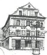
Kamienica „Pod Bykami”