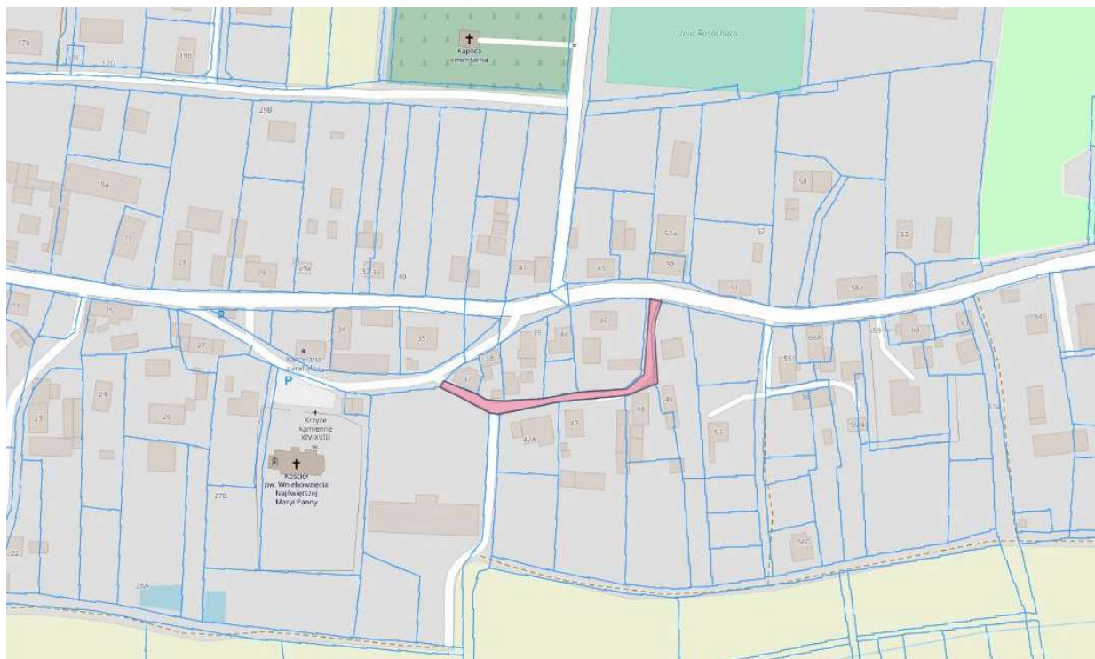
Fot. 3 – oznaczenie działek

Przedmiotem zamówienia jest zaprojektowanie oraz wykonanie robót i obejmuje: