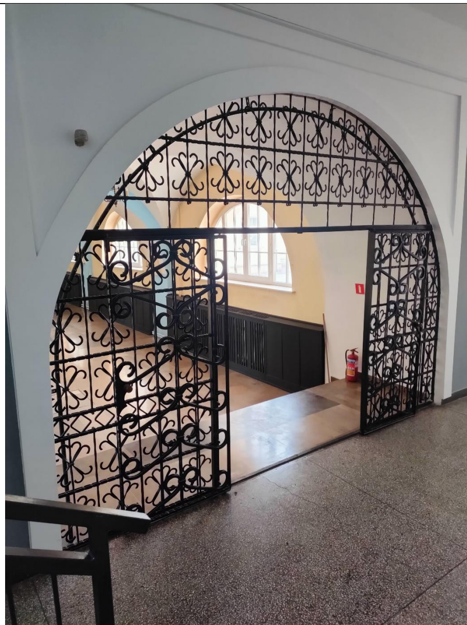
WIDOK OD ZEWNĄTRZ POMIESZCZENIA