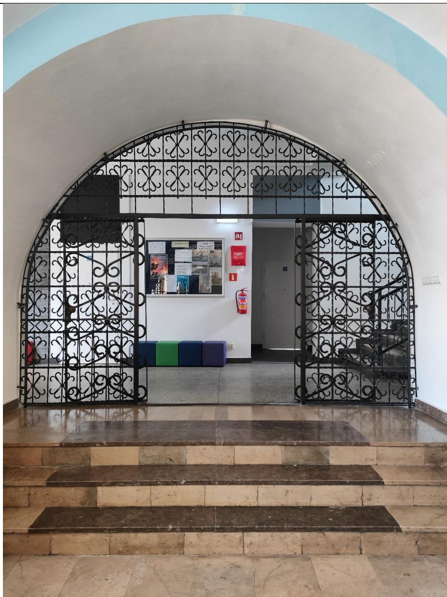
WIDOK OD WEWNĘTRZ POMIESZCZENIA