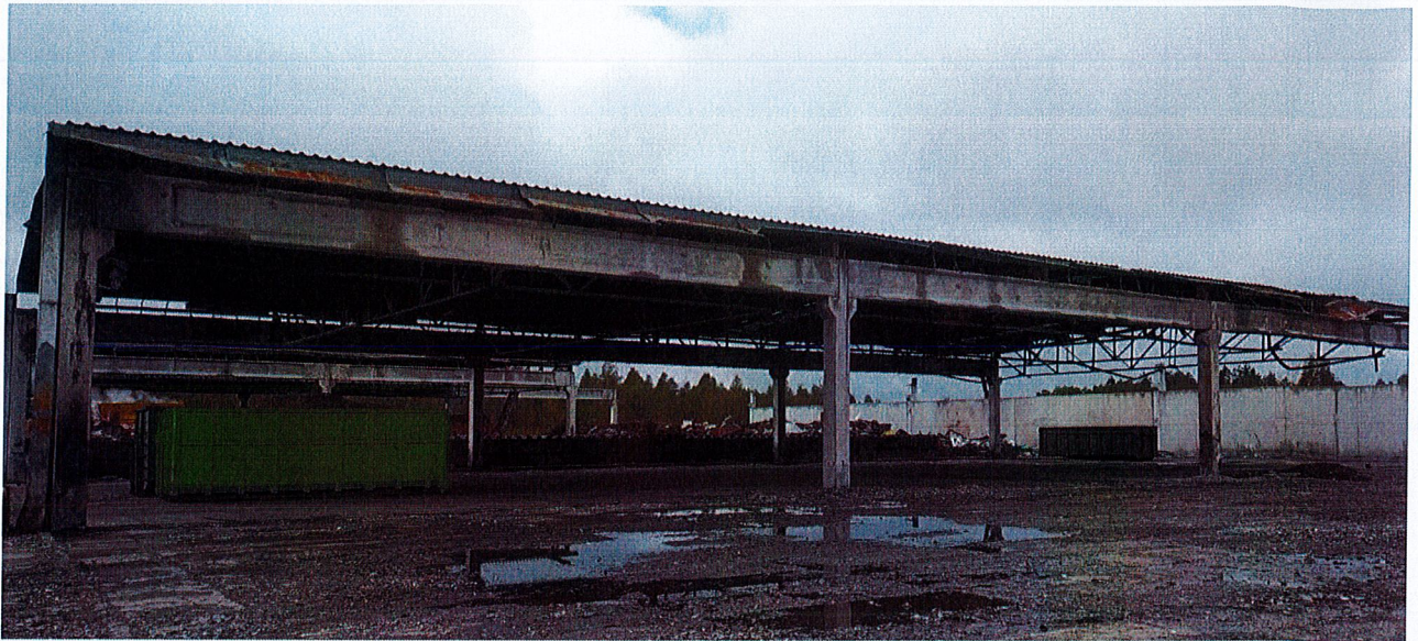
Zdjęcie 3: Widok ogólny konstrukcji nadziemnej do rozbiórki