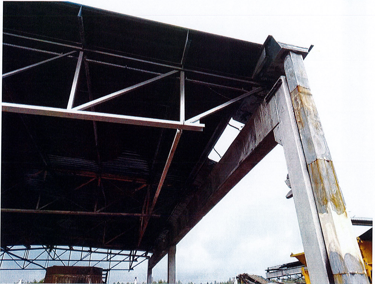
Zdjęcie 9: Konstrukcja frontowa wiaty