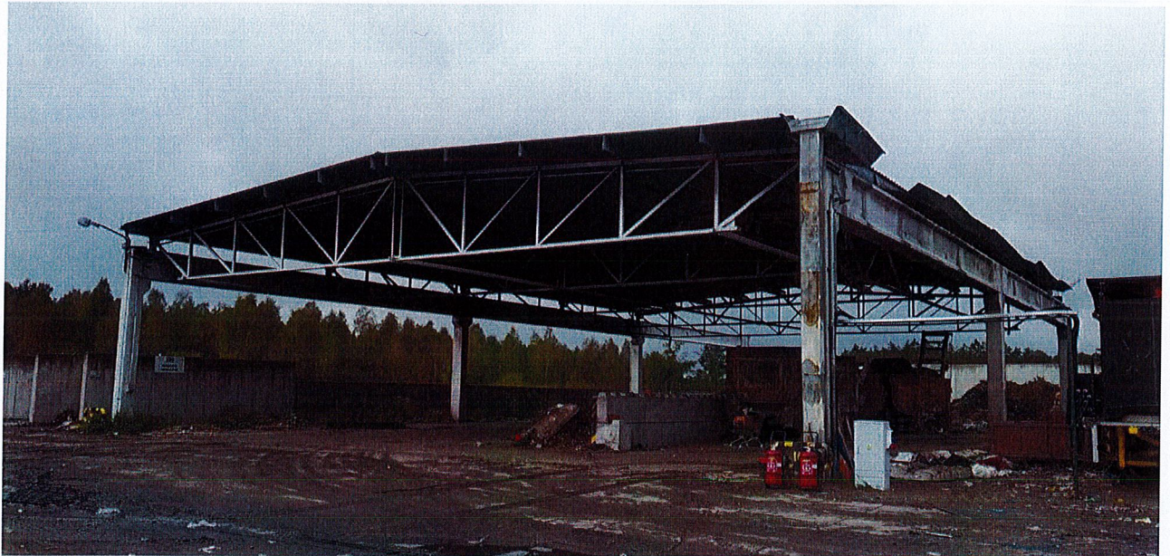
Zdjęcie 1: Widok ogólny nawy 1