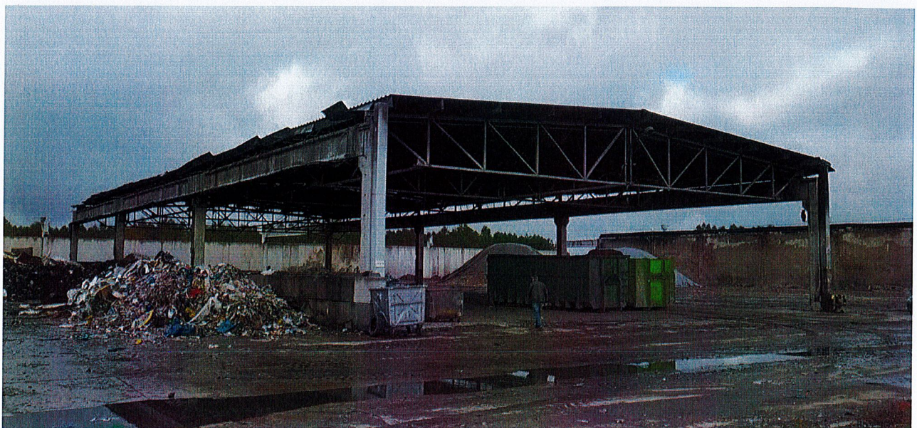
Zdjęcie 2: Widok ogólny nawy 2