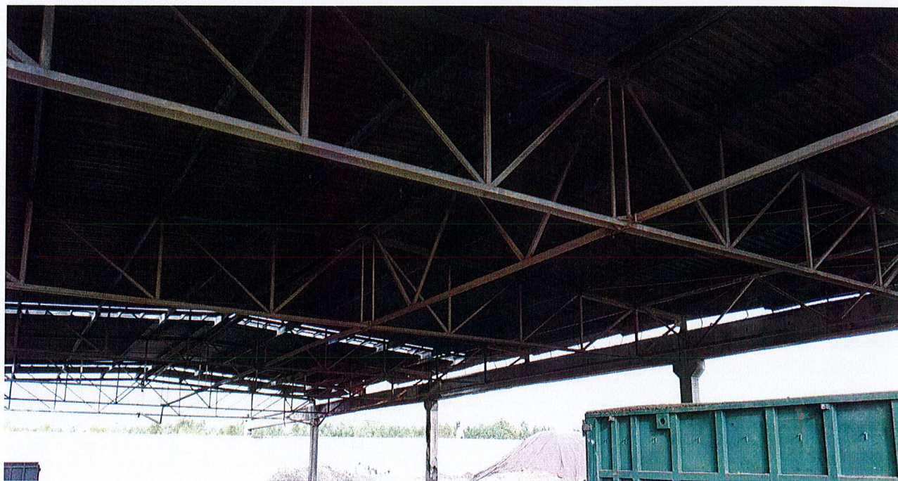
Zdjęcie 8: Widok ogólny konstrukcji nawy 2