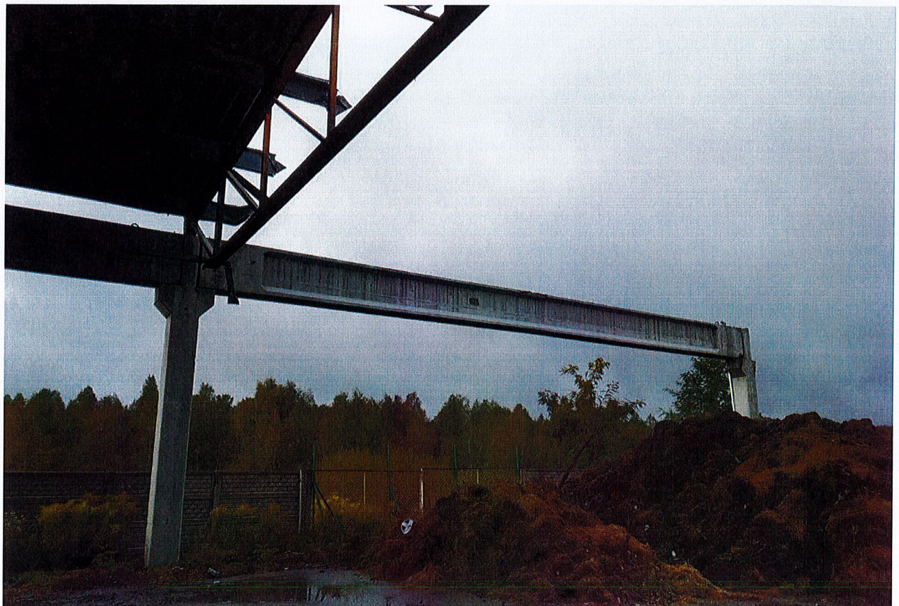
Zdjęcie 4: Konstrukcja prefabrykowana do rozbiórki