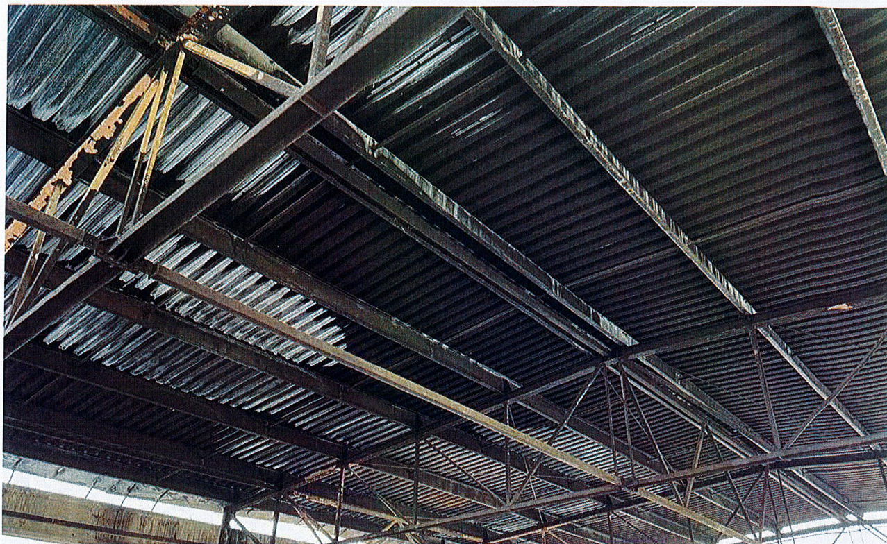
Zdjęcie 7: Pokrycie i konstrukcja stalowa do rozbiórki