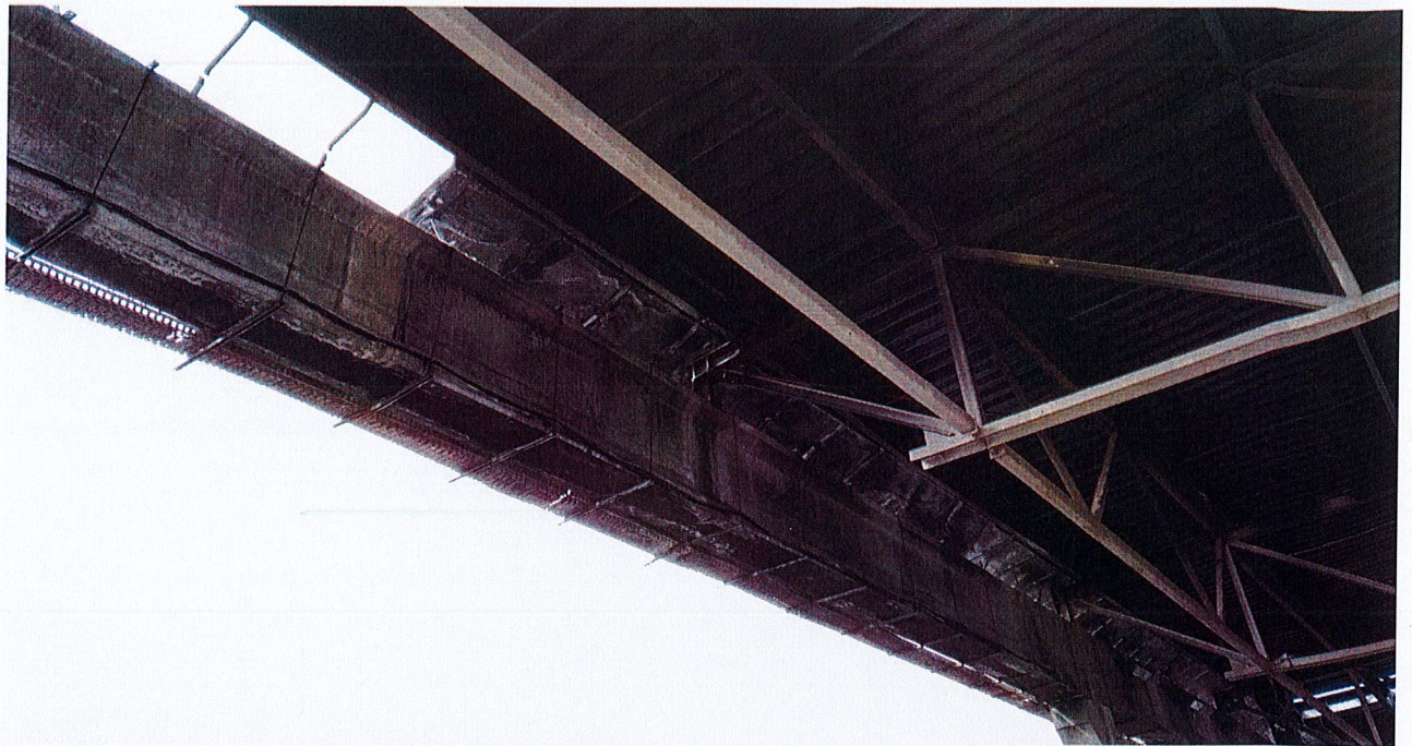
Zdjęcie 5: Belki prefabrykowane do rozbiórki