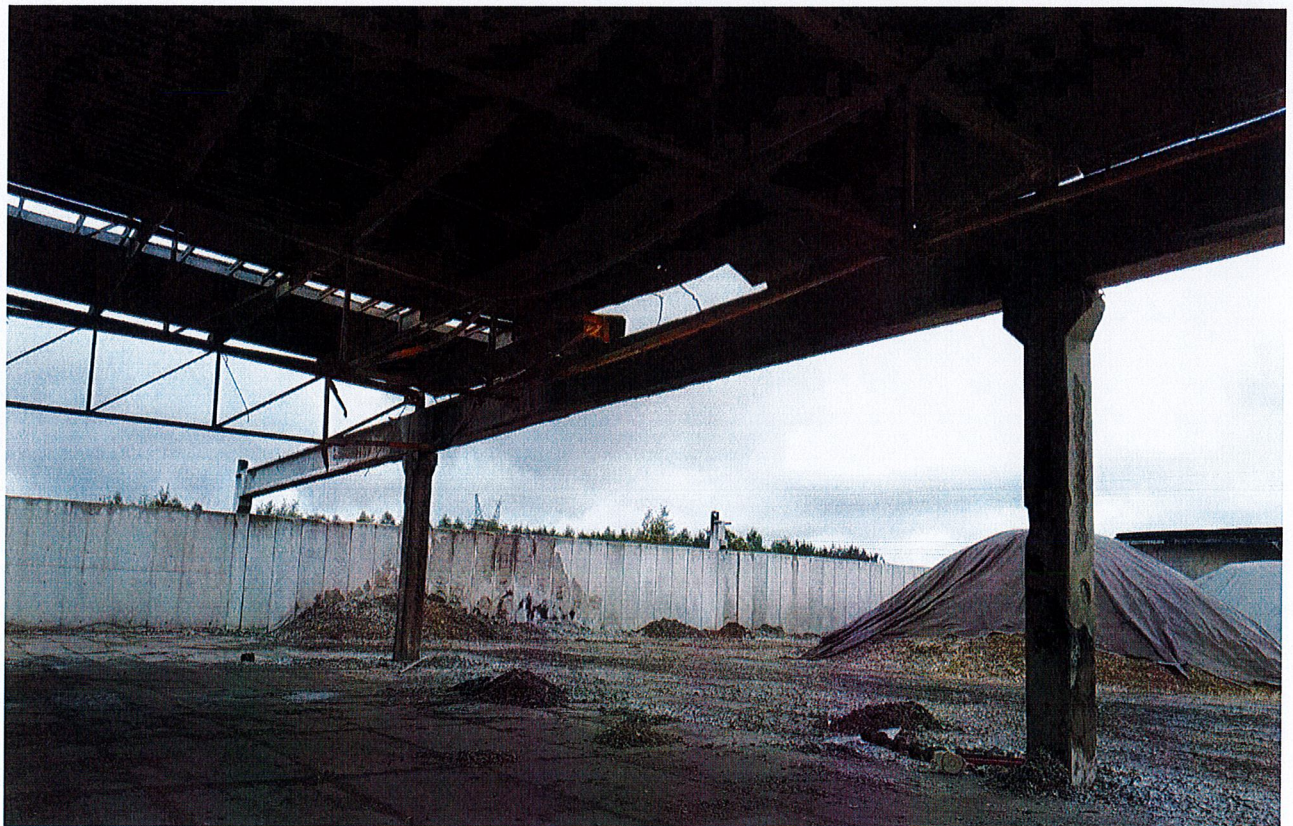
Zdjęcie 6: Konstrukcja stalowo-żelbetowa do rozbiórki