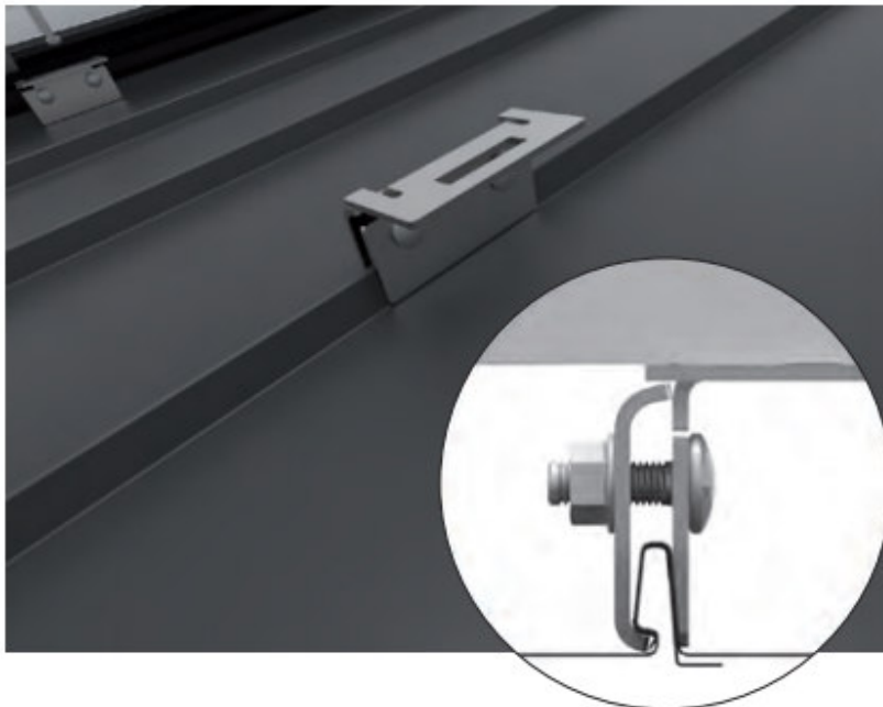
Rysunek 2. Przykład montażu panelu do rąbka blachy.

Dopuszcza się stosowanie innych konstrukcji do montażu paneli fotowoltaicznych dedykowanych do dachów skośnych pokrytym blachą na rąbek za zgodą Inwestora. Przykład mocowania konstrukcji do rąbka bez ingerencji w strukturę pokrycia dachowego przedstawia poniższy rysunek. Przed wykonaniem konstrukcji należy dobrać uchwyty do rąbka blachy.