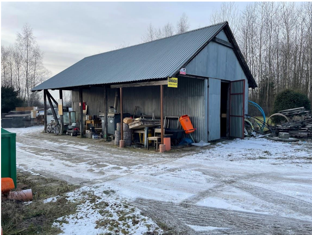
Rysunek 10. Zabudowania gospodarcze przy oczyszczalni ścieków w Lipnicy Wielkiej.