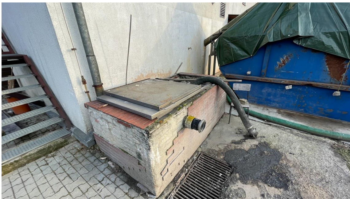
Rysunek 3. Punkt zlewny ścieków dowożonych do oczyszczalni ścieków Lipnica Wielka.

Pompa ścieków dowożonych posiada moc nominalną 4,8 kW.