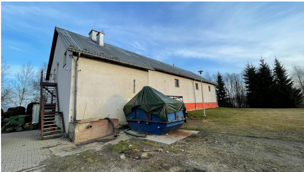
Rysunek 7. Kontener na odwodnione osady przy oczyszczalni ścieków Lipnica Wielka.