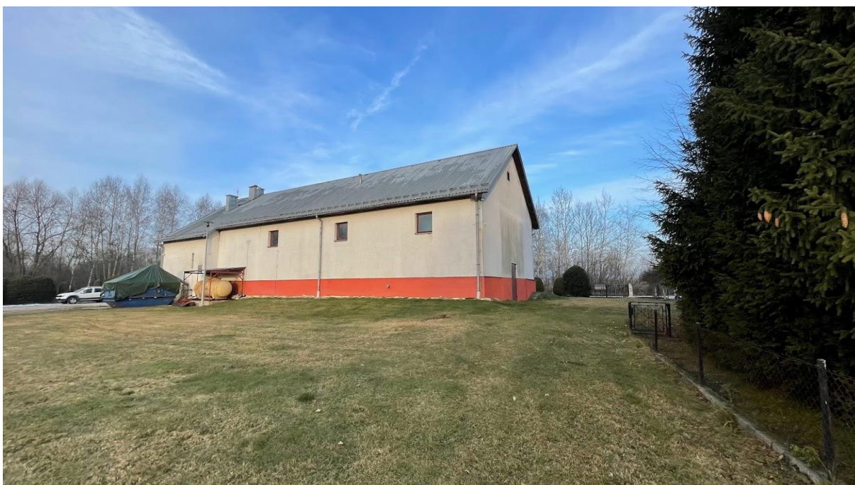
Rysunek 8. Budynek oczyszczalni ścieków Lipnica Wielka – elewacja południowa i wschodnia.

Oczyszczalnia zlokalizowana jest w budynku murowanym, częściowo obniżonym poniżej terenu o wymiarach 29,75 x 13 metrów. Budynek pokryty jest blachą oraz ocieplony styropianem. W budynku zlokalizowana jest automatyka do sterowania oraz większość elementów technologicznych oczyszczalni wraz ze stacją dmuchaw.