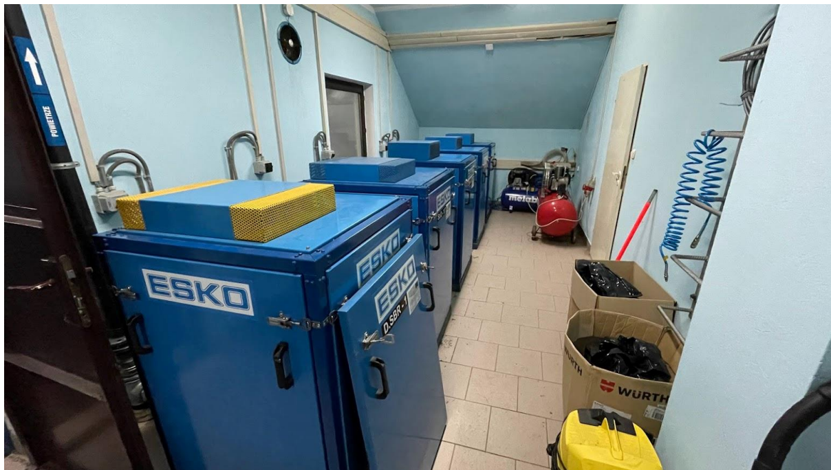
Rysunek 5. Stacja dmuchaw zlokalizowana w budynku oczyszczalni ścieków Lipnica Wielka (poziom +1).

W stacji dmuchaw ustawione są także dwa kompresory. Jeden z nich jest przynależny do prasy filtracyjnej do odwadniania osadu. Sprężone powietrze jest wykorzystane do siłowników napinania taśm filtracyjnych, oraz do napędu siłowników korekcji toru tych taśm. Kompresor drugi jest przeznaczony do zasilania w sprężone powietrze napędów pneumatycznych zasuw sterowanych automatycznie. Kompresor dla prasy filtracyjnej ma moc 2,2 kW i zbiornik powietrza 100 litrów. Kompresor dla zasilenia napędów zasuw ma silnik o mocy 4 kW i zbiornik powietrza 270 litrów.