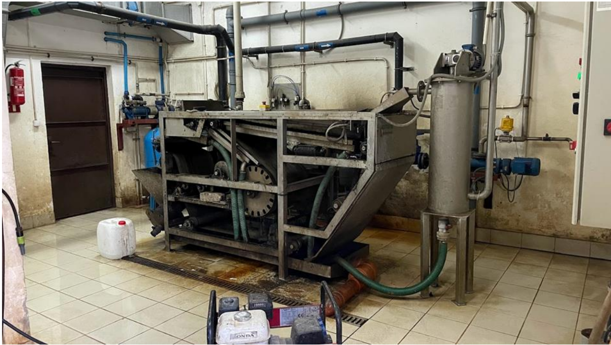
Rysunek 6. Stacja odwadniania osadu znajdująca się w budynku oczyszczalni ścieków Lipnica Wielka. (Poziom 0)

Dynamiczny mieszacz osadu z polielektrolitem: