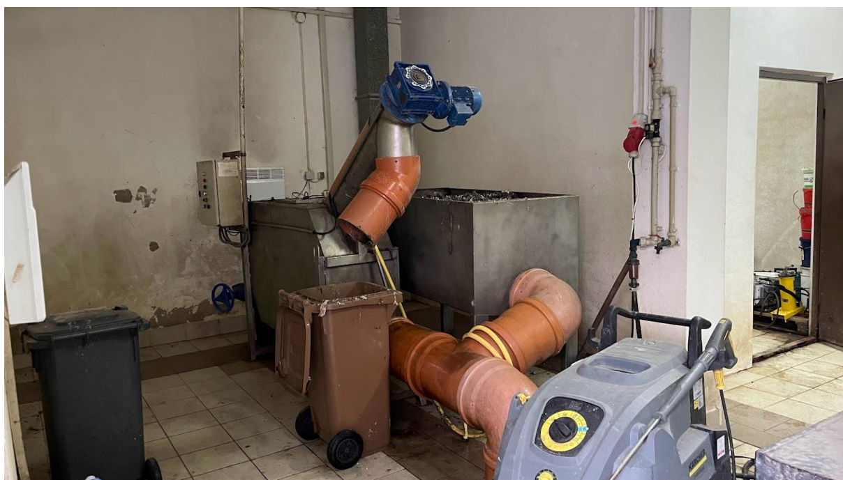
Rysunek 2. Sito mechaniczno – spiralne zlokalizowane w budynku oczyszczalni ścieków Lipnica Wielka. (Poziom 0)

Sito zamontowane jest w obudowie w formie prostopadłościennego zbiornika ze stali nierdzewnej o wymiarach L/B/H = 1450 / 450 / 1300mm. Ścieki oczyszczone mechanicznie w sicie odpływają grawitacyjnie do dwóch zbiorników retencyjnych, jeden zlokalizowany jest poniżej posadzki pod budynkiem, zaś drugi na zewnątrz obok budynku.