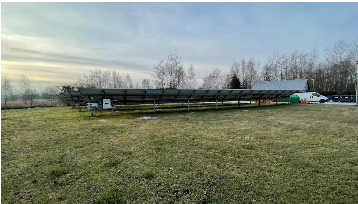
Rysunek 11. Instalacja fotowoltaiczna zlokalizowana na terenie oczyszczalni ścieków Lipnica Wielka.