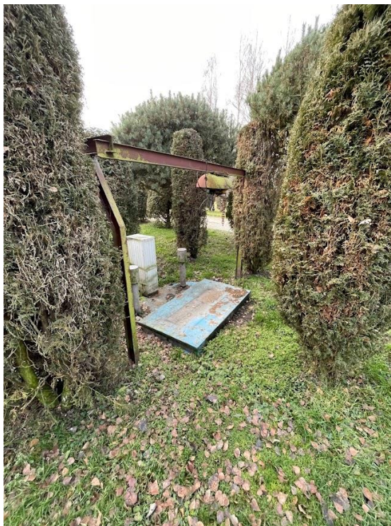
Rysunek 1. Pompownia ścieków z kratą koszową zlokalizowana na terenie oczyszczalni ścieków Lipnica Wielka.

Ścieki z pompowni są podawane ciśnieniowo do zlokalizowanego w budynku, na kondygnacji przyziemia sita mechanicznego.