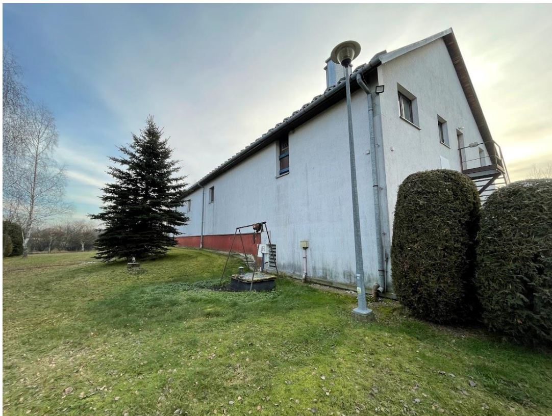
Rysunek 9. Budynek oczyszczalni ścieków Lipnica Wielka - elewacja północna i zachodnia.