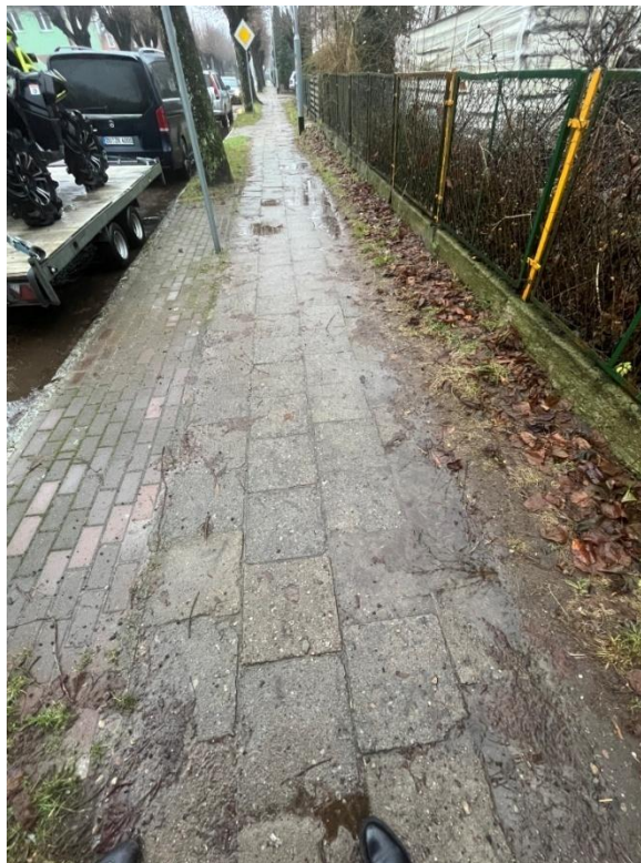
Zdjęcie nr 5