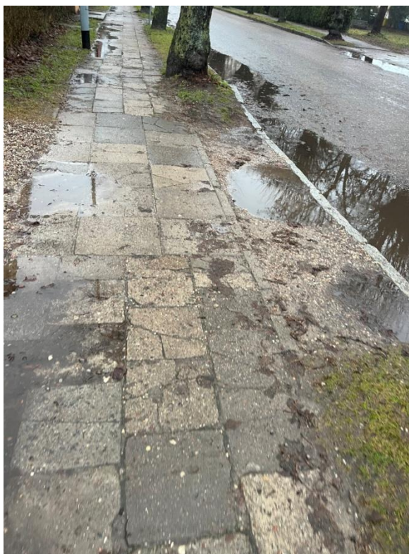
Zdjęcie nr 6