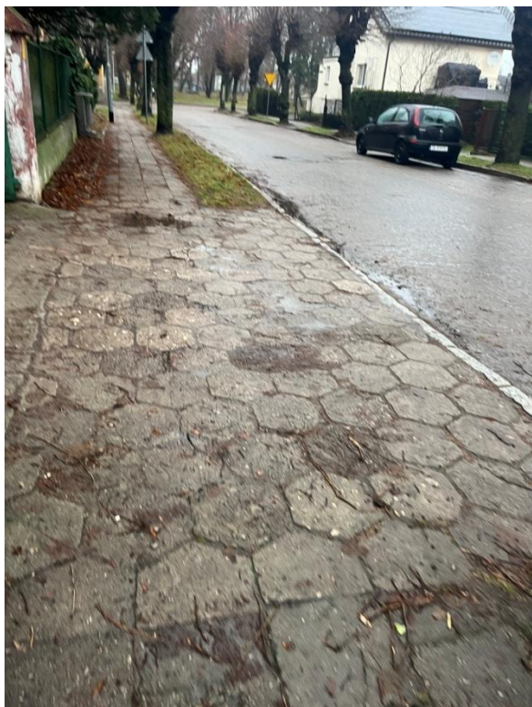
Zdjęcie nr 8