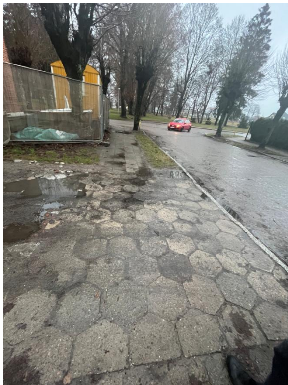
Zdjęcie nr 9