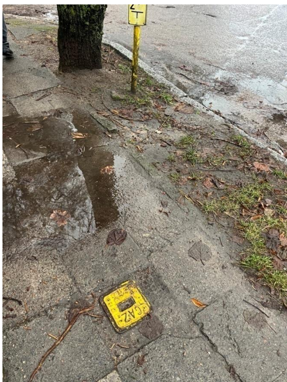
Zdjęcie nr 10