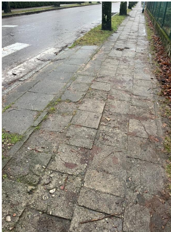
Zdjęcie nr 7