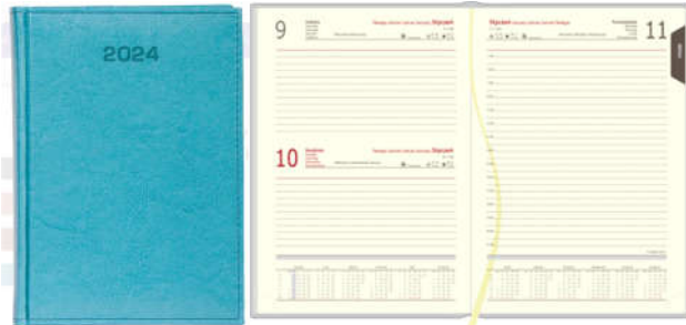
Grafika przedstawia poglądowe zdjęcie produktu

Pakowanie: w kartonowym opakowaniu zbiorczym, w ilości zapewniającej zabezpieczenie przed uszkodzeniem i zabrudzeniem podczas transportu, przenoszenia i przechowywania. Karton opisany np. kalendarz książkowy i ilość sztuk w kartonie.