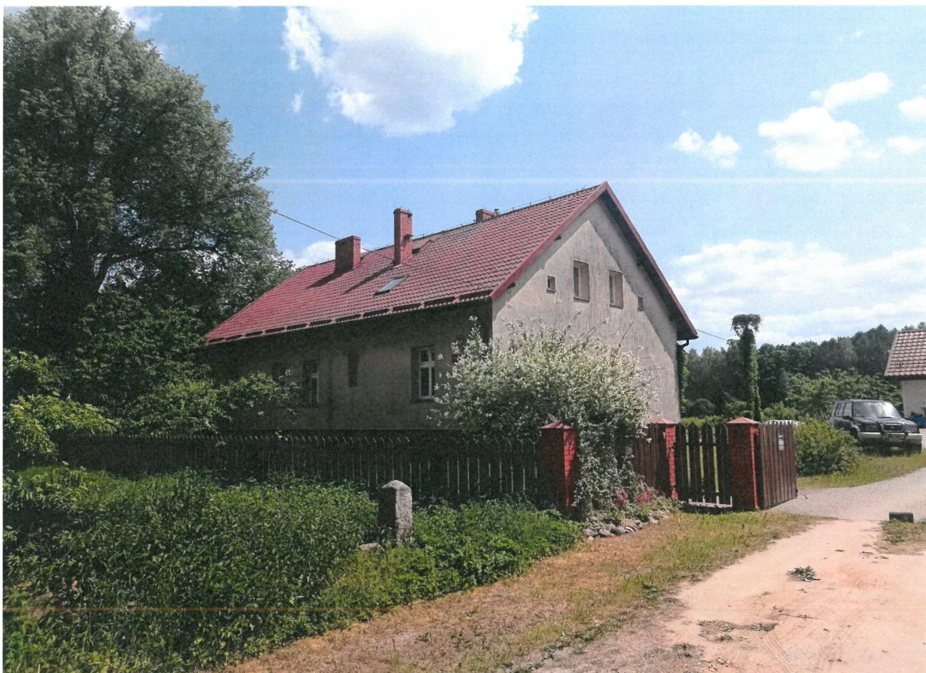
Widok ściany frontowej i szczytowej budynku (od str. półn.-zach. i półd.-zach.)