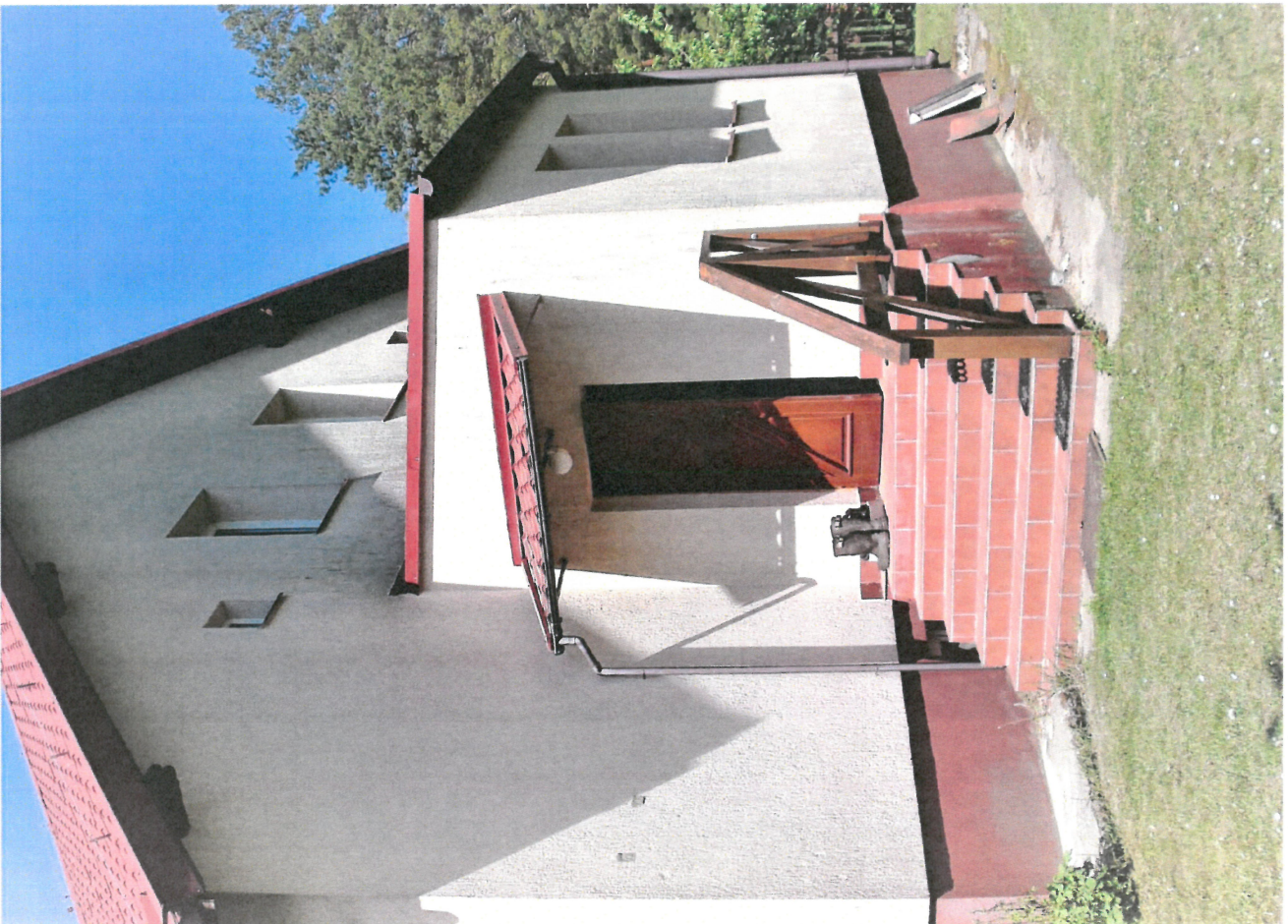
Widok śc. szczytowej z wejściem do cz. służb. bud. (od str. płd.-wsch.)