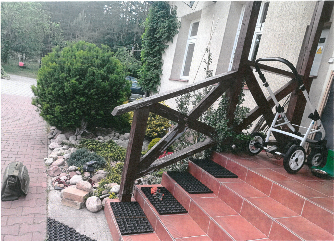
Widok drewn. balustrady i zadaszania schodów zewn. przy wejściu do cz. mieszk. budynku