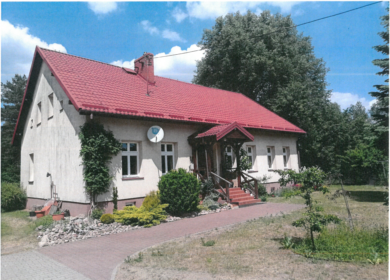
Widok ściany szczytowej i frontowej z wejściem do cz. mieszk. budynku (od str. płd.-wsch.)