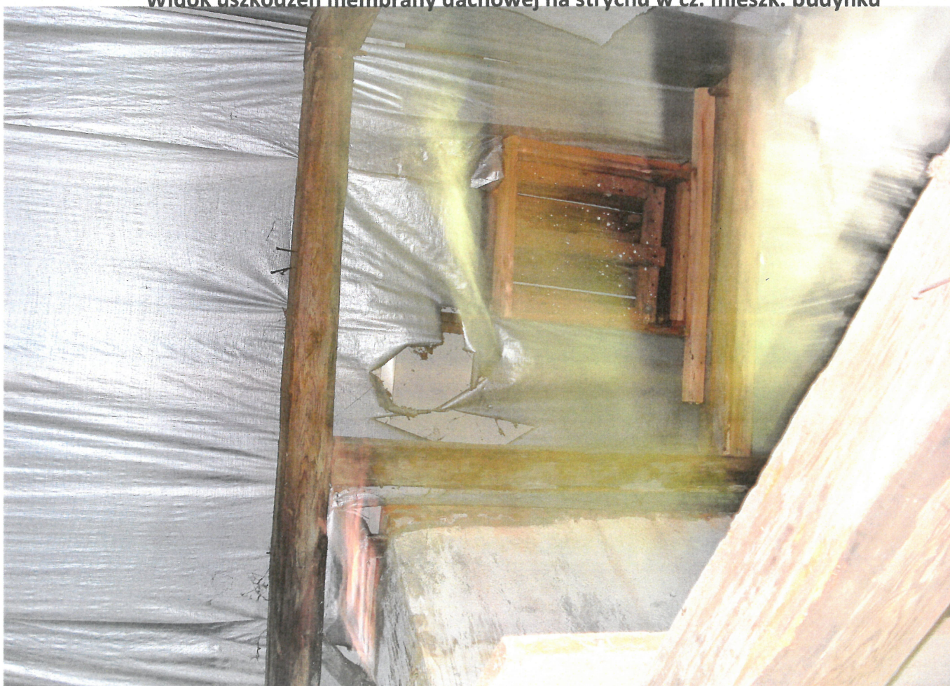
Widok uszkodzeń membrany dachowej na strychu w cz. mieszk. budynku