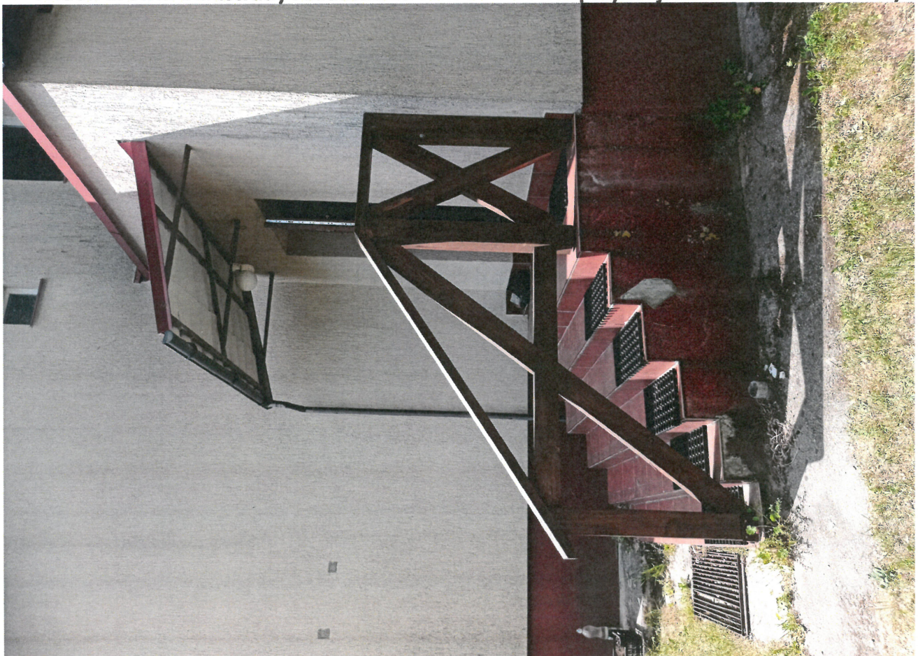
Widok schodów zewn. z wejściem do cz. służb. bud.(od str. ptd.-wsch.)