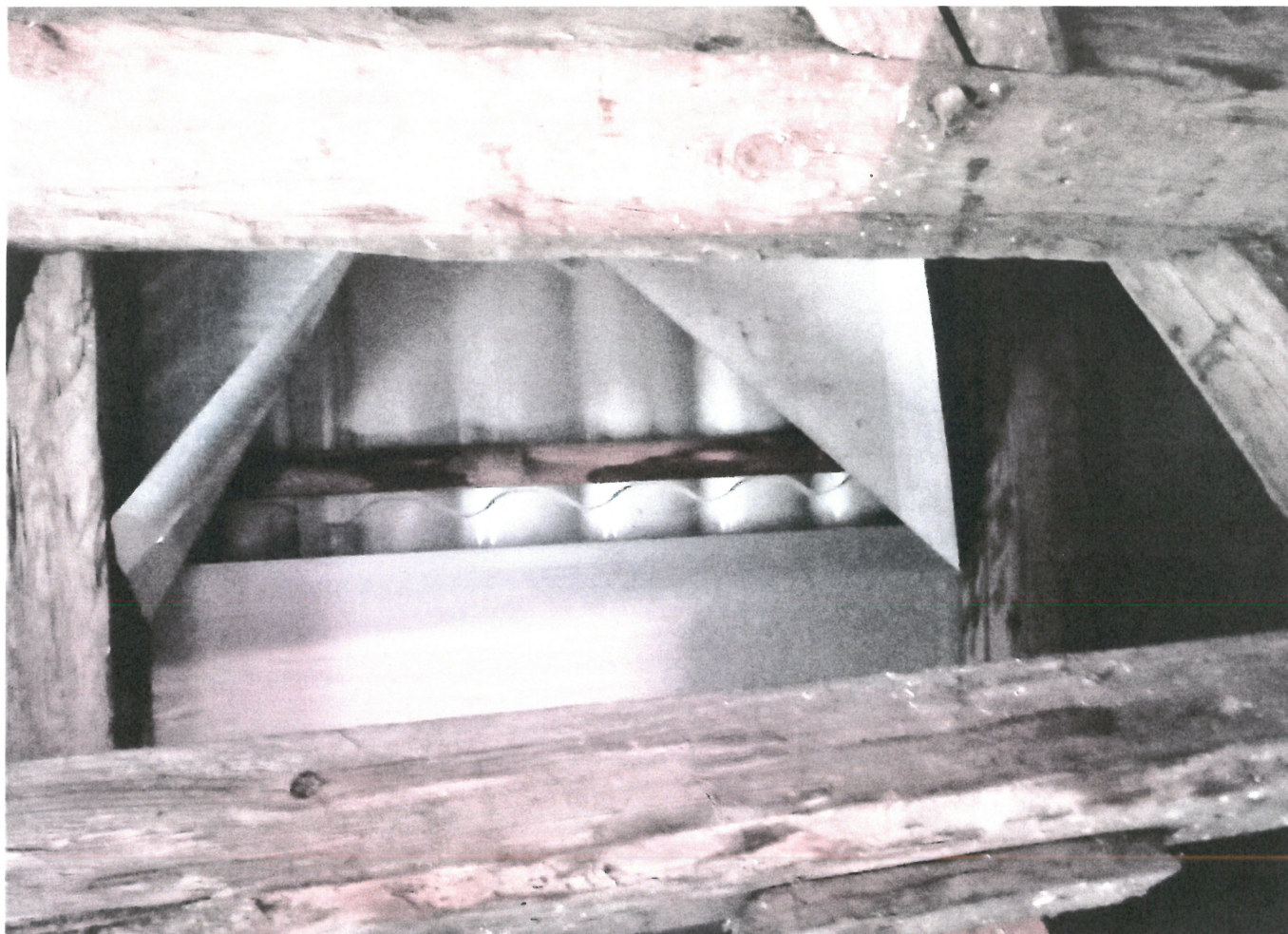
Widok uszkodzeń membrany dachowej na strychu w cz. mieszk. budynku