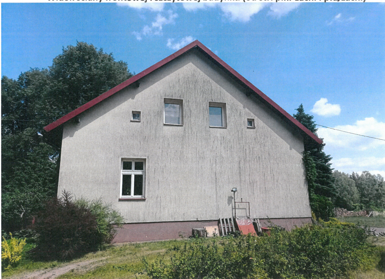
Widok ściany szczytowej (od str. półd.-zach.)