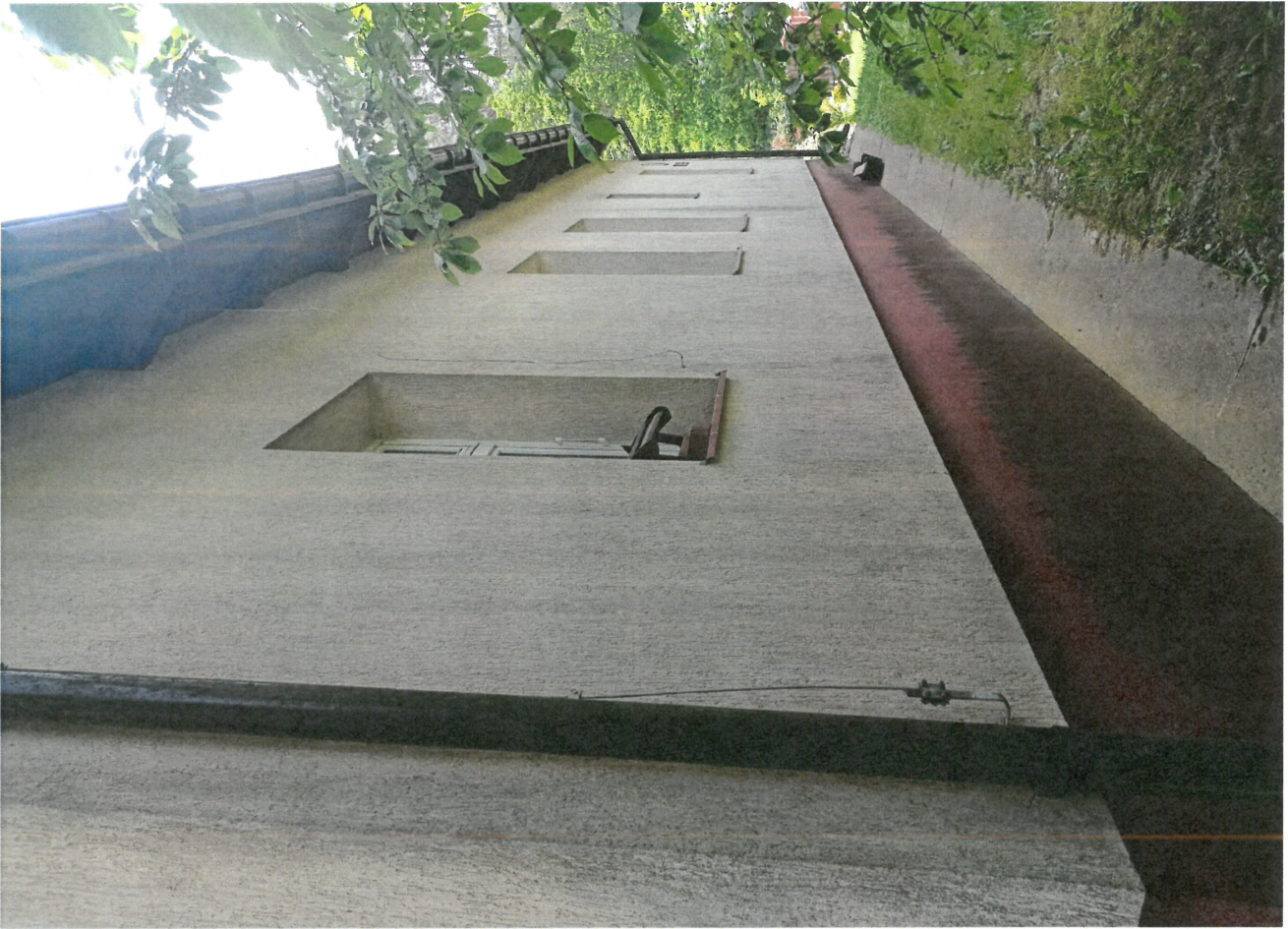
Widok śc. frontowej budynku (od str. półn.-zach.)