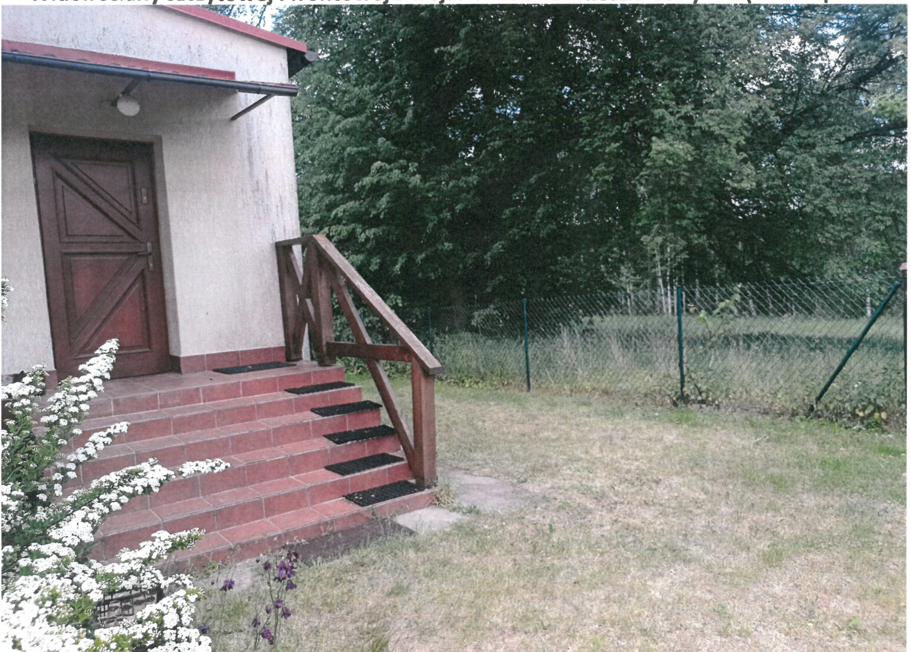
Widok schodów zewn. z wejściem do cz. służb. budynku (od str. płd.-wsch.)