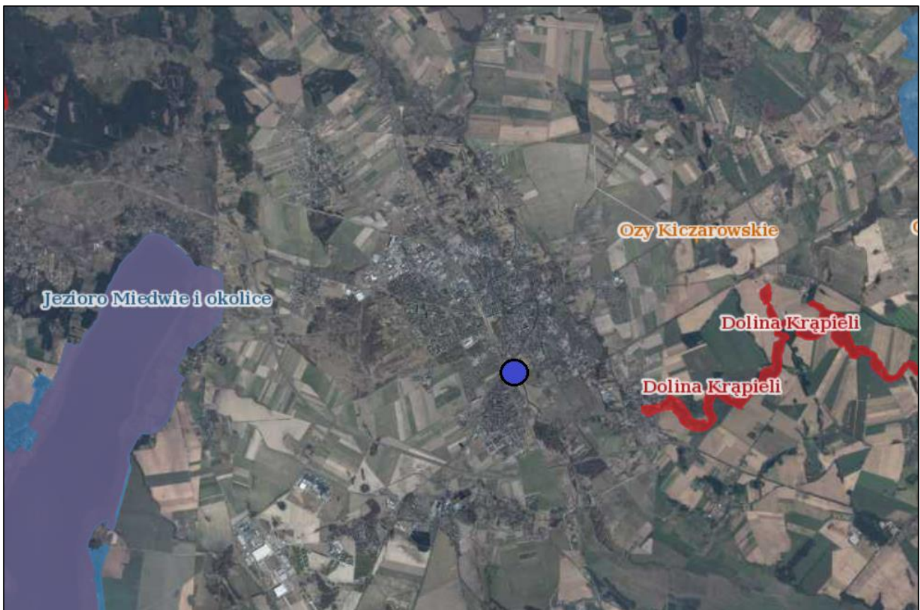
Rysunek 2. Lokalizacja studni na tle form ochrony przyrody

Na podstawie ustawy o ochronie przyrody (Dz. U. 2022 r., poz. 916 ze zm.) za tereny chronione należy uznać parki narodowe, rezerваты i parki krajobrazowe wraz z ich otulinami oraz obszary chronionego krajobrazu. Formę ochronną mogą mieć również niektóre pomniki przyrody, użytki ekologiczne, a zwłaszcza zespoły przyrodniczo-krajobrazowe. Na poniższym rysunku przedstawiono lokalizację najbliższych form ochrony przyrody.