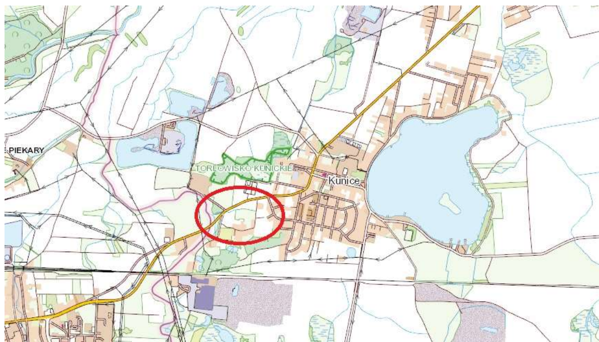
Fot. 2 – mapa poglądowa