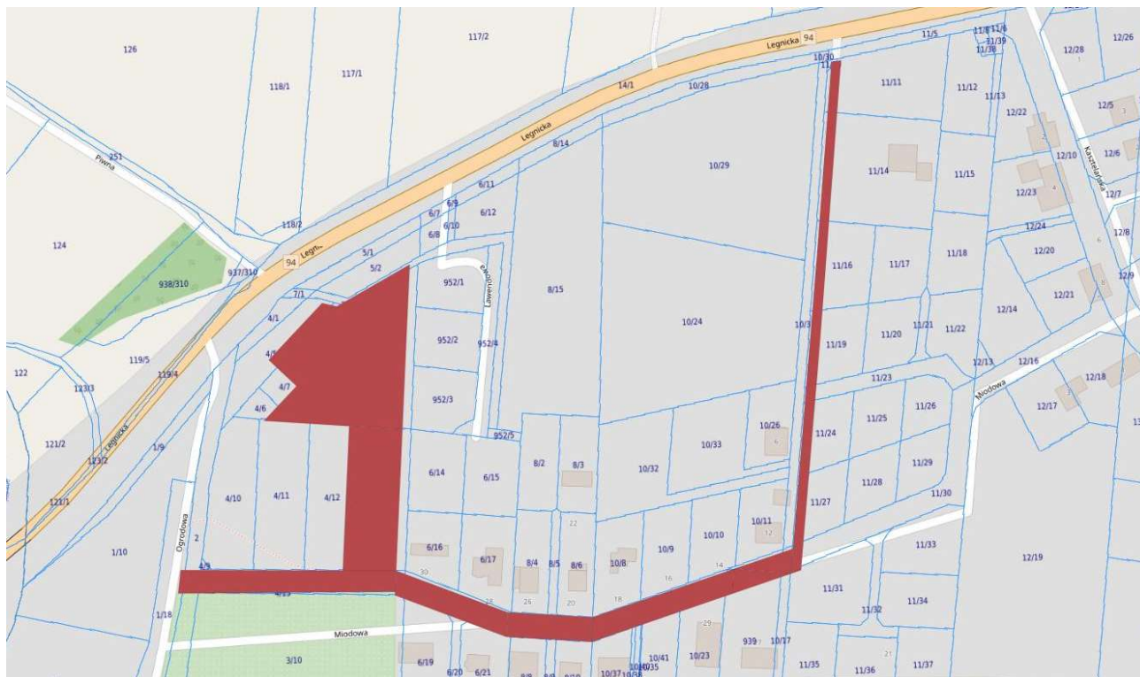
Fot. 3 – oznaczenie działek

Przedmiotem zamówienia jest zaprojektowanie oraz wykonanie robót i obejmuje: