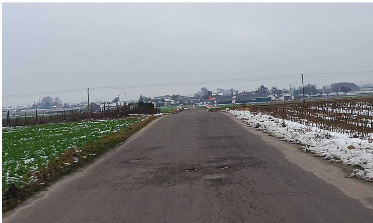
Zdjęcie nr 1 stan istniejący

Wizja lokalna została przeprowadzona w miesiącu styczniu 2023r.