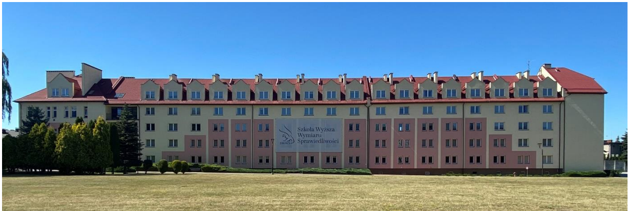
Fotografia 1. Budynek nr 23 (DS-1)