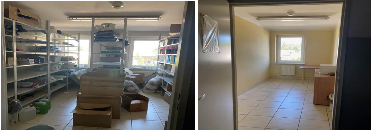
Fotografia 2. Magazyn środków czystości i pomieszczenie socjalne(DS-1)

W pomieszczeniach nr 105 oraz 115 należy wykonać prace analogiczne do przewidzianych w projekcie aranżacji wnętrz dla pokoju nr 107 z zachowaniem okładzin ściennych i podłogowych w rozmiarach dostosowanych do wymiarów pomieszczeń oraz ponadto należy m.in. zlikwidować zaplecza socjalne i wydzielić łazienki.