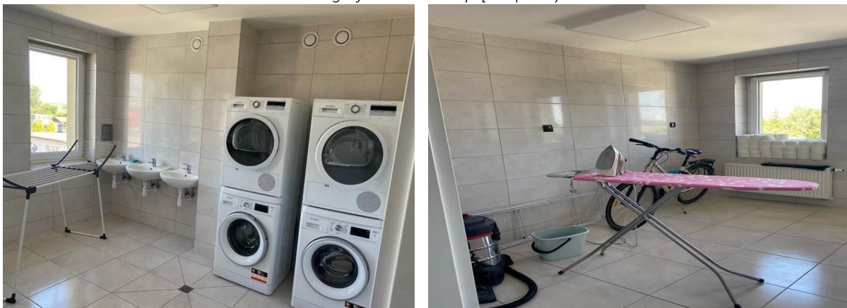
Fotografia 3. Pralnia III piętro (DS-1)

W pomieszczeniu WC należy wykonać m.in. wymianę płytek ściennych oraz podłogowych, malowanie ścian ponad płytkami oraz sufitu, wymianę grzejnika z termostatem oraz jego orurowania, wymianę parapetów, regulację okien wraz z wymianą uszczelek i klamek, wymianę opraw oświetleniowych, wymianę osprzętu sanitarnego, wymianę osprzętu elektrycznego, wymianę kratki wentylacyjnych i drzwiczek rewizyjnych oraz wymianę drzwi wewnętrznych i wejściowych.