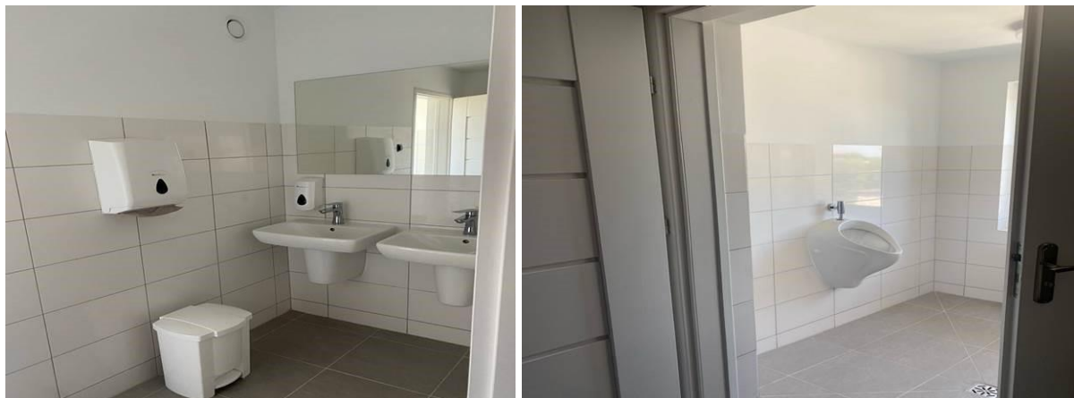
Fotografia 4. WC III piętro (DS-1)

Pomieszczenie WC ma być wykończony w sposób analogiczny jak WC na III piętrze budynku.