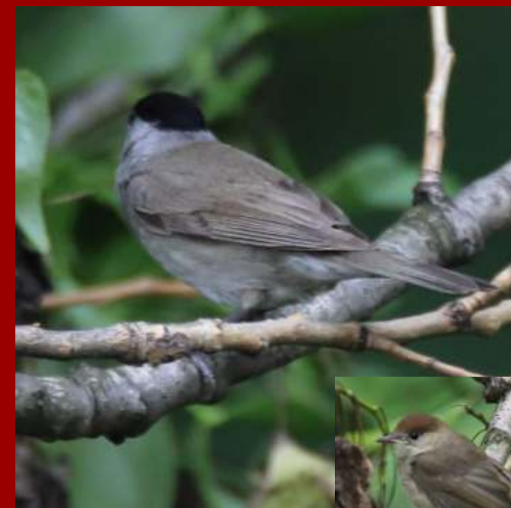
Kapturka Pokrzewka czarnobista

Gnieździ się najchętniej na północy Europy, ale zimą przylatuje do Polski. Samczyki mają czerwony brzusek. Samiczki są szare. Mają biały pasek na skrzydłach. Żywią się nasionami klonów i jesionów. Lubią owoce ligustru, derenia, jarzębiny i innych drzew i krzewów. W okresie godowym zjadają owady.