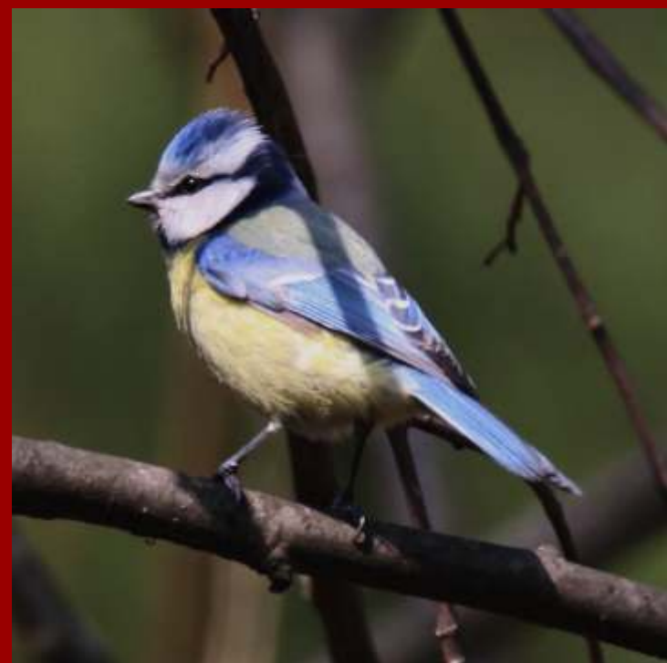
Sikora modra Modraszka

Gnieździ się w sadach, alejach i parkach, zwykle w dziuplach drzew. Ma żółty brzusek z czarnym przedziałkiem. Żywi się owadami, gąsienicami motyli, pająkami a nawet padliną. Zjada również oleiste nasion. Łączy się w pary w marcu. Młode opuszczają gniazdo po 16 dniach od wyklucia na początku maja.