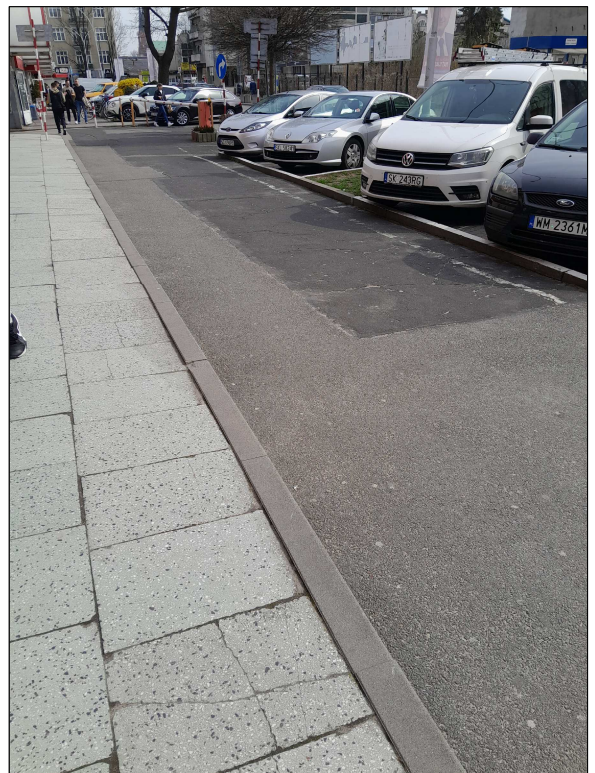
fot.4 - parking