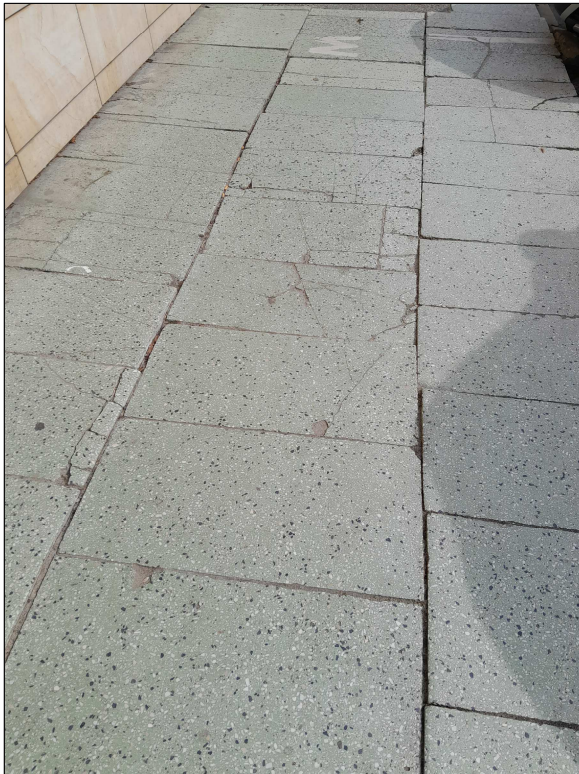
fot.1 - chodnik