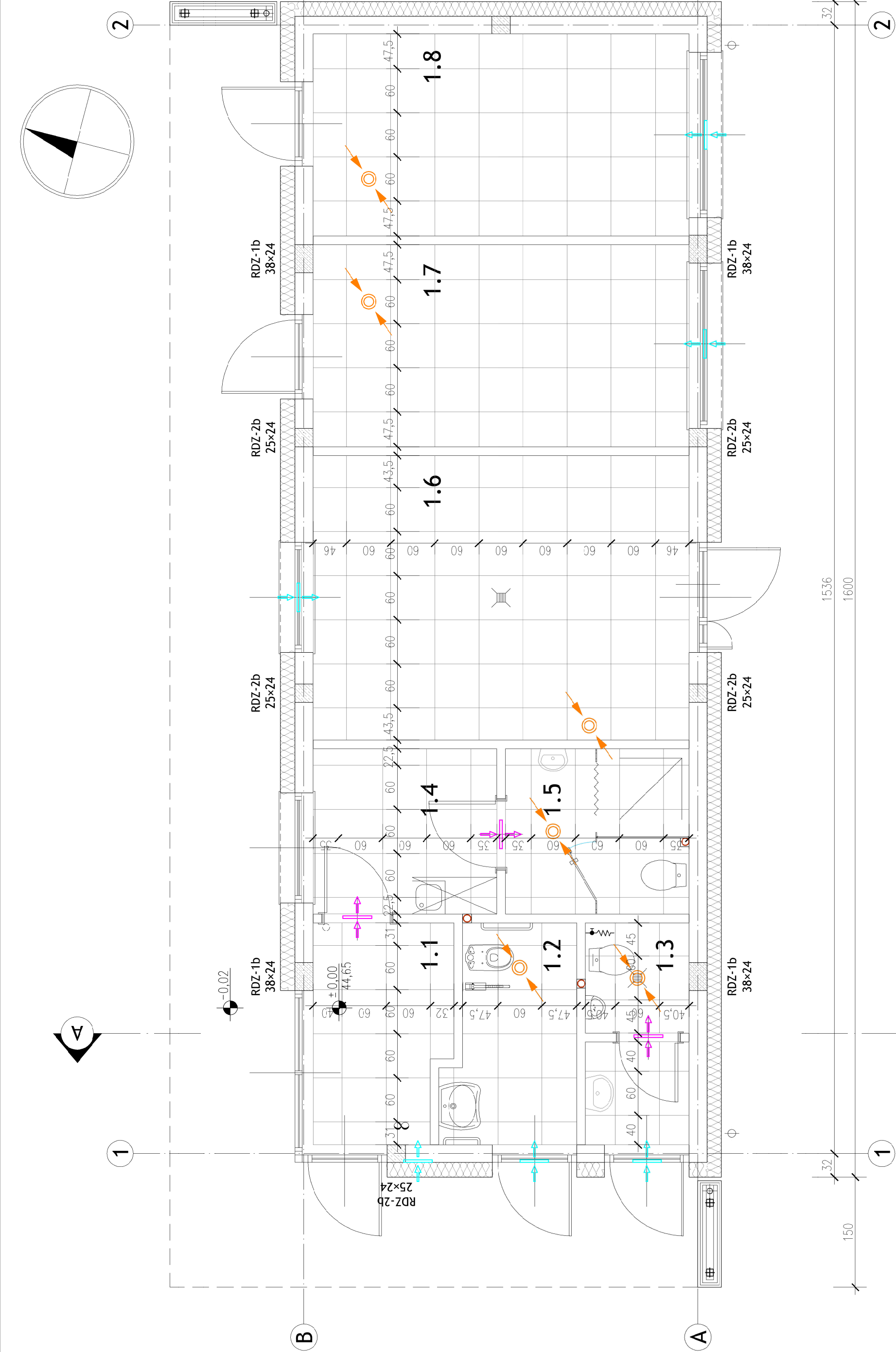
KRAWĘDŹ PŁYT SUFITOWYCH TYPU TEGULAR