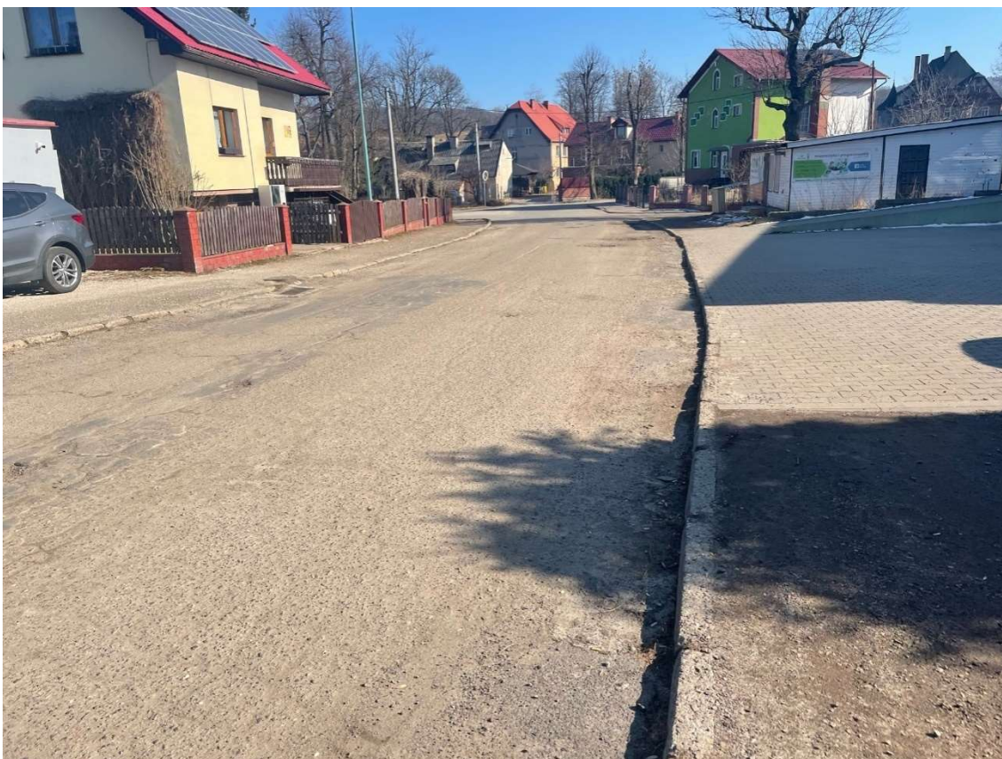
Fotografia 14 Widok na stan nawierzchni jezdni i chodnika w rejonie posesji nr 17