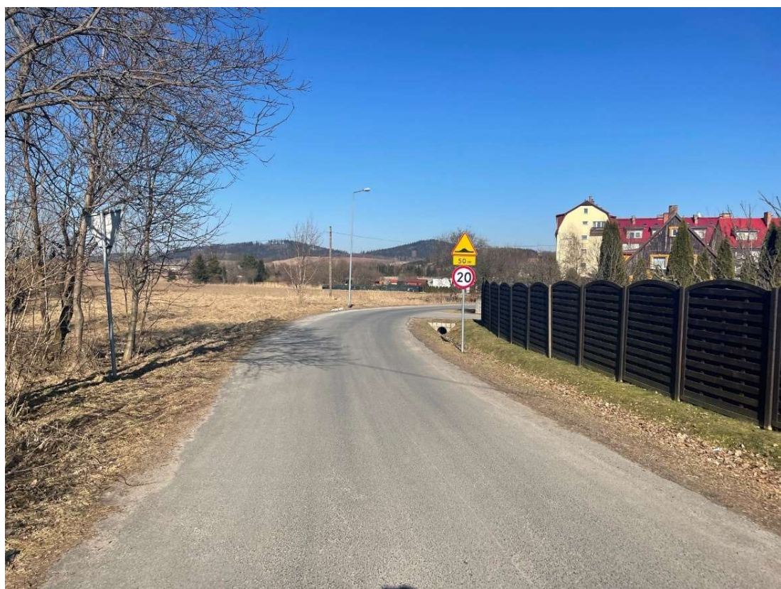
Fotografia 2 Widok na stan jezdni ul. Kolonia od strony ul. Lubawskiej