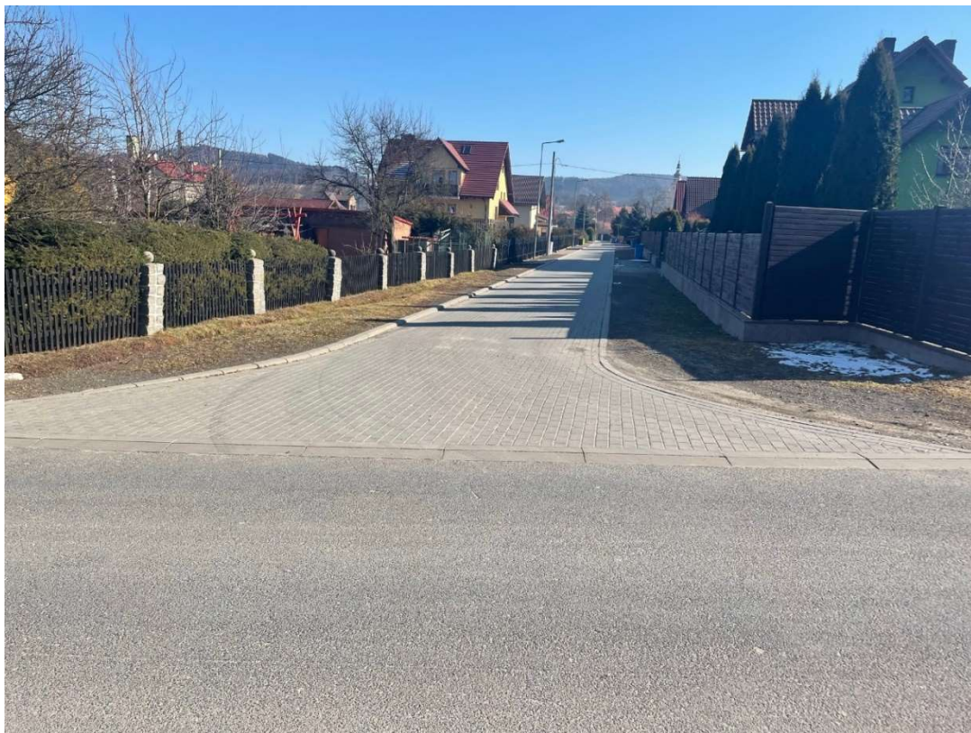
Fotografia 3 Połączenie ul. Kolonia z jezdnią na działce nr 38/67