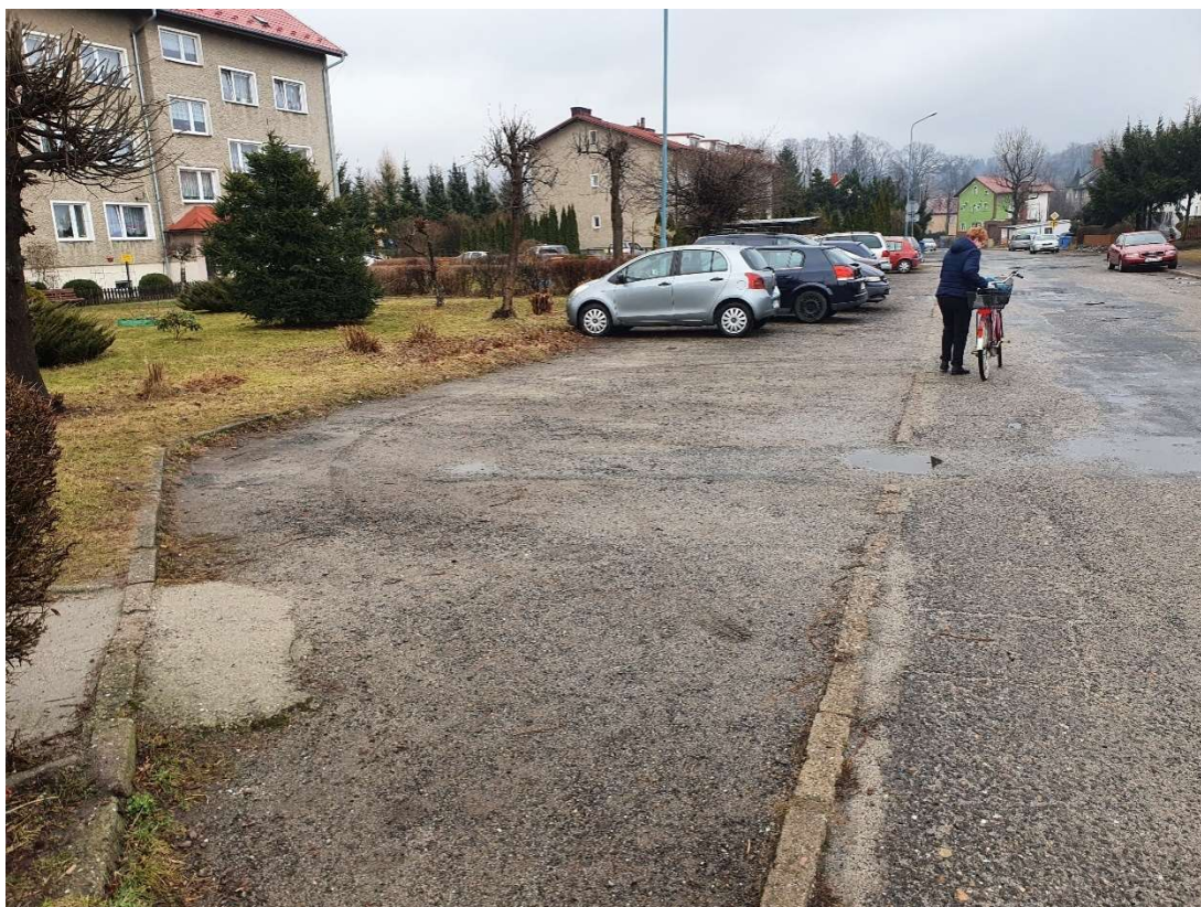
Fotografia 22 Stan nawierzchni miejsc postojowych w rejonie budynku nr 12