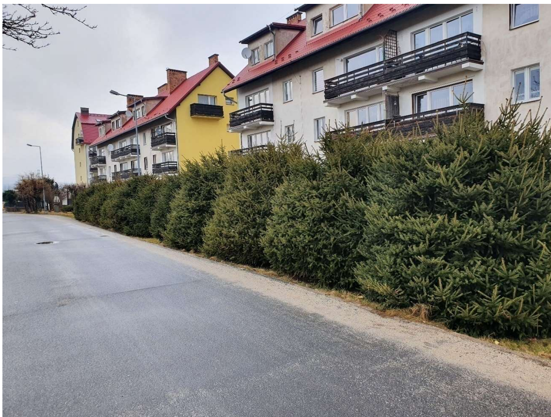
Fotografia 18 Szpaler drzew przy budynku wielorodzinnym nr 8a-8b