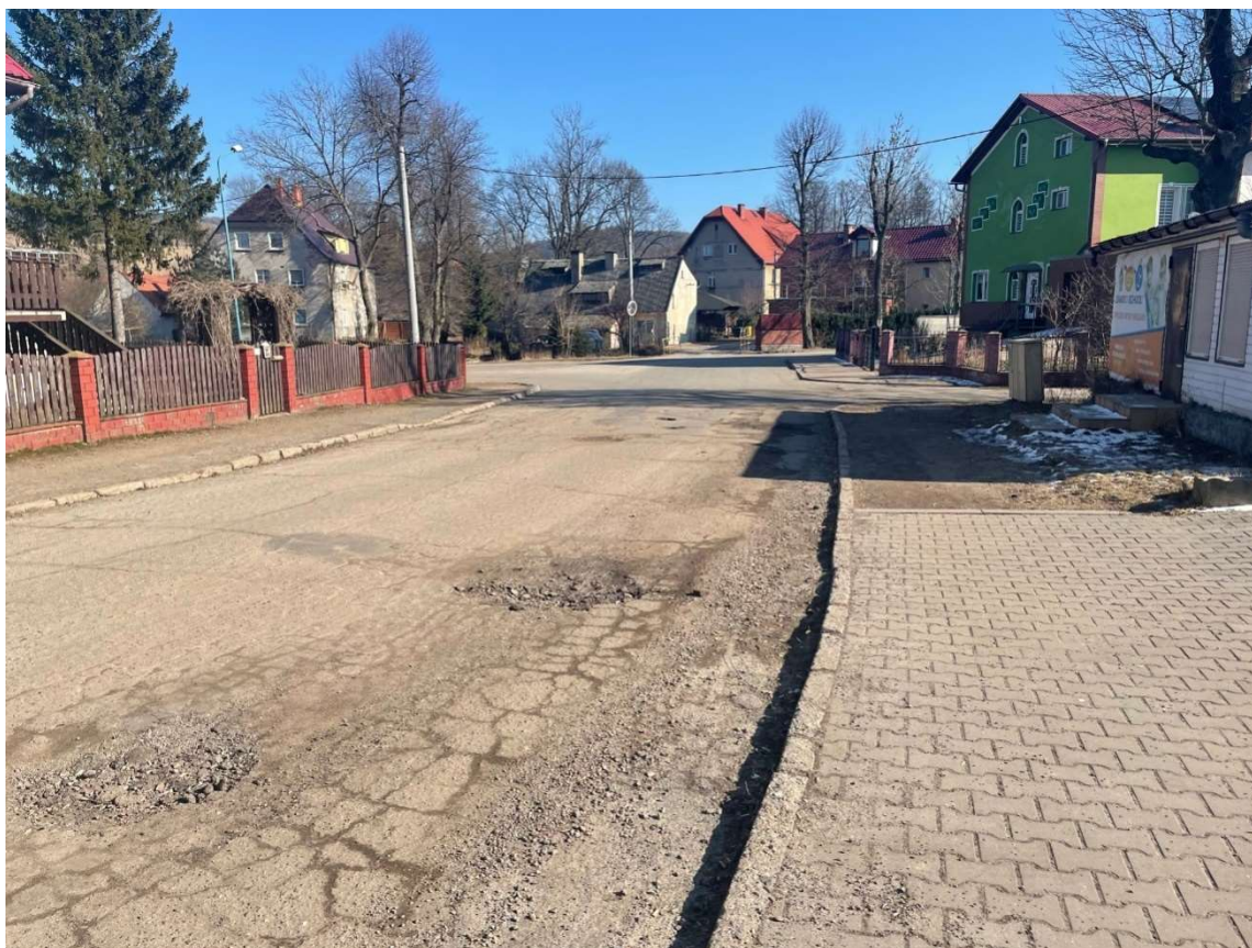
Fotografia 15 Stan nawierzchni jezdni ulicy Kolonia w rejonie posesji nr 19