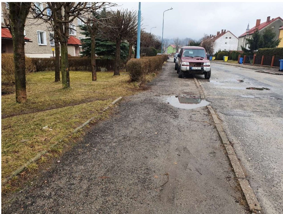
Fotografia 20 Stan nawierzchni chodników w rejonie budynku nr 10