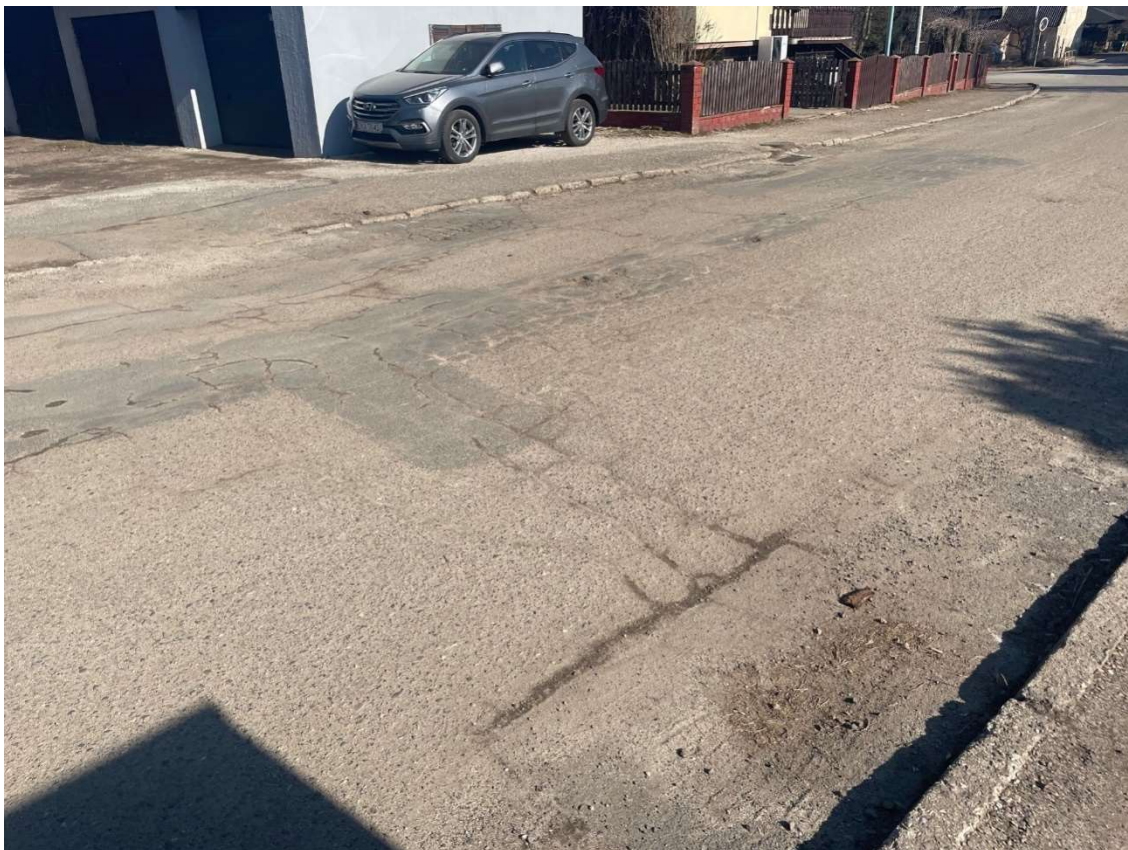
Fotografia 13 Widok na stan nawierzchni jezdni w rejonie posesji nr 17