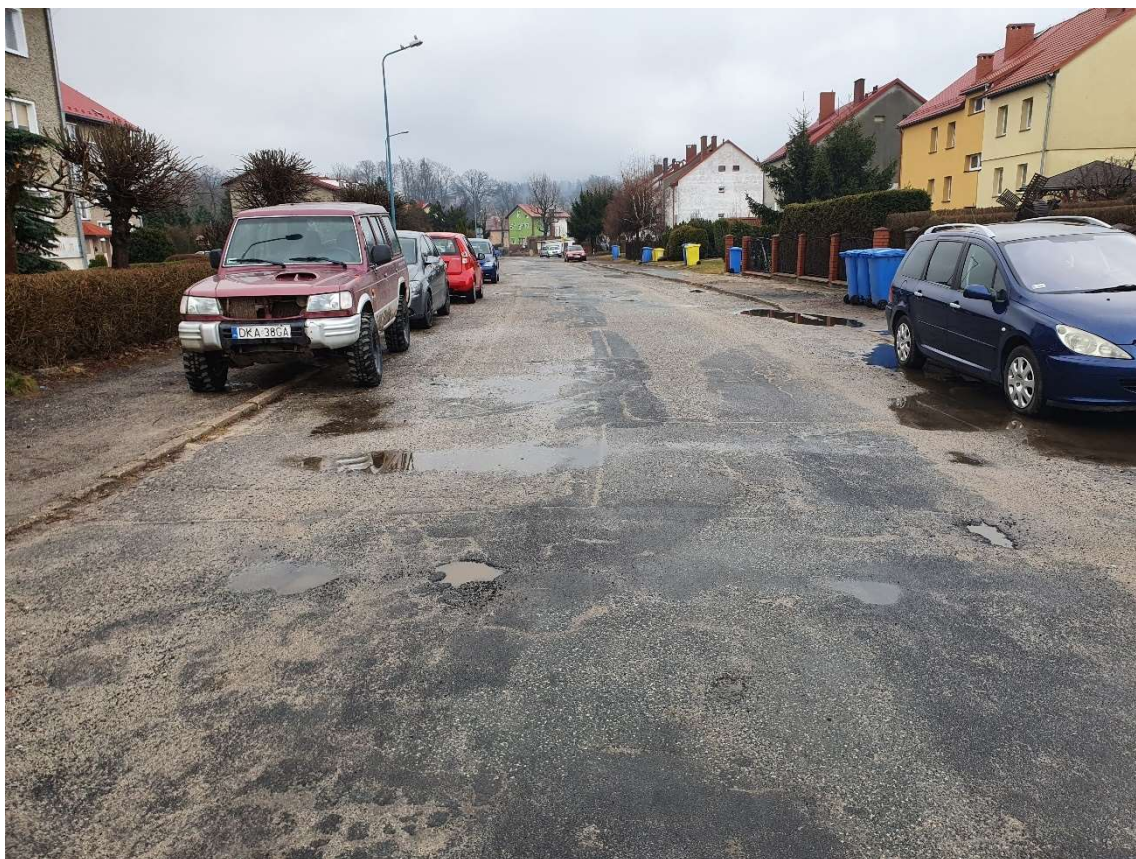
Fotografia 19 Stan nawierzchni jezdni ulicy Kolonia w rejonie budynku nr 10