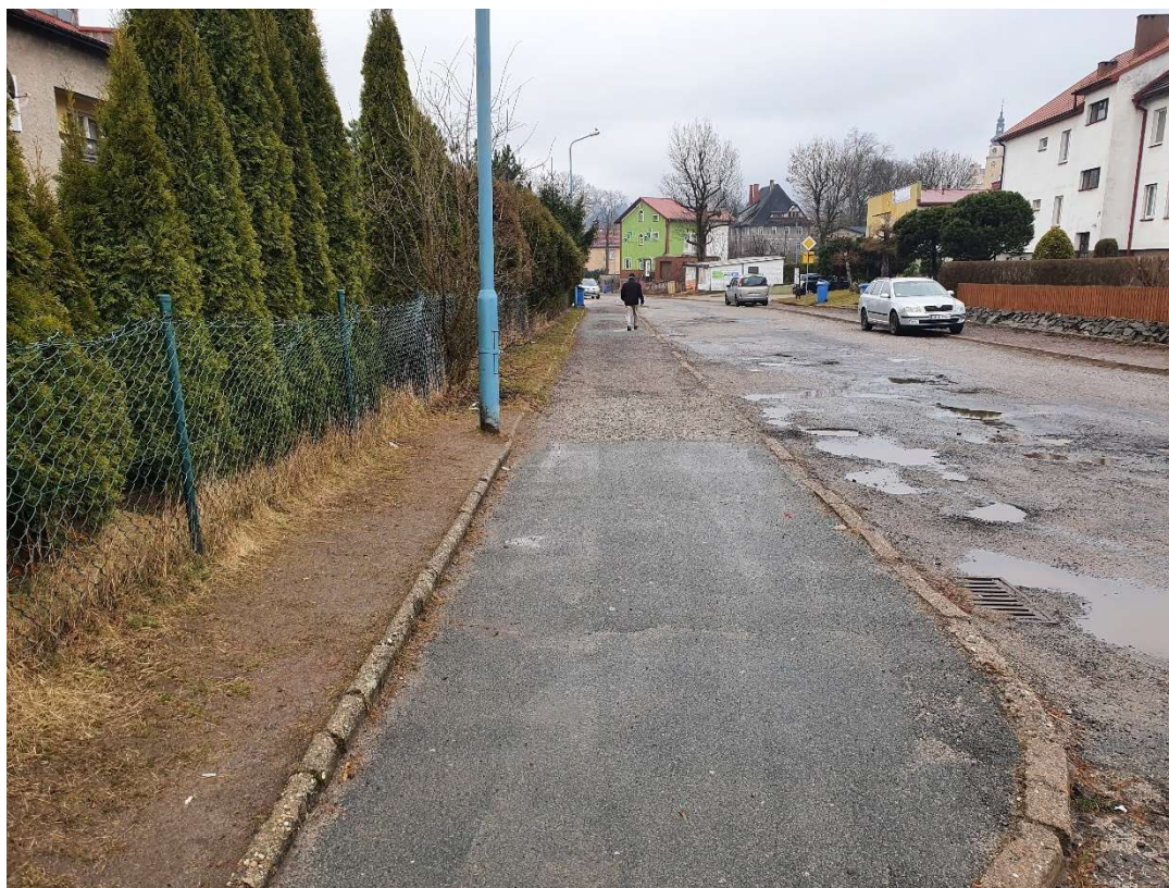
Fotografia 23 Widok na stan nawierzchni chodników przy budynku wielorodzinnym nr 16a-16b

Powyższe fotografie przedstawiają stan istniejący z dnia 11.03.2022 r.