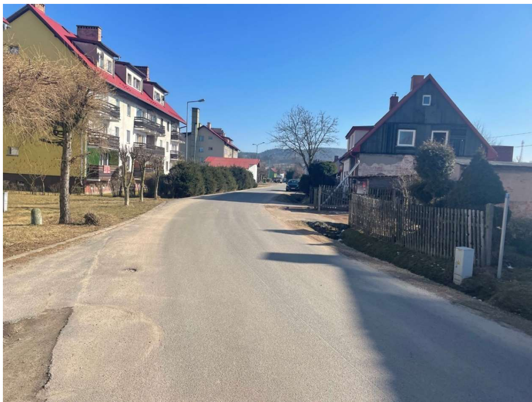
Fotografia 7 Widok na ul. Kolonia w rejonie bloku mieszkalnego 6a-6b