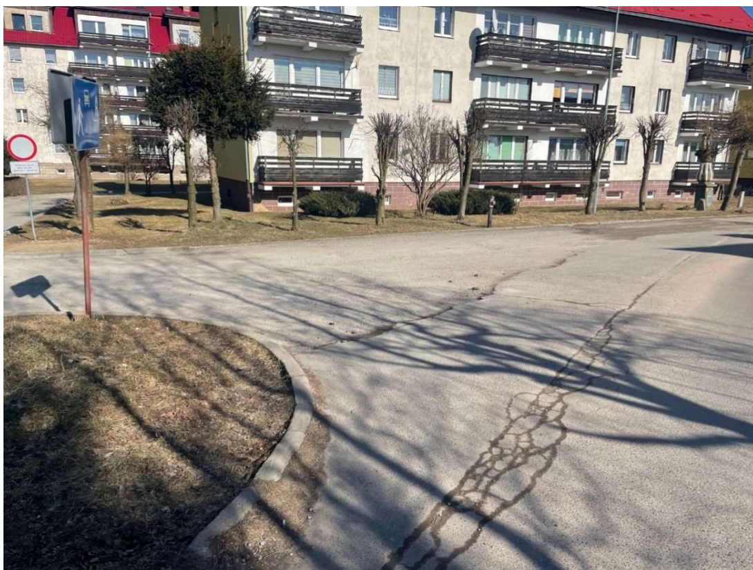
Fotografia 6 Widok na skrzyżowanie ul. Kolonia z ul. Słoneczną