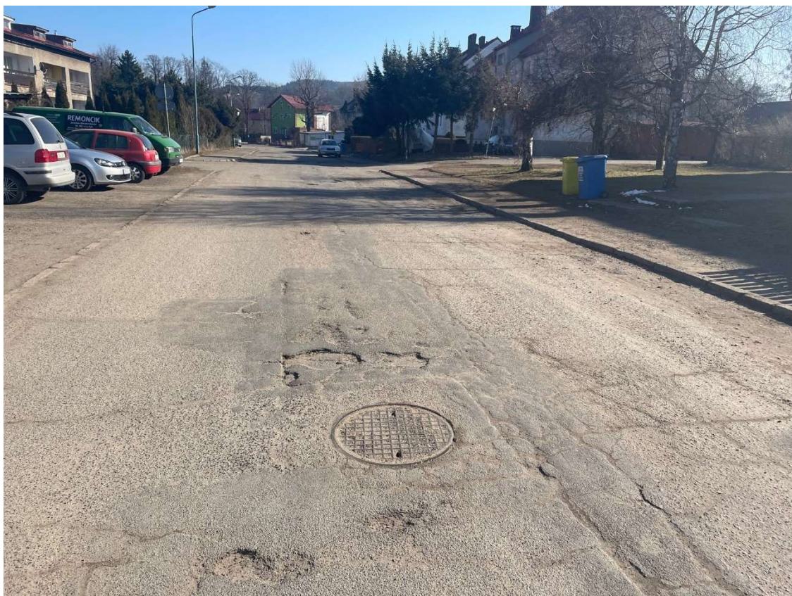
Fotografia 11 Widok na stan nawierzchni jezdni w rejonie bloku mieszkalnego nr 12