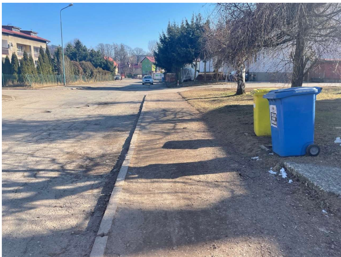
Fotografia 12 Widok na stan nawierzchni chodnika przy posesji nr 13