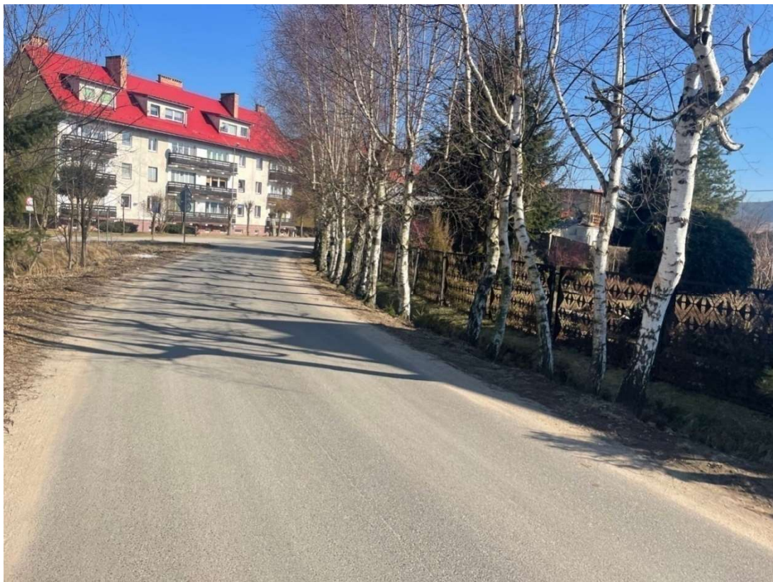
Fotografia 5 Widok na szpaler drzew za wjazdem na posesję nr 1b