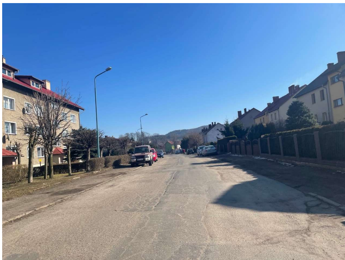
Fotografia 10 Widok na stan nawierzchni jezdni w rejonie bloku mieszkalnego nr 10