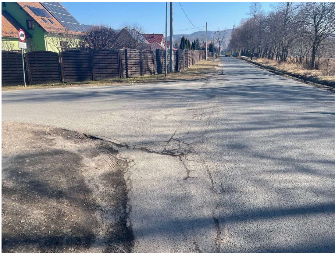
Fotografia 1 Połączenie ul. Kolonia z ul. Lubawską