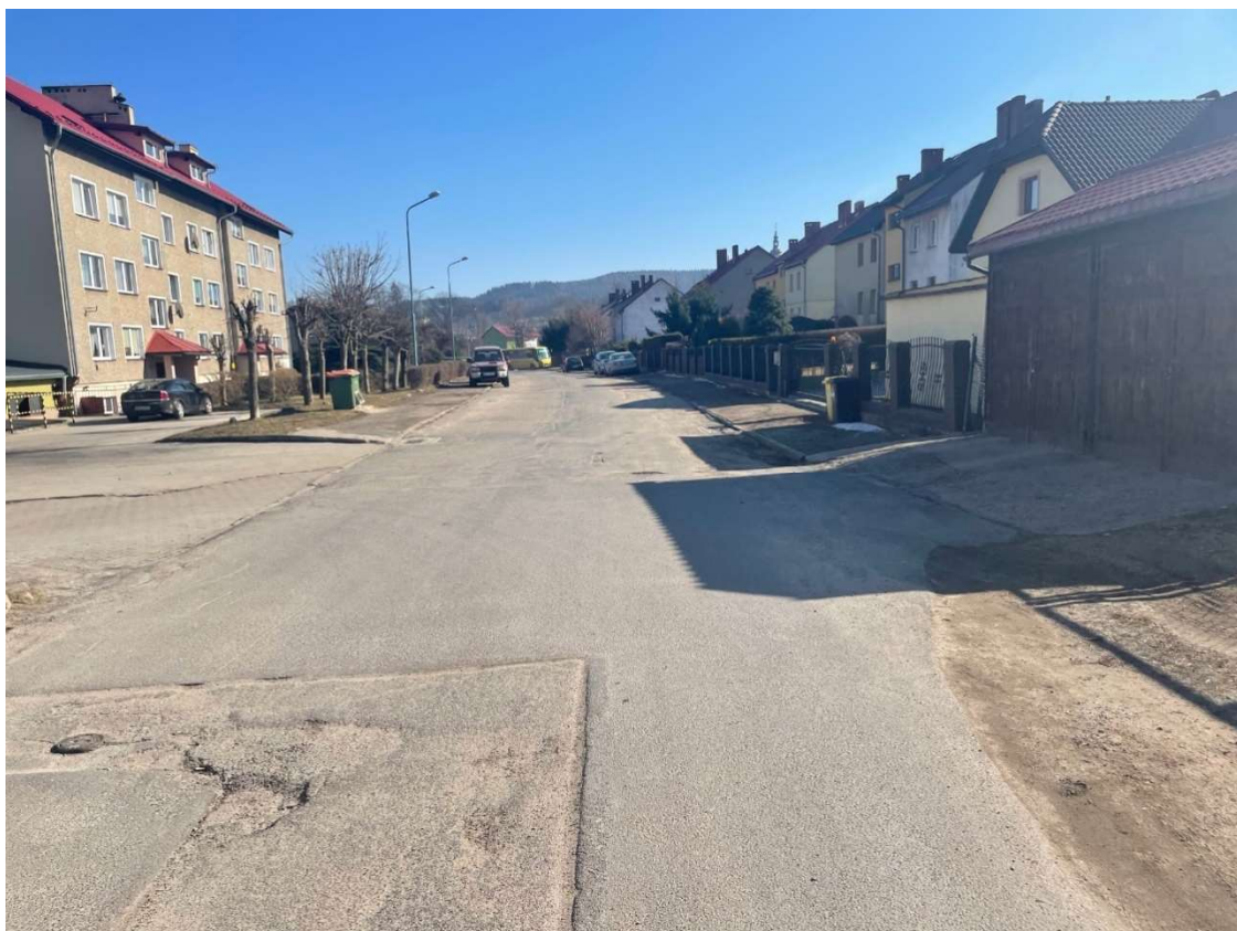
Fotografia 9 Widok na stan nawierzchni w rejonie skrzyżowania z ul. Słoneczną