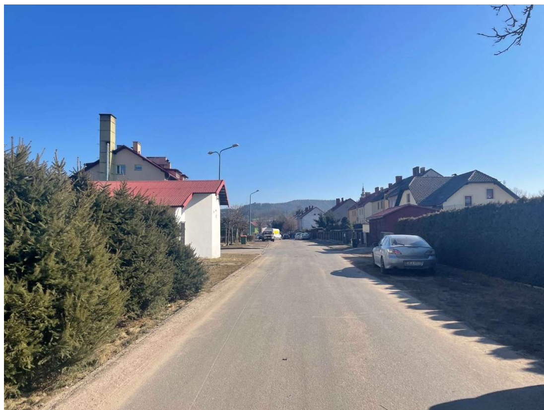
Fotografia 8 Widok na ul. Kolonia w rejonie bloku mieszkalnego nr 8a-8b