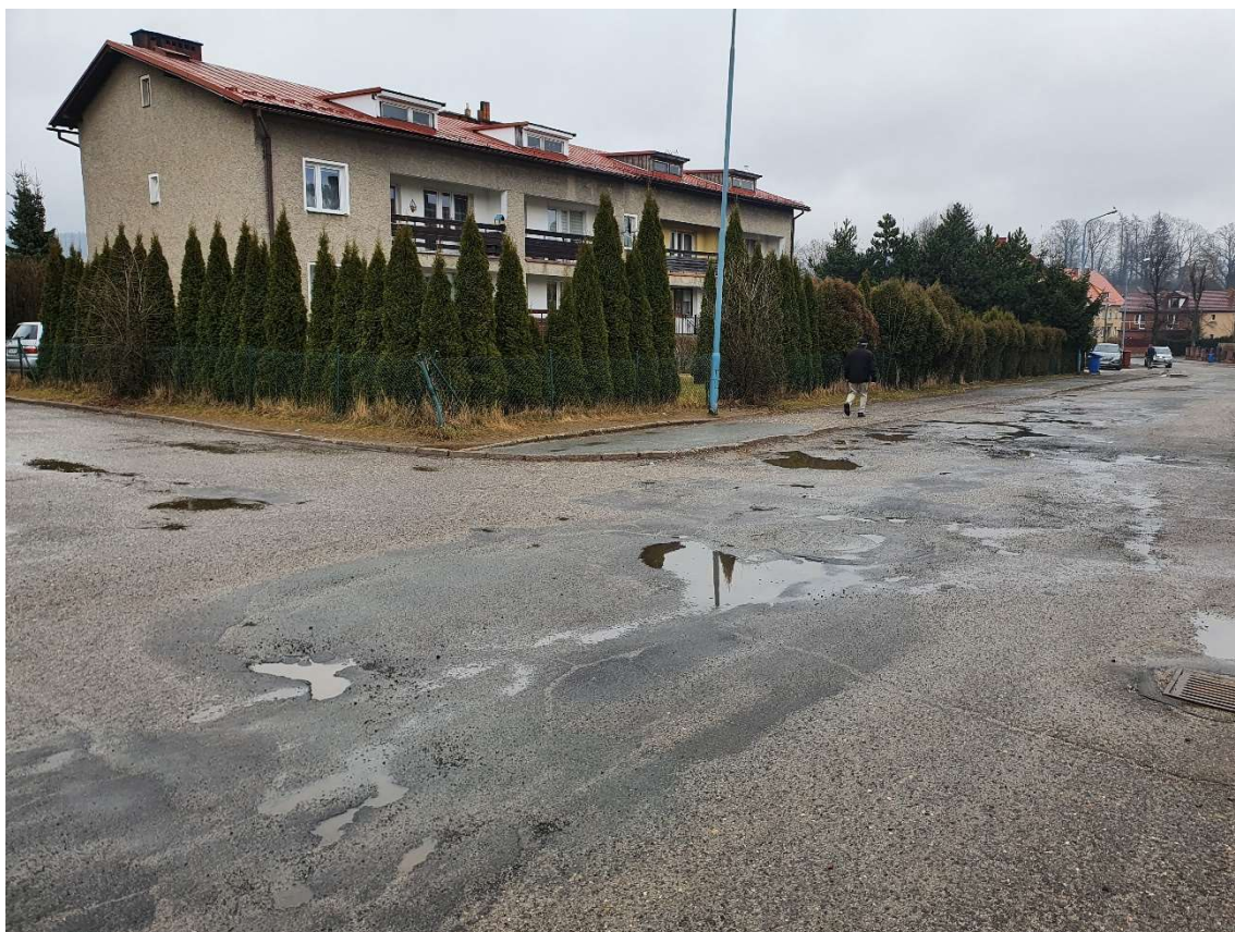
Fotografia 17 Stan nawierzchni jezdni w rejonie skrzyżowania z drogą dojazdową na posesję nr 14