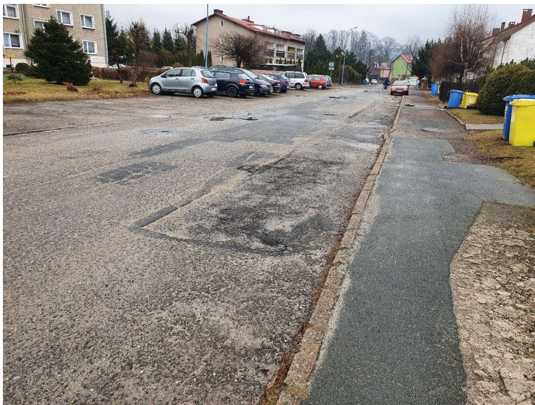
Fotografia 21 Stan nawierzchni jezdni i chodników w rejonie budynku nr 11