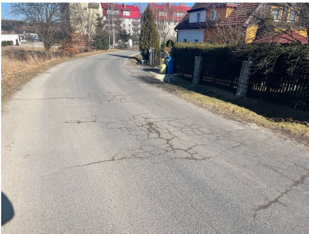
Fotografia 4 Widok na ul. Kolonia przy wjeździe na posesję nr 1a