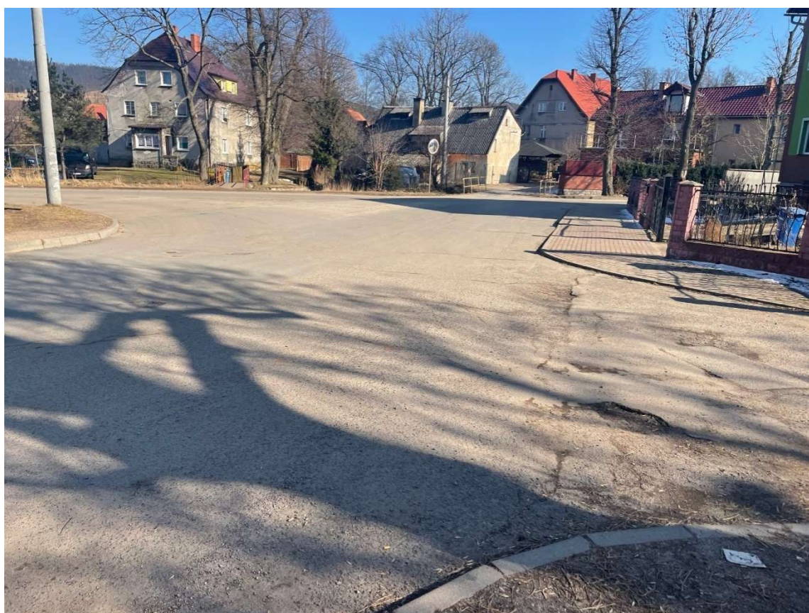
Fotografia 16 Widok na skrzyżowania ulicy Kolonia z ulicą Polną