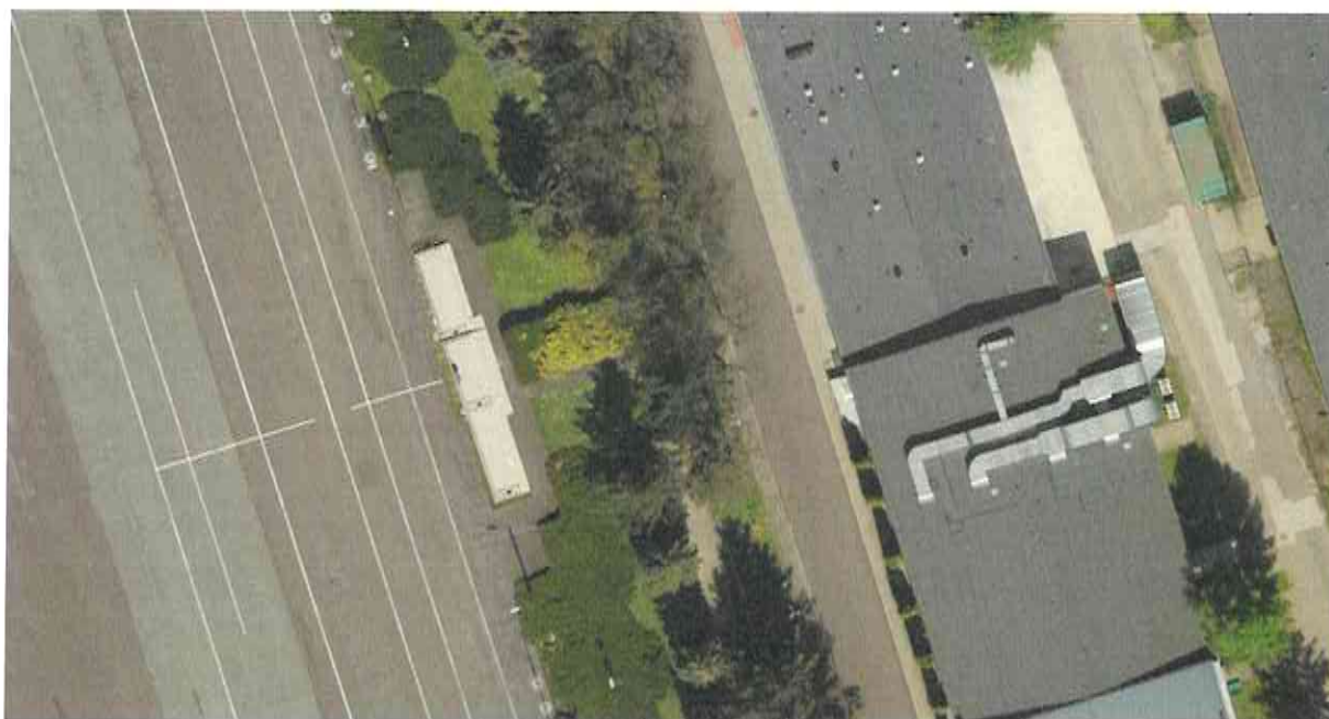
Lokalizacja trybuny względem placu oraz pasa zieleni.

całego kompleksu wojskowego, do którego prowadzą dwa zjazdy publiczne, jest ogrodzony oraz oddzielony od przyległych działek w granicach terenu zamkniętego. Na terenie działki znajdują się obiekty infrastruktury wojskowej, układ drogowy i infrastruktura techniczna na potrzeby funkcjonowania i działania Akademii Wojsk Lądowych. Istniejąca trybuna jest usytuowana po wschodniej stronie, w centralnej części długości placu apelowego. Front trybuny skierowany na zachód, od wschodu budowla jest otoczona zielenią średniej wysokości oraz drzewami. Budowlę stanowi trzystopniowy podest, o powierzchni ok 56 m 2 , wymiarach: dł.- 20,4 m, szer. – 2,0-2,7 m, wysokość centralnej części to ok. 60 cm, boczne, niższe podesty o wysokości ok 30 cm. Na krawędzi trybuny od strony placu – ażurowa, stalowa balustrada o wysokości 90 cm - metaloplastyka. Na środku trybuny – związana na stałe z podestem mównica o wys. ok. 120 cm. Konstrukcja trybuny – (prawdopodobnie) betonowa płyta na murkach fundamentowych. Wykończenie: powierzchnie poziome - płytki gresowe, antypoślizgowe, elewacja – murek otynkowany. Wejście na trybunę stanowią schody na całej długości obiektu, na każdy ze stopni. Za trybuną chodnik szerokości ok 150 cm, utwardzony, beton asfaltowy. Po obu stronach trybuny, rozmieszczone wzdłuż placu, w odległości ok 20 m, dwa stalowe słupy z głośnikami (system nagłośnienia mównicy). Wzdłuż trybuny – trawnik, zieleń płoząca (wysokości do 2m), a w dalszej odległości drzewa iglaste.