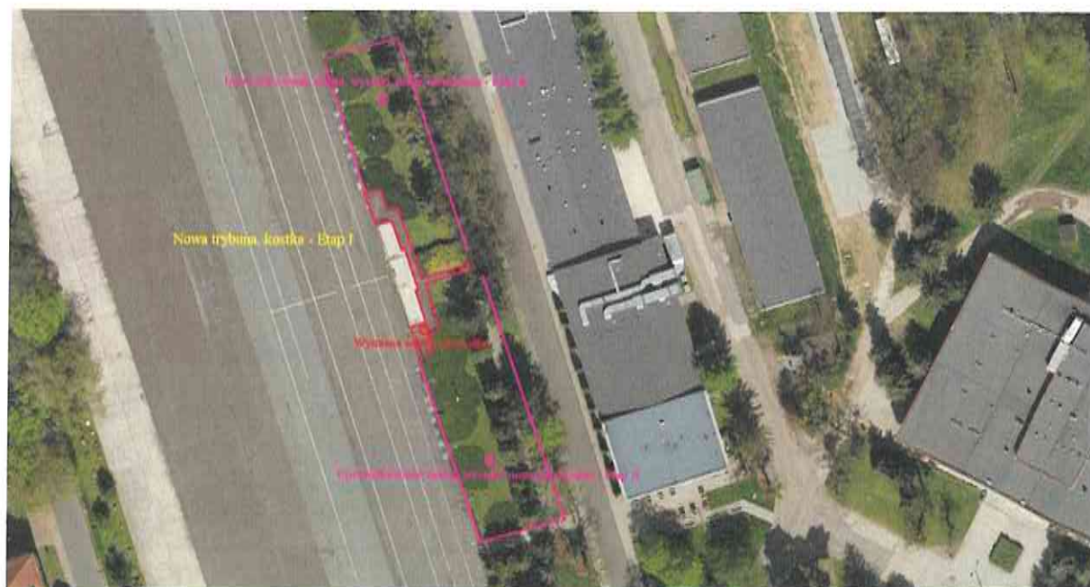
Zakres opracowania, podział prac na etapy.