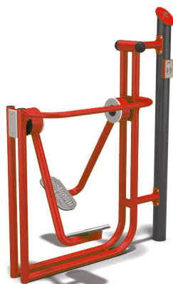
Fot. 1 Orbitrek i biegacz (przykładowe zdjęcie)