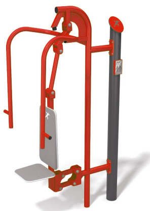
Fot. 2 Wypych/prasa nożna i wyciskanie siedząc (przykładowe zdjęcie)