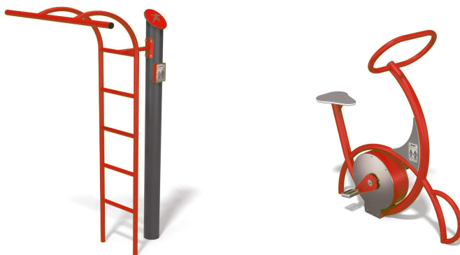
Fot. 4 Drabinka i rowerek (przykładowe zdjęcie)

Kolorystyka wszystkich urządzeń siłowni czerwono – grafitowa, nawiązująca do kolorystyki placu zabaw zlokalizowanego w pobliżu.