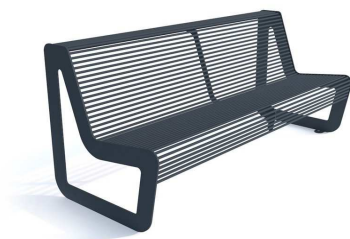
Fot. 6 Ławka z oparciem (przykładowe zdjęcie)

7. Kosz z daszkiem - kosz w całości wykonany ze stali, ocynkowany i malowany.