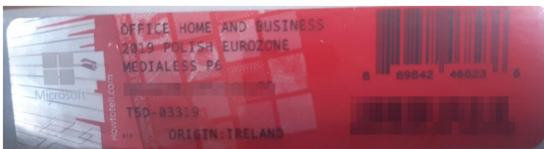
Rys. 2 przykładowy kod zabezpieczony przez producenta systemu Microsoft Windows Office Home&Business z wymazanym, znajdującym się w prawym dolnym rogu numerem seryjnym produktu. Kod licencyjny znajduje się w środku szczelnie zapakowanego i zafoliowanego pudełka (Rys. 3)