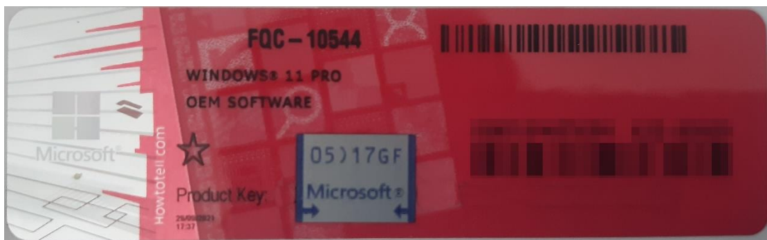
Rys. 1 przykładowy kod zabezpieczony przez producenta systemu Microsoft Windows 11 (takie same naklejki mają Windows 10) z wymazanym, znajdującym się przed i za szarą naklejką kodem licencyjnym