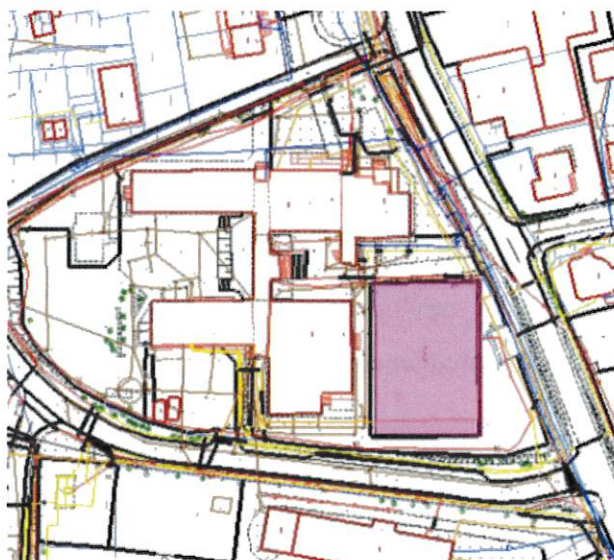
Fot. 1 Lokalizacja inwestycji