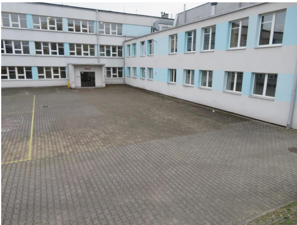
zdj. 2 Widok na plac szkolny – wejście do budynku szkoły

masy termoplastycznej, należy upewnić się, że w okresie kilku dni przed montażem, nie występowały opady deszczu i nawierzchnia jest całkowicie sucha.