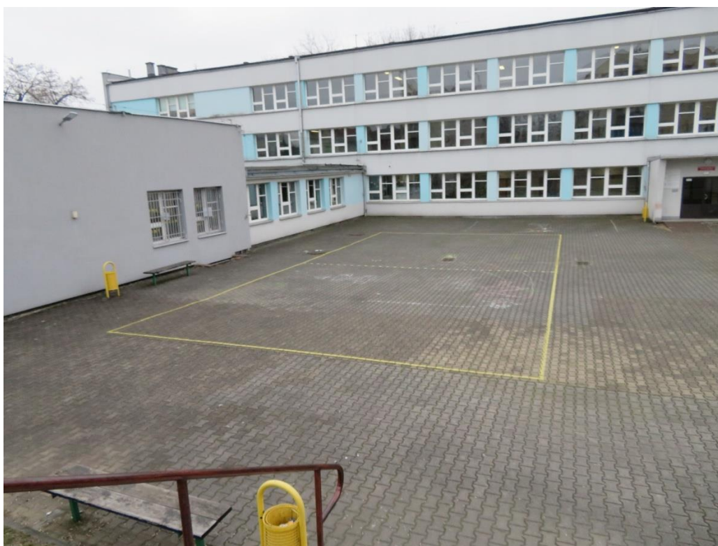
zdj. 3 Widok na plac szkolny – istniejące boisko do gier zespołowych