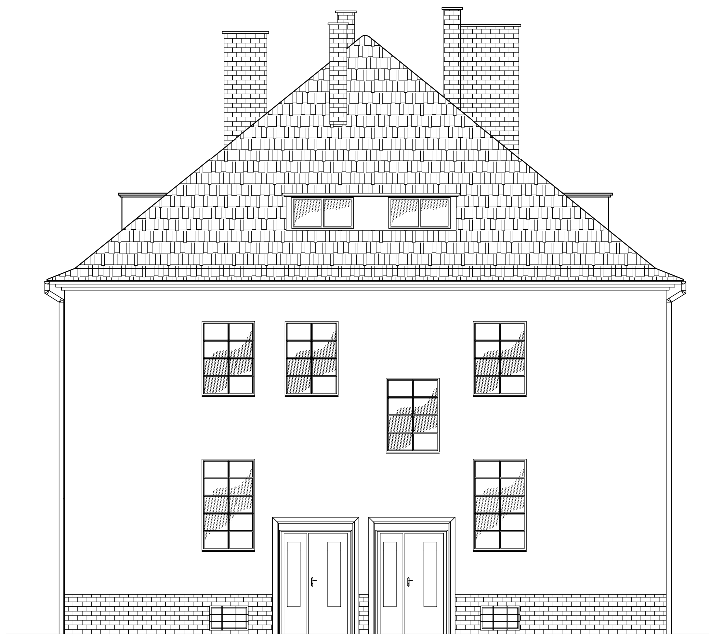
Elewacja boczna (północno- zachodnia)