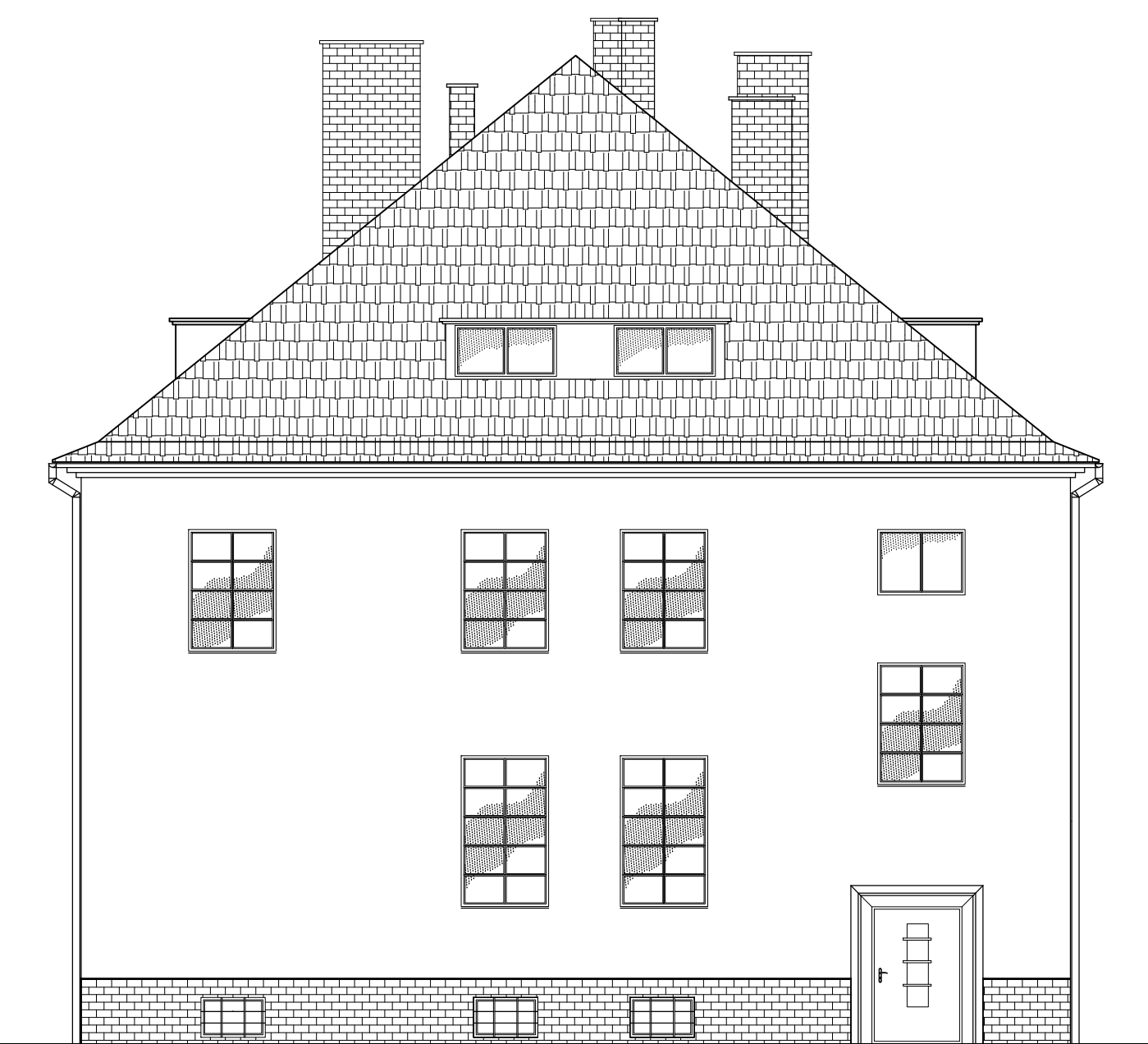
Elewacja boczna (południowo- wschodnia)