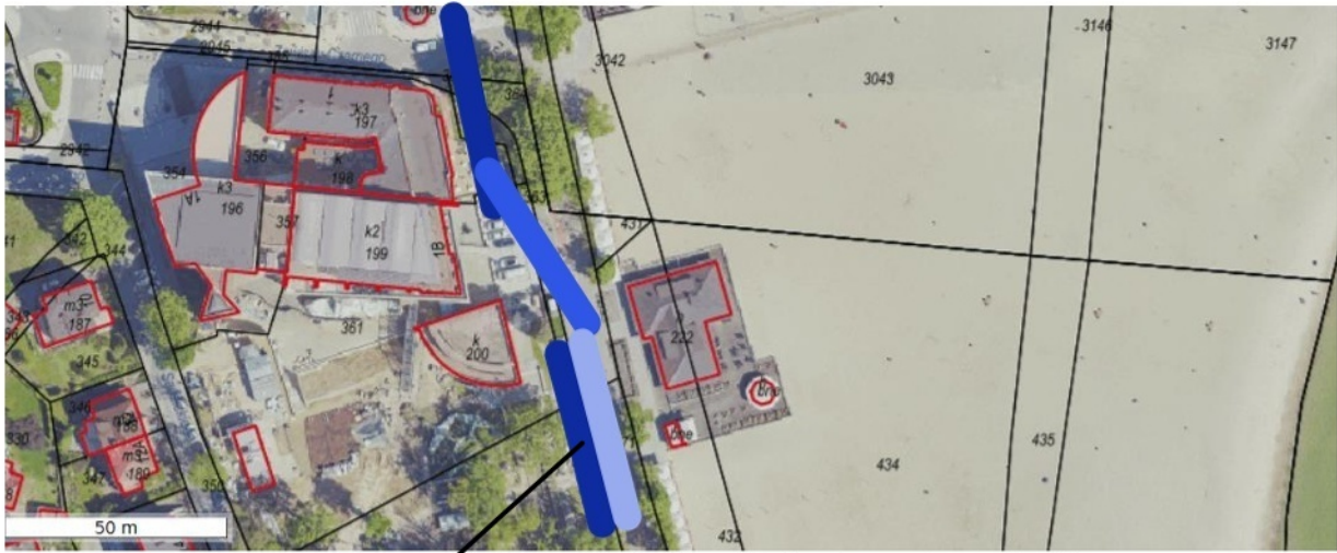
miejsce lokalizacji okrętu na terenie Muzeum