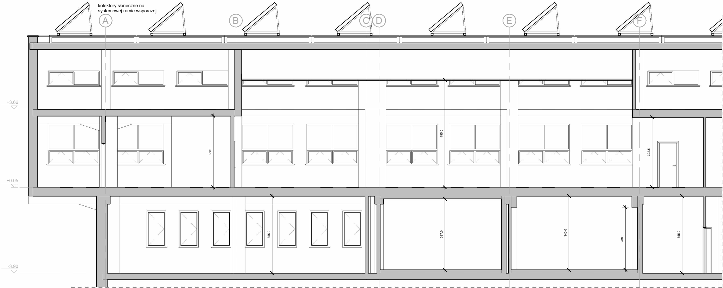
1 Przekrój A-A 1 : 100