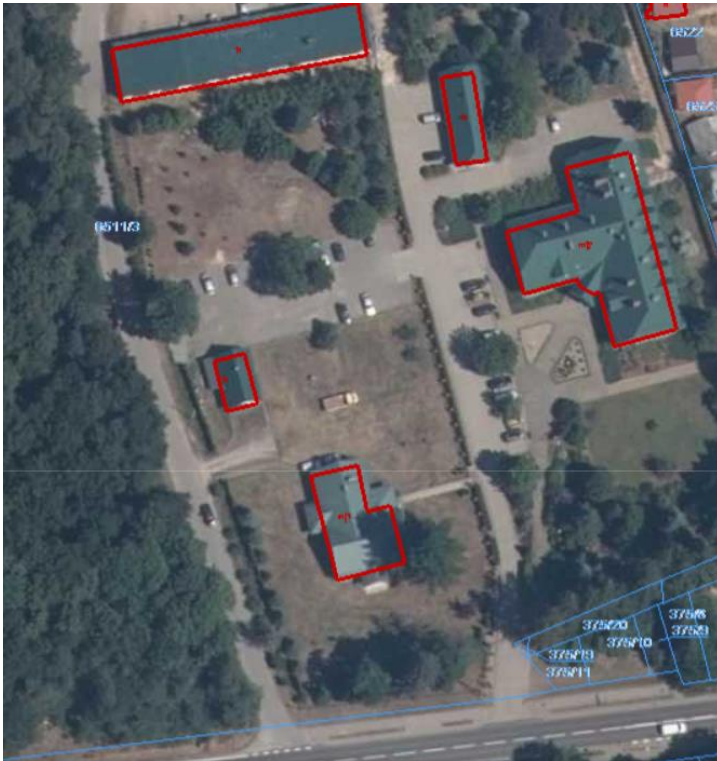
Rysunek nr 2. Lokalizacja farmy fotowoltaicznej na dachu budynków i gruncie