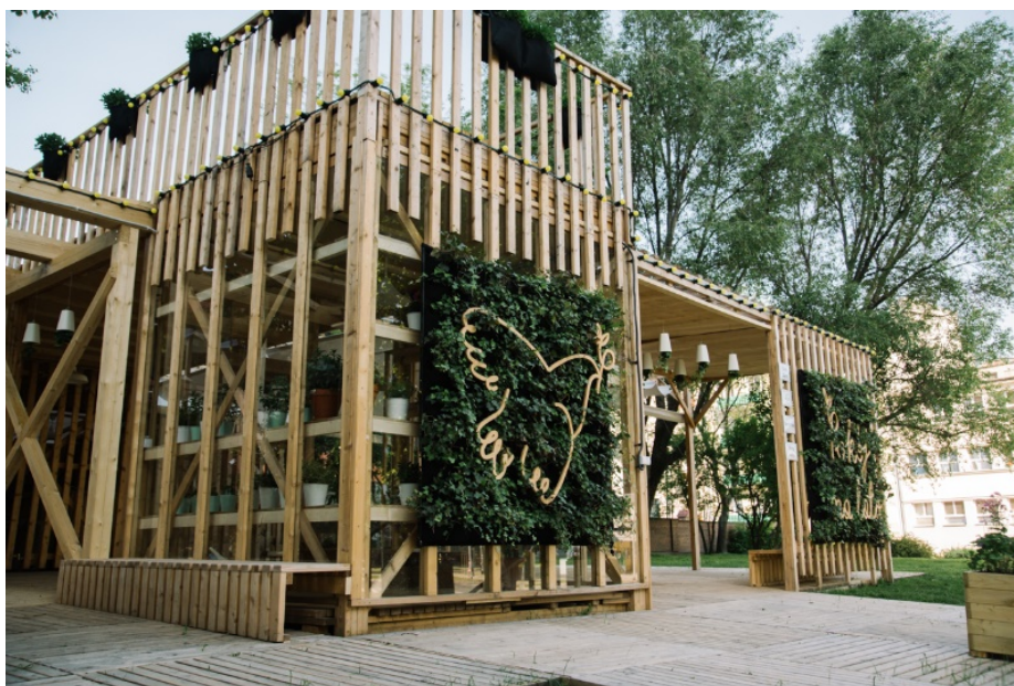
Widok na pawilon „Pensjonat roślinka” oraz na altanę wejściową.

Strukturę pawilonu zaprojektowano z profili drewnianych. Główny profil 40x80mm ze świerkowej tarcicy skandynawskiej uzupełniony profilami konstrukcyjnymi 140x140mm w konstrukcjach nieobciążonych użytkowo (altany z lekkim przykryciem) oraz profil 200x200mm w konstrukcji tarasu i mostka (profil zwielokrotniany w razie konieczności).