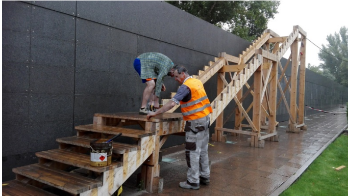
Demontaż schodów przy Murze Pamięci we wrześniu 2017r.

Elementy zdemontowane w latach ubiegłych składowane były w celu ponownego użycia w roku 2022, natomiast wskazane do wymiany w czasie rozbiórki w roku 2019, zostaną zamienione na identyczne, zgodnie z projektem i zdemontowane ponownie we wrześniu 2020 w celu ponownego użycia w latach kolejnych.