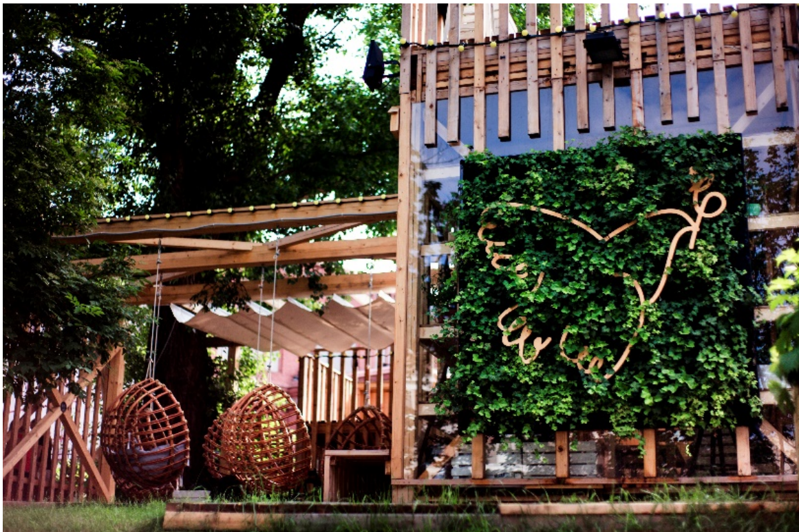
Widok na pawilon „Pensjonat roślinka” oraz na ramę z siedziskami.

Cały obiekt wykonany jest z gotowych elementów drewnianych. Podstawowym elementem konstrukcyjnym jest kantówka drewniana o przekroju 4cm x 8cm i to ona tworzy rytm rysunku architektury. Z niej wykonane są w większości słupy, elementy przegród pionowych oraz poziomych, pergol, elewacji, balustrad, poręczy, ławek, stopni i spoczników schodów i zadaszeń. Posadzka całości na poziomie parteru wyłożona jest drewnianymi pokładami zrobionymi również z ww. kantówki.