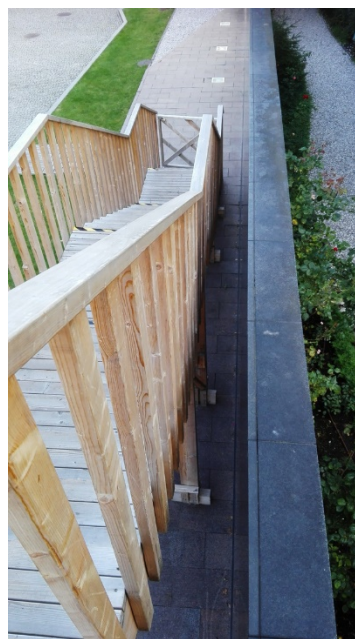
Widok na schody z poziomego pomostu.