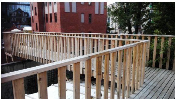
Pomost łączący taras nad pawilonem i schody do Muzeum. Sposób posadowienia schodów.