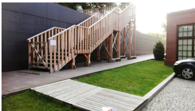
Widok na schody przy Murze Pamięci od strony Muzeum.

Główna konstrukcja schodów wykonana jest z drewna pełnego. Główne belki schodów podwójne 10x20 cm. Słupy schodów 10x20 cm pod spocznikami. Stężenia słupów 4x8 cm. Belki podwalinowe 10x20 cm. Słupy schodów dwubiegowych zespolone 8x16 cm (4 szt. 4x8 cm). Spoczniki na belkach krawędziowych 4x20 cm. Belki poszycia spoczników dwuteowe 8x16 cm (3 szt. 4x8 cm) co 50 cm.