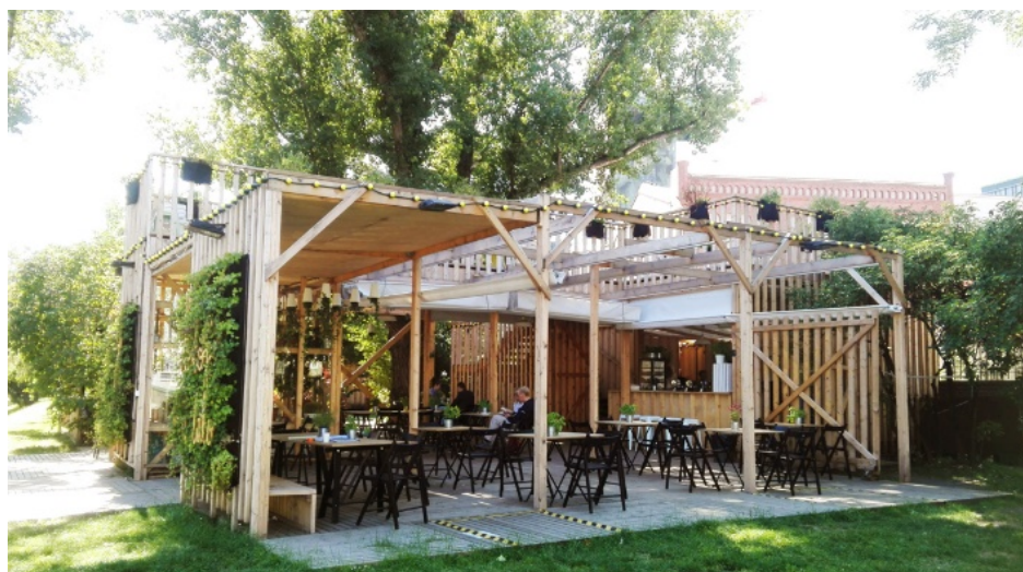
Widok na altanę wejściową i pawilon główny.