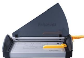
zdjęcie poglądowe