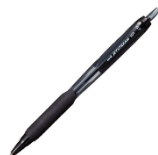
zdjęcie poglądowe