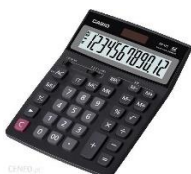
zdjęcie poglądowe