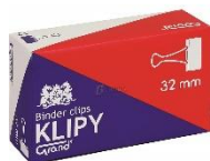
zdjęcie pogładowe