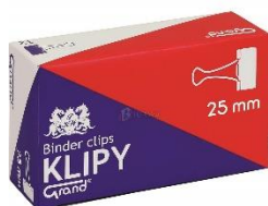
zdjęcie pogładowe