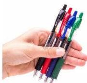
zdjęcie poglądowe