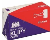
zdjęcie pogładowe źródło: Klipsy biurowe 41mm Grand a'12 - Biurwa.pl