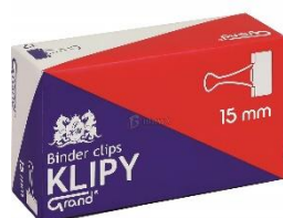
zdjęcie pogładowe