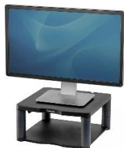
zdjęcie poglądowe: