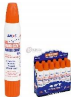
zdjęcie poglądowe źródło: Klej w płynie Amos biały 34ml - Biurwa.pl