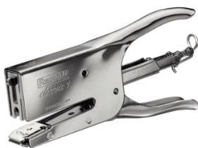
zdjęcie poglądowe