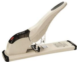
zdjęcie poglądowe: źródło: Zszywacz Kangaro Ds-23S20FI Zszywa Do 170 Kartek Mix Kolorów | ABIBO