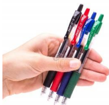
zdjęcie poglądowe