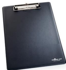
zdjęcie poglądowe