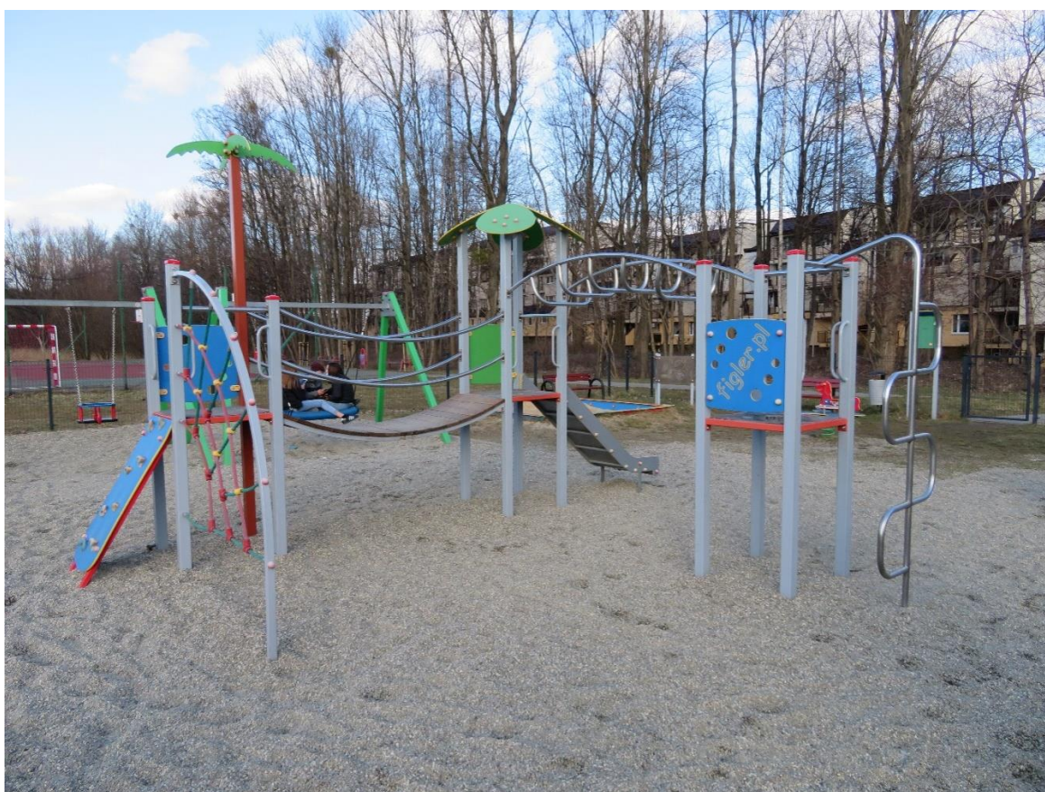
zdj. 2 – istniejący plac zabaw – do rozbudowy