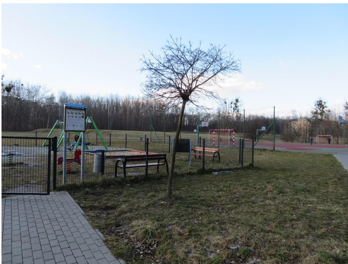
zdj. 4 – istniejący plac zabaw – do rozbudowy