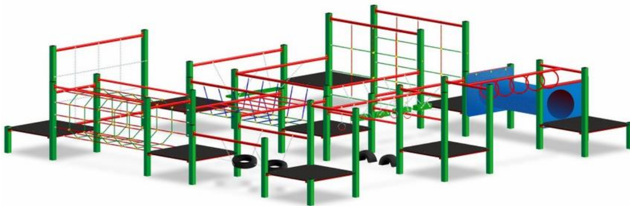
rys. 2 – przykładowy zestaw sprawnościowy