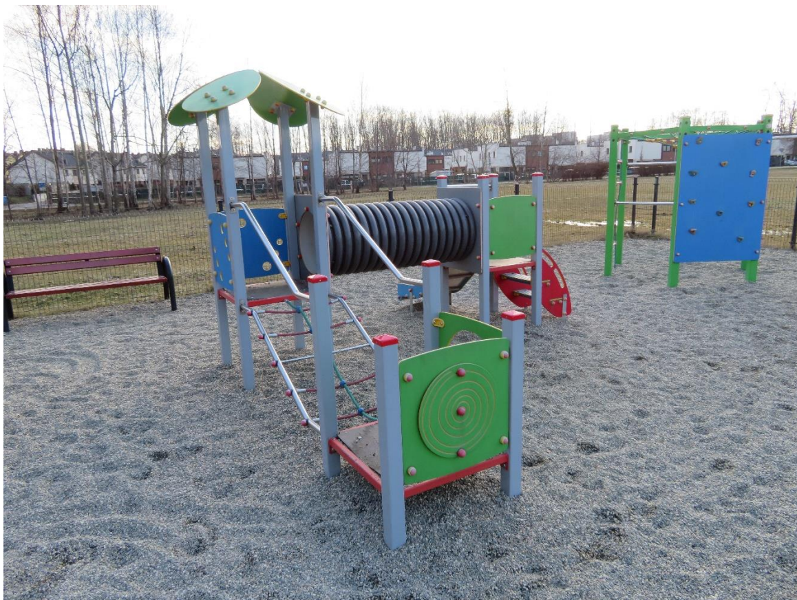
zdj. 1 – istniejący plac zabaw – do rozbudowy