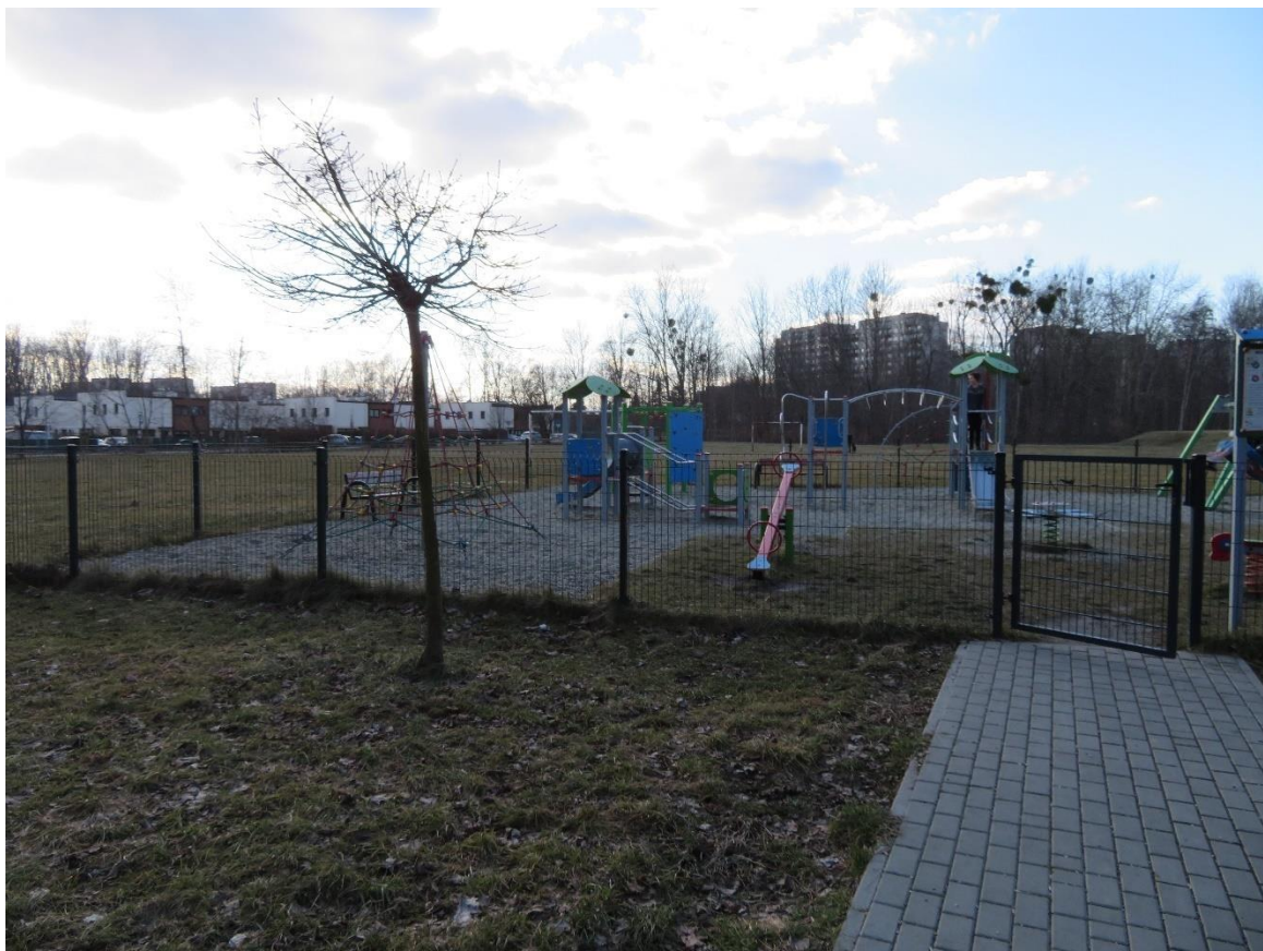
zdj. 3 – istniejący plac zabaw – do rozbudowy