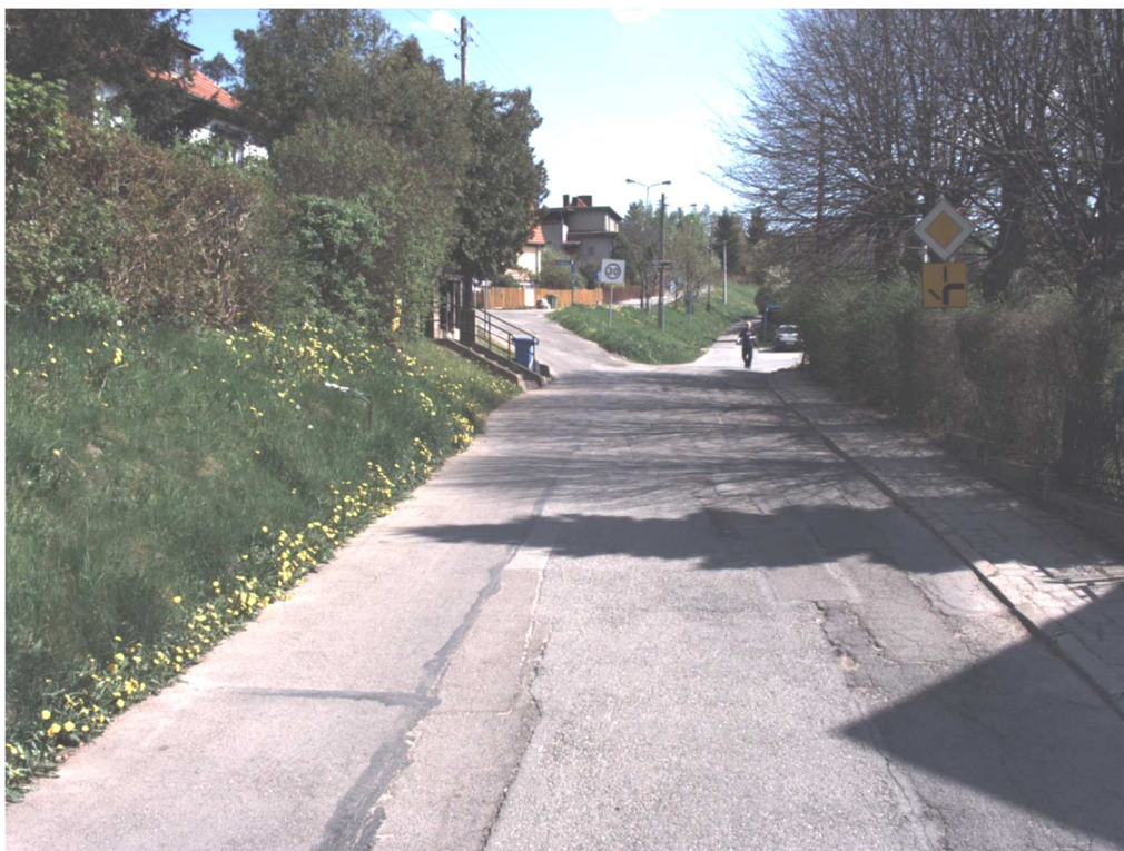
Fot 3. Km 0+104