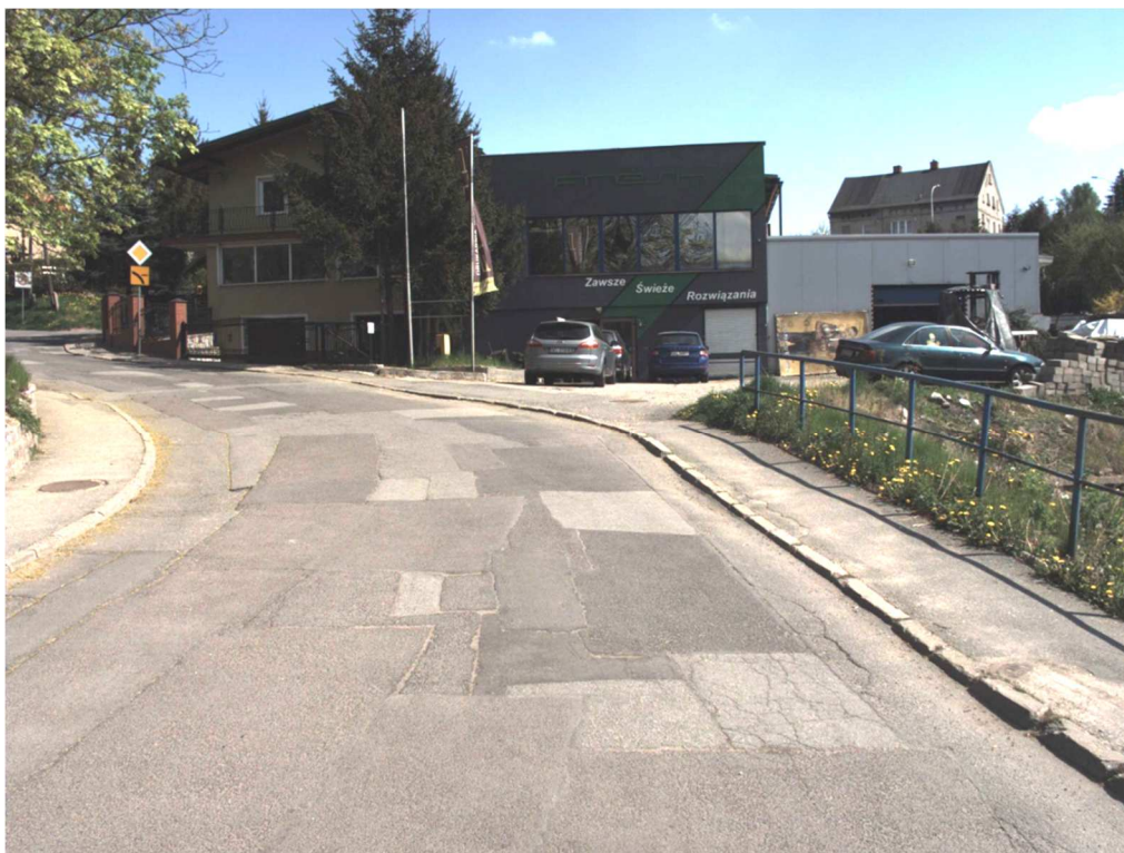
Fot 1. Km 0+029