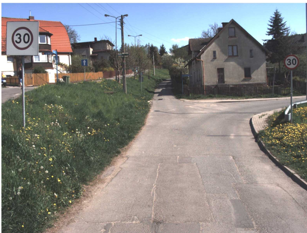
Fot 4. Km 0+140