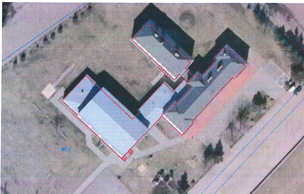
Rys. 1. Szkoła Podstawowa im. H. Kołłątaja w Uhowie, ul. Szkolna 19, 18 – 100 Uhowo, działka nr 165/2 (panele o mocy 40 kWp montowany na dachu)

zminimalizowania strat energii elektrycznej na przewodach. Na rysunku 1 przedstawiono proponowaną lokalizację mikroinstalacji w postaci systemu fotowoltaicznego na działce objętej opracowaniem.