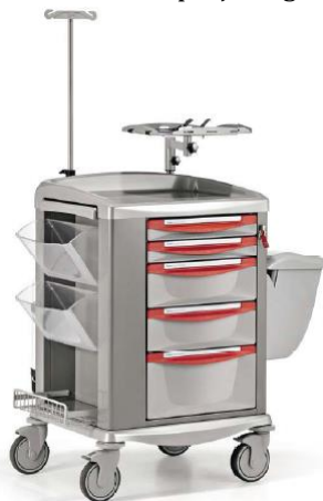
(Zdjęcie poglądowe oferowanego wózka)

17. Czy (w pkt. 14) Zamawiający wyrazi zgodę na zaoferowanie wózka, w którym dodatkowe akcesoria mocowane bezpośrednio do korpusu wózka lub do specjalnego stelaża nad blatem wózka?