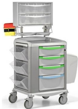
(Zdjęcie poglądowe oferowanego wózka)

33. Czy (w pkt. 12) Zamawiający wyrazi zgodę na zaoferowanie wózka, w którym dodatkowe akcesoria mocowane bezpośrednio do korpusu wózka lub do specjalnego stelażu nad blatem wózka?