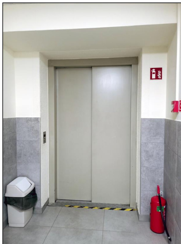
Typowy przystanek dla pozostałych kondygnacji