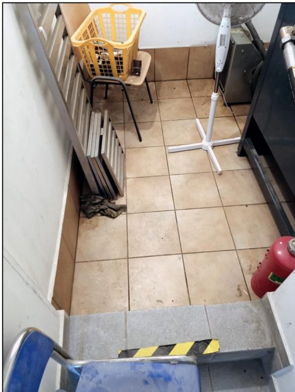
Maszynownia – posadzka