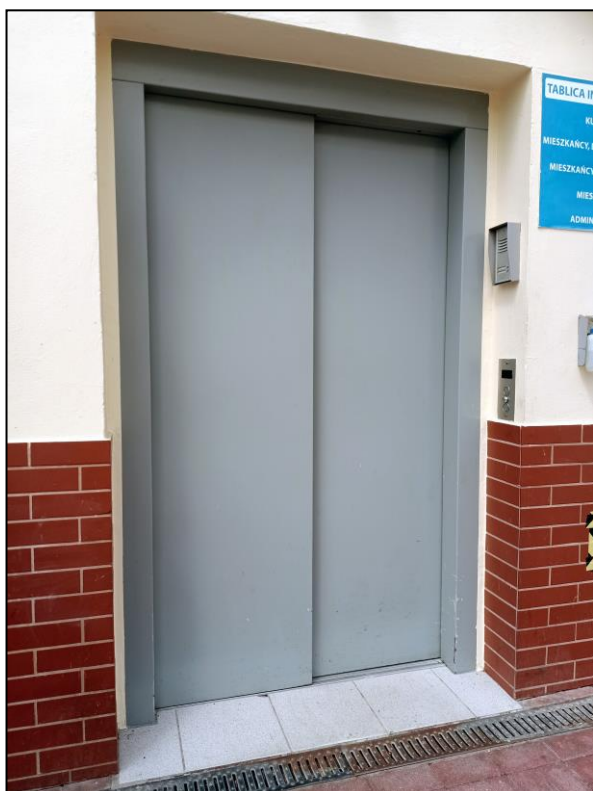
Przystanek „0” (zewnętrzny, poziom terenu)