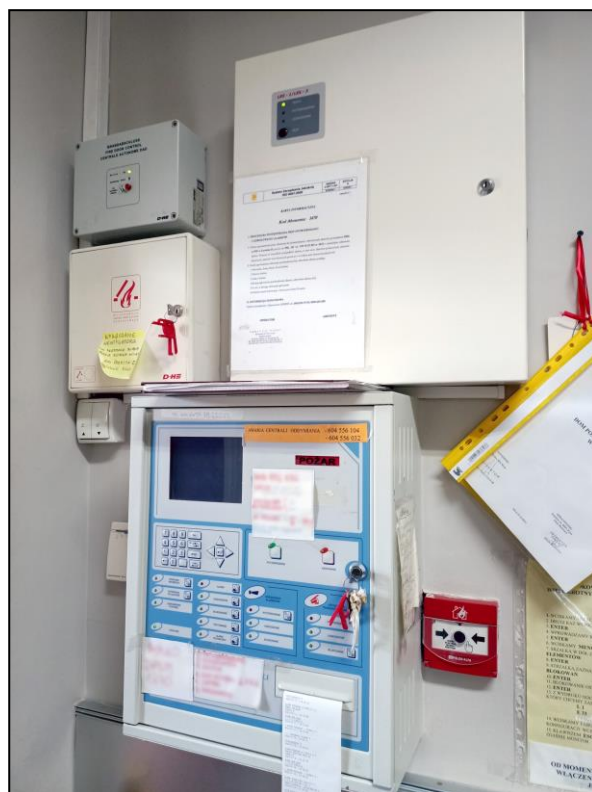
Centrala sygnalizacji pożaru POLON 4200 znajdująca się w dźwurce na wysokim parterze