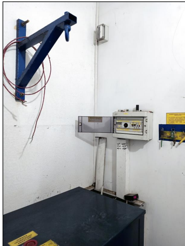
Maszynownia – tablica wstępna (rozdzielnica)