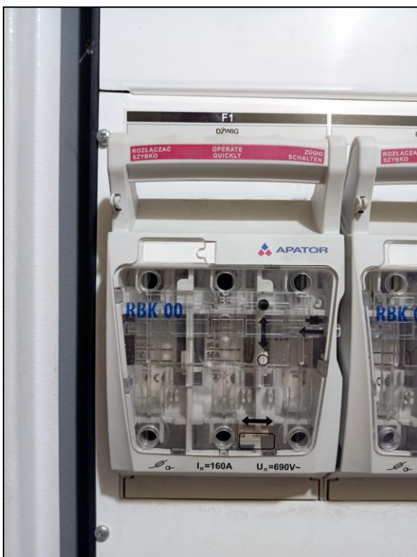
Zabezpieczenie linii zasilającej dźwig w TG znajdującej się w sąsiednim budynku