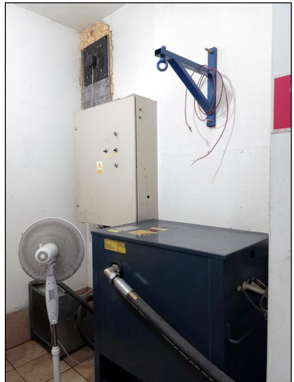
Maszynownia – podzespoły dźwigowe