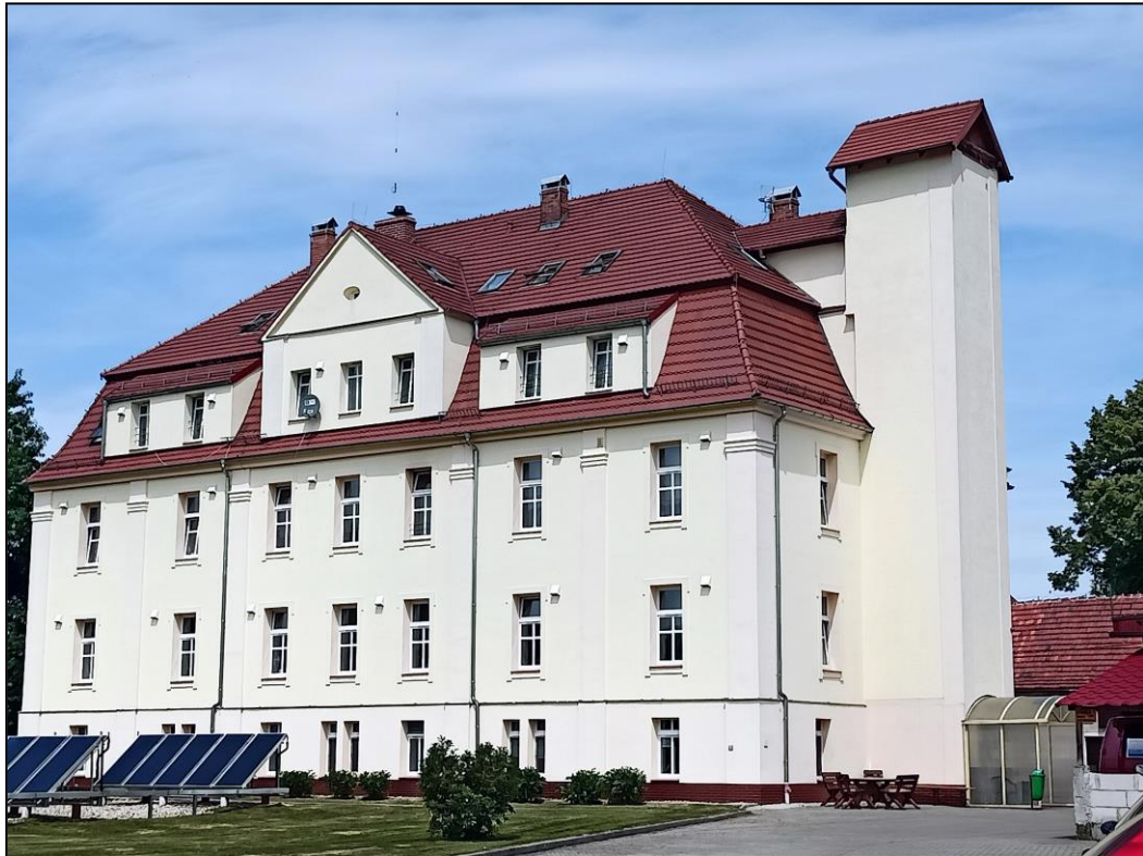
Widok budynku, z prawej strony dobudowany szysz dźwigowy