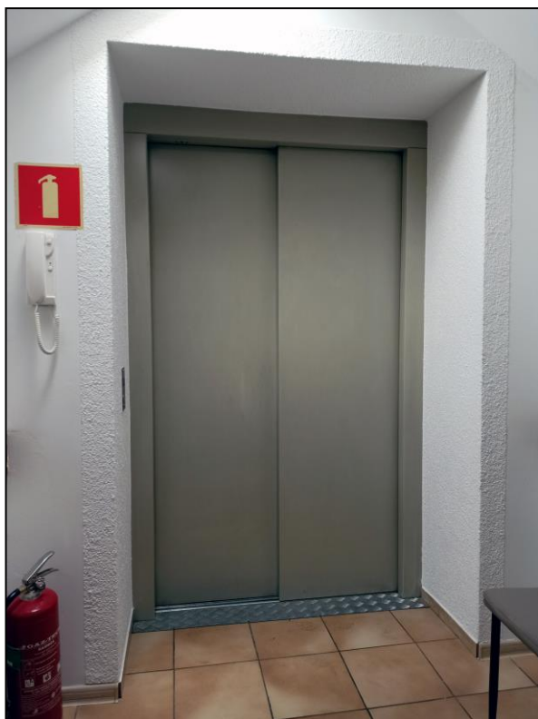
Przystanek „4” na ostatniej kondygnacji (biura)