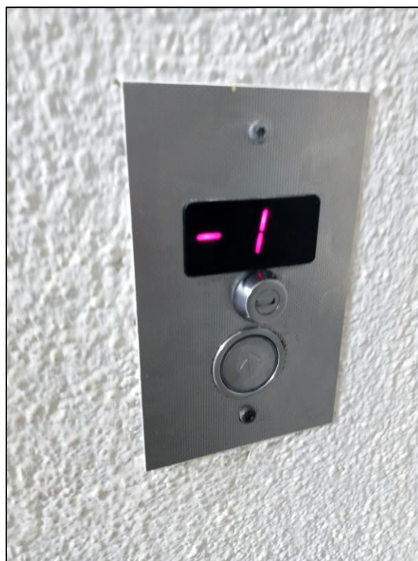
Typowa kasetka wezwań na przystanku