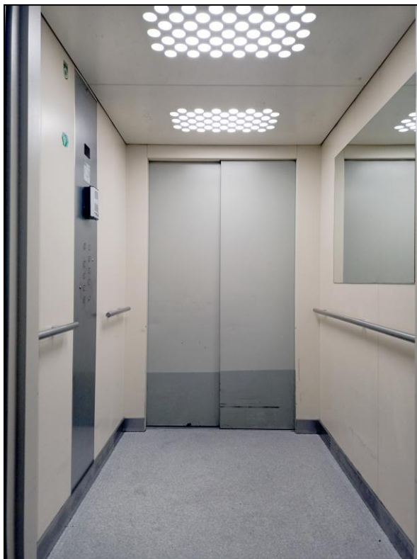
Kabina istniejącego dźwigu