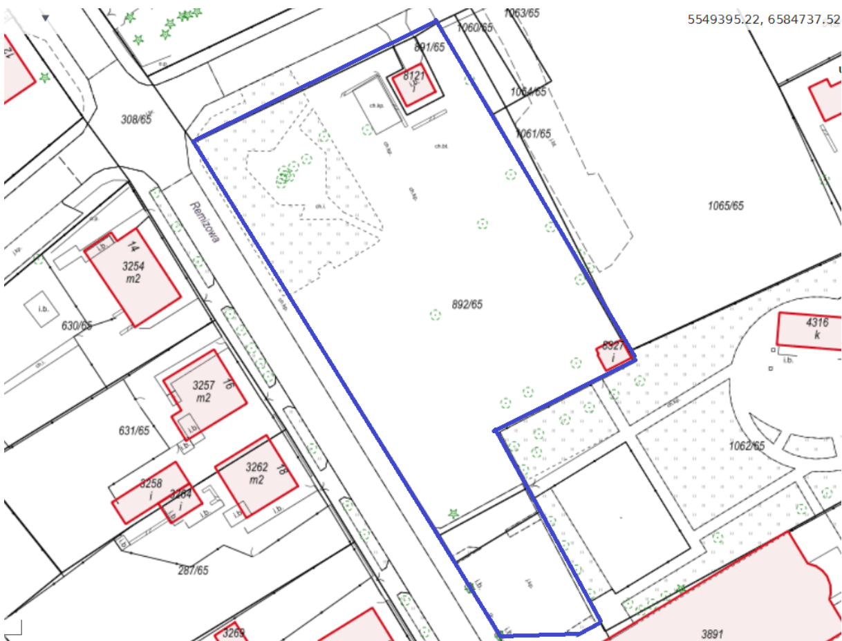
Rys.1 obszar realizacji robót

Obszar objęty realizacją robót przedstawiono poniżej (obszar zaznaczony kolorem niebieskim na rysunku nr 1), linię nasadzeń tawuły wczesnej przedstawiono kolorem zielonym na rysunku nr 2