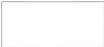
Pieczęć firmowa Wykonawcy