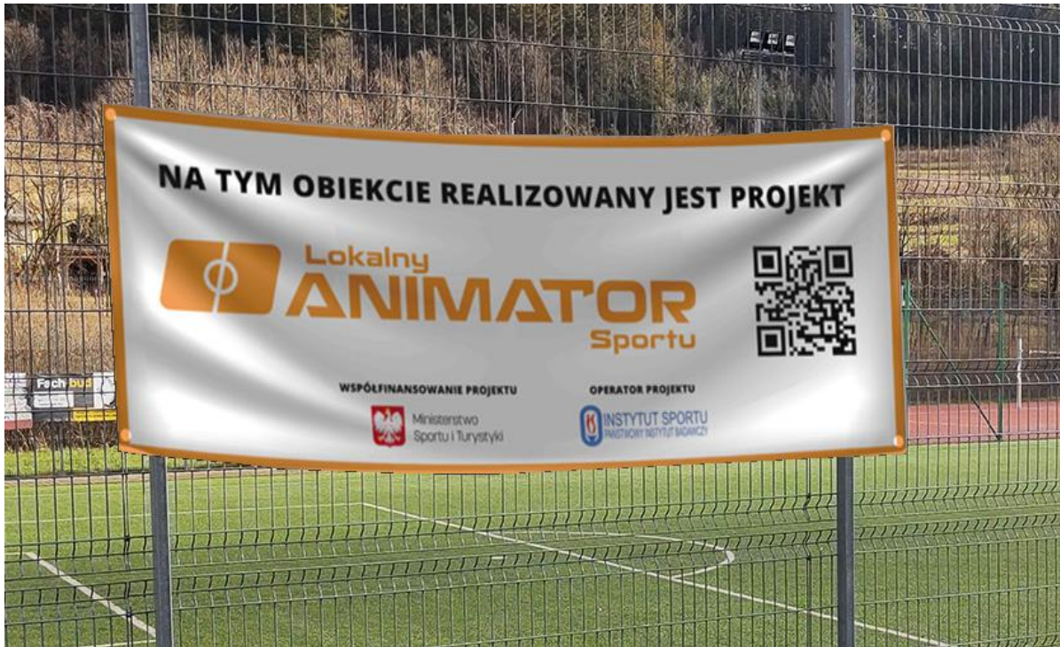
Rys. 4 – baner 200 x 120 cm*

BANER - 1650 sztuk, wymiar 200 cm x 120 cm, materiał frontlit min. 510g, oczkowanie co 50cm, zgrzewany dookoła, druk jednostronny w pełnym kolorze, plik produkcyjny dostarcza zamawiający.