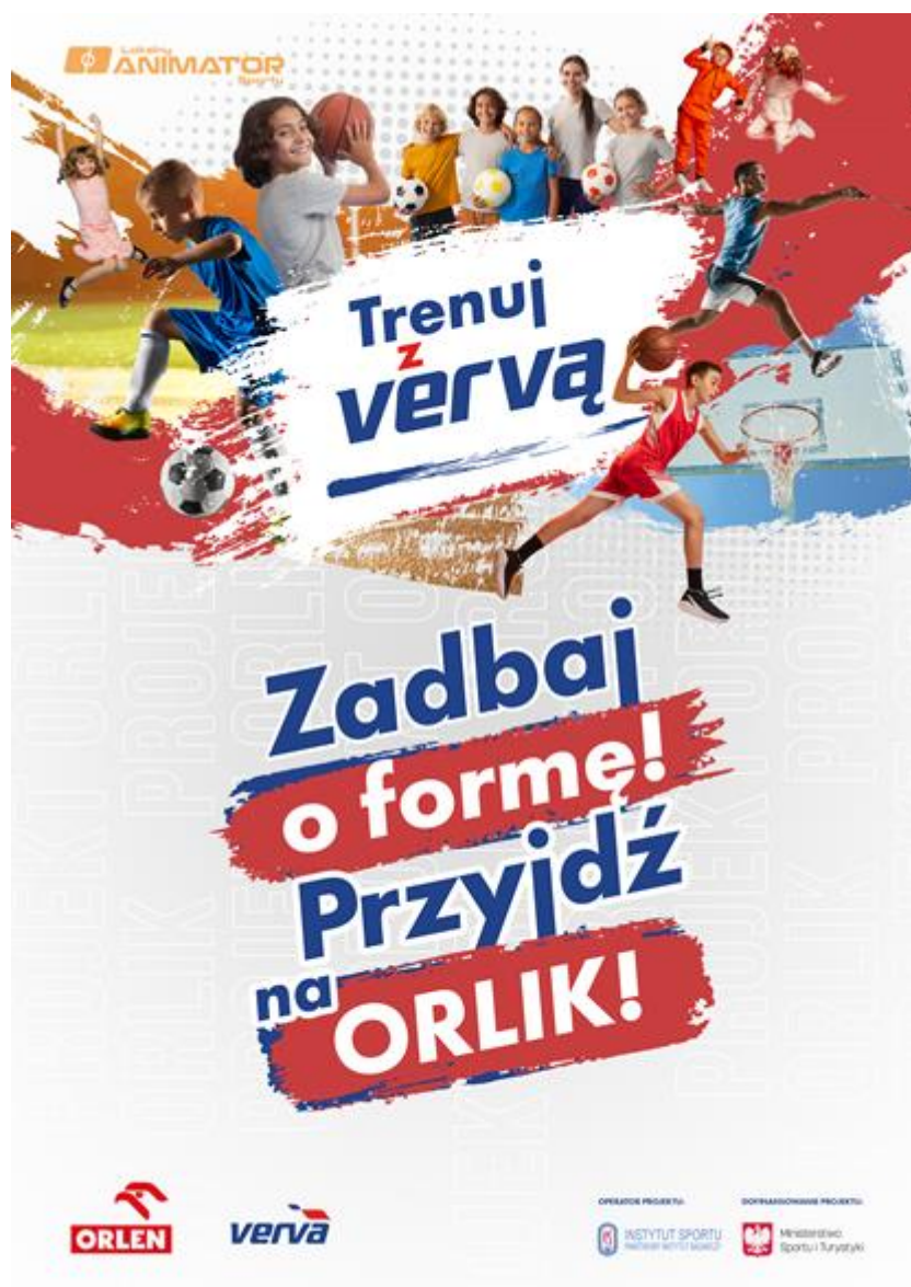
Rys. 1 – plakat A3 nr 1*