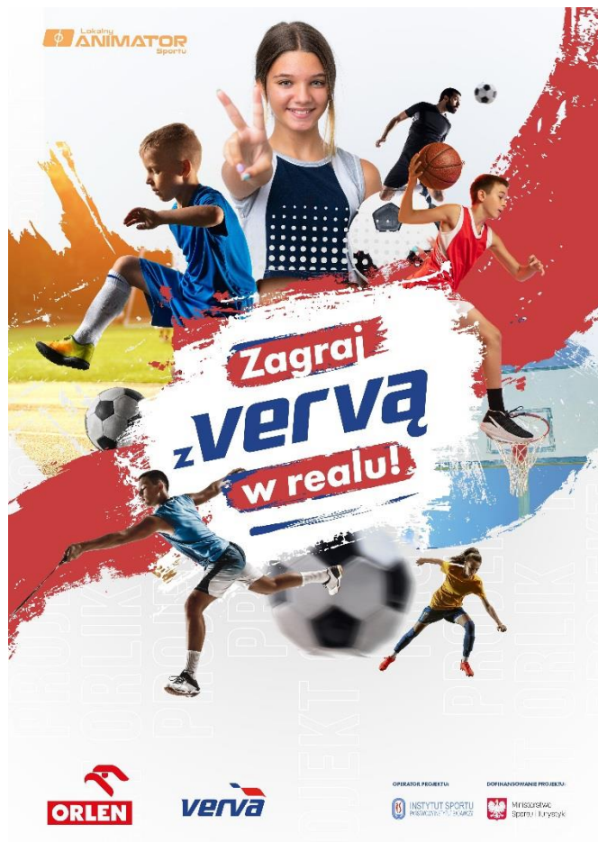
Rys. 2 – plakat A3 nr 2*